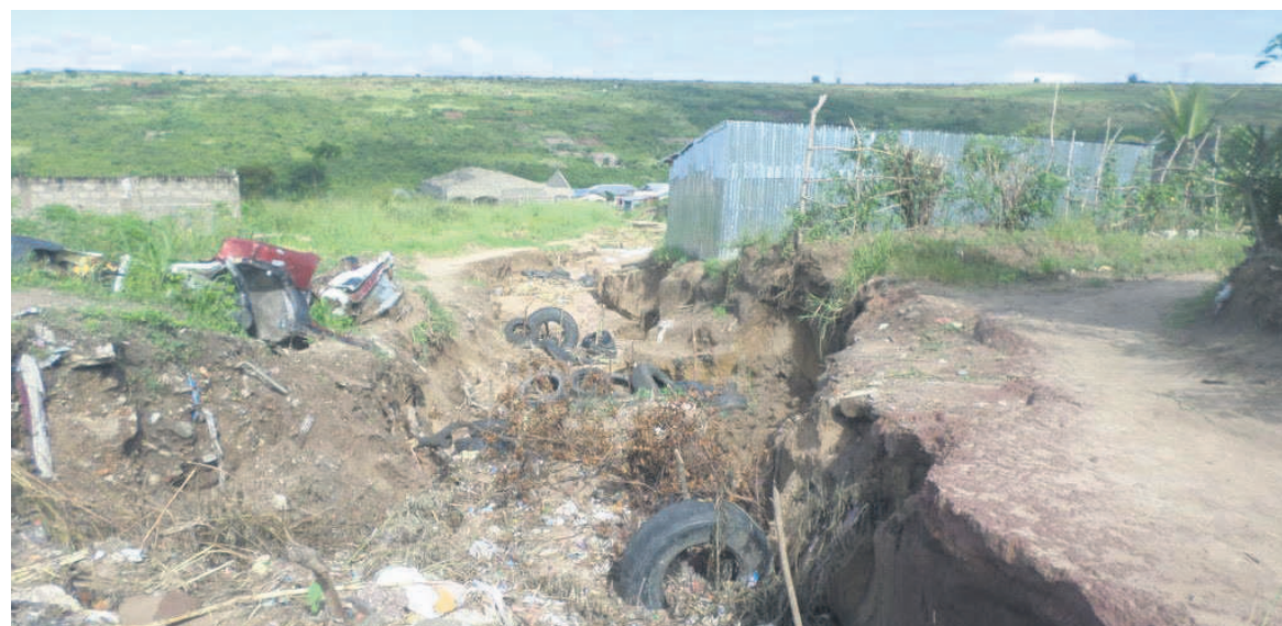
Une vue du quartier Saint-Denis/Adiac

Mfilou qui a donné naissance à une partie de Djiri a repris son territoire, se conformant à la loi n°9-2011 du 17 mai 2011, portant création de l'arrondissement n°8 Madibou et de l'arrondissement n°9 Djiri, adoptée par le Parlement et promulguée la même année par le président de la