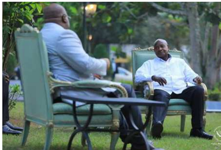
Félix Tshisekedi et Yoweri Museveni en tête-à-tête

Les chefs d'Etat du Congo-Kinshasa, Félix Tshisekedi; du Congo-Brazzaville, Denis Sassou N'Guesso; de l'Ouganda, Yoweri Museveni; et du Togo, Faure Gnassingbé Eyadéma, se sont retrouvés le 12 février à Oyo, dans le département de la Cuvette.