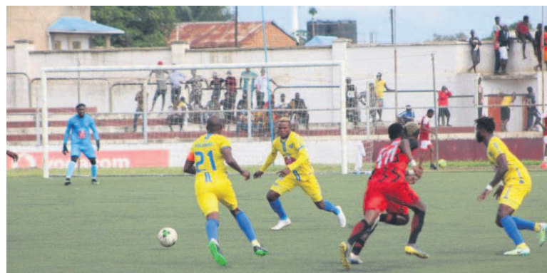
Lupopo vainqueur de Dauphin noir, le 12 février 2022.