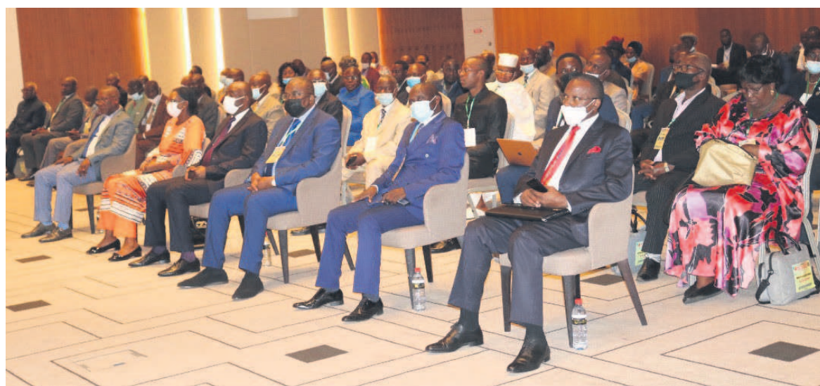
Les participants

Quant aux sources de financement innovant, les participants ont demandé aux différents acteurs de mener