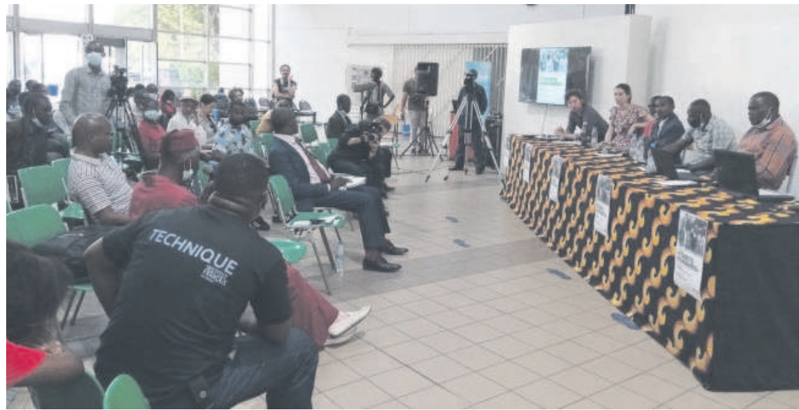
Les panelistes et les participants lors de la table ronde

les formes de racisme auxquelles ils font allusion ne sont pas seulement observées au niveau de la population locale mais aussi des institutions. C'est surtout ces formes de discrimination qui ont