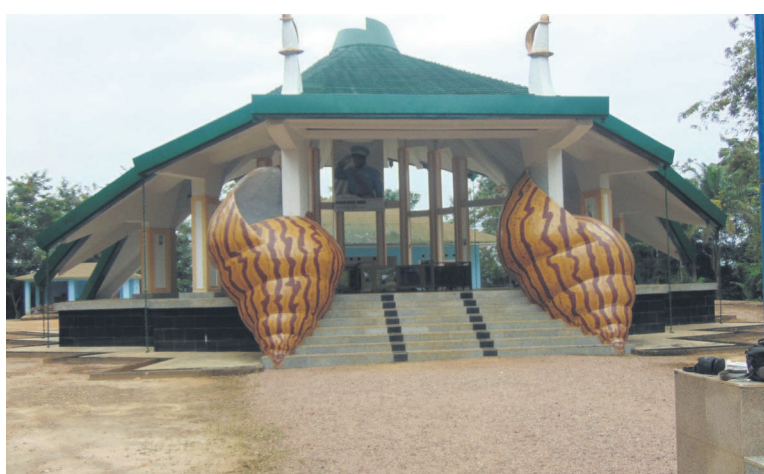
Mausolée Joseph Kasa-Vubu.

La décision ressort de la quarantième réunion du Conseil des ministres du gouvernement de la République présidée, le 11 février dernier par visioconférence, par le président de la République, Félix-Antoine Tshisekedi. La remise en état du lieu où repose pour l'éternité l'âme du premier chef d'Etat du Congo indépendant résulte d'un constat amer, celui de l'état pitoyable dans lequel se retrouve aujourd'hui ce site mortuaire. Situé à 17 km de la cité de Tshela, précisément dans le village Lukamba Mbemba, en province du Kongo central, le mausolée Joseph-Kasa-Vubu, dans son état actuel, est sans commune mesure avec la dimension intellectuelle, politique et sociale de l'illustre disparu. Préoccupé par cet état des choses et surtout par devoir de mémoire, le président Félix-Antoine Tshisekedi a pris l'option de viabiliser et de sécuriser ce site, afin d'en faire « un lieu de recueillement et de tourisme historique ».