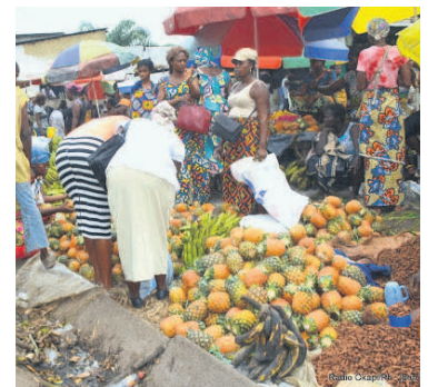
Le marché de Matadi Kibala ont été érigées sur le site. Le chef de l'exécutif urbain a, de ce fait, donné des instructions afin que soit déguerpi tout occupant illégal.

Le gouvernement provincial a déjà identifié deux sites pour établir d'autres lieux de négoce. Il a, par ailleurs, été constaté que plusieurs constructions anarchiques