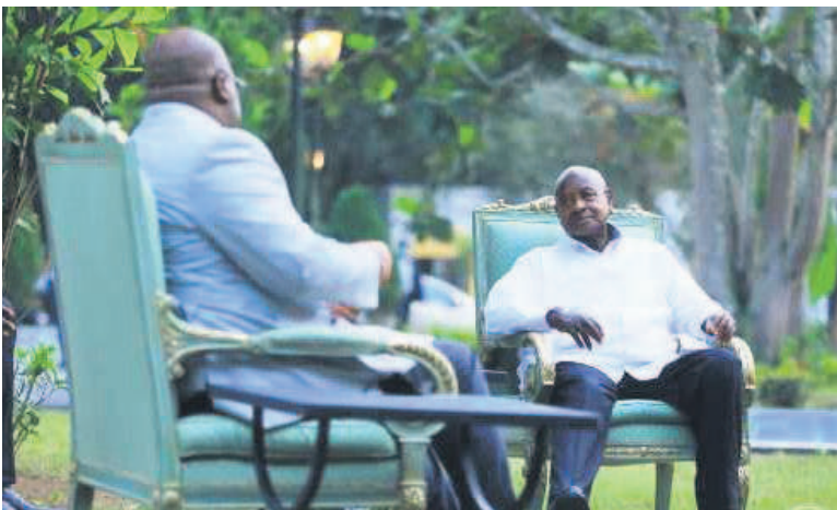
Félix Tshisekedi et Yoweri Museveni en tête-à-tête

C'est au complexe Ngolodoua à Oyo, en République du Congo, que les chefs d'Etat du Congo-Kinshasa, Félix