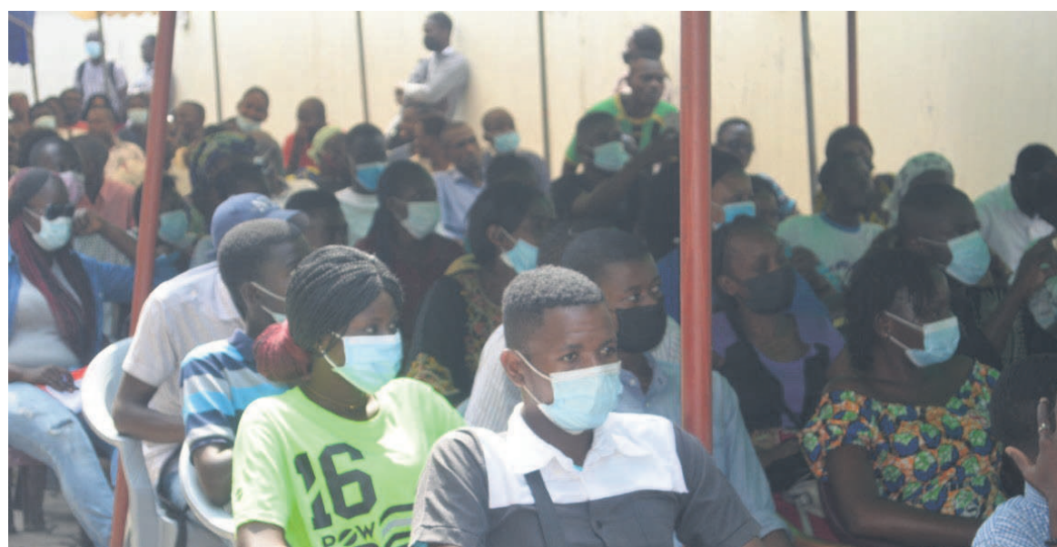
Les bénéficiaires des formations du PDCE/Adiac

A en croire Auxence Léonard Okombi, la préoccupation du PDCE est de permettre aux apprenants de poursuivre et terminer leur formation dignement. Il