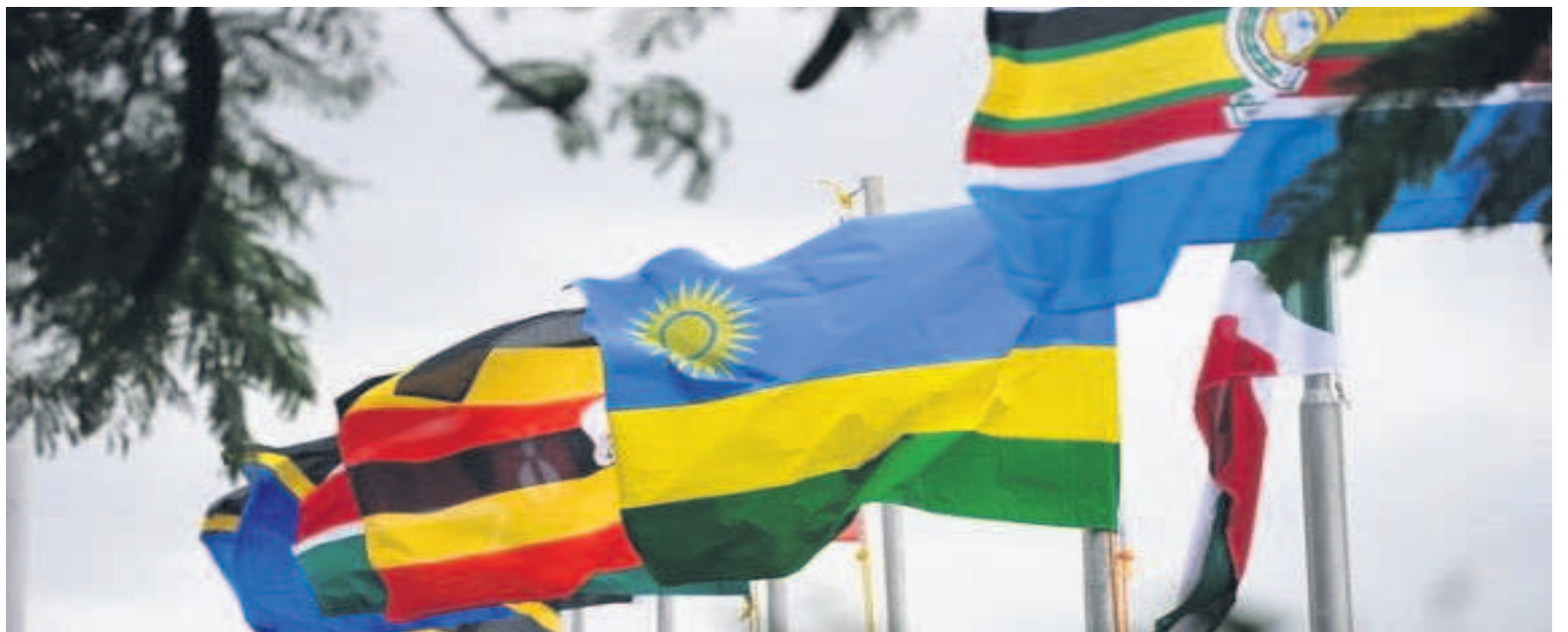
Les drapeaux des six Etats membres de la CAE