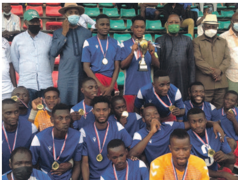
Le FC Nathaly's posant avec les officiels après réception de son trophée

À la reprise, alors que Nico-Nicoyé savourait encore cet avantage, l'équipe B de Nathaly's s'est ressaisie avant d'imposer un nouveau rythme à son adversaire qui a fini par céder à la pression en encaissant le but