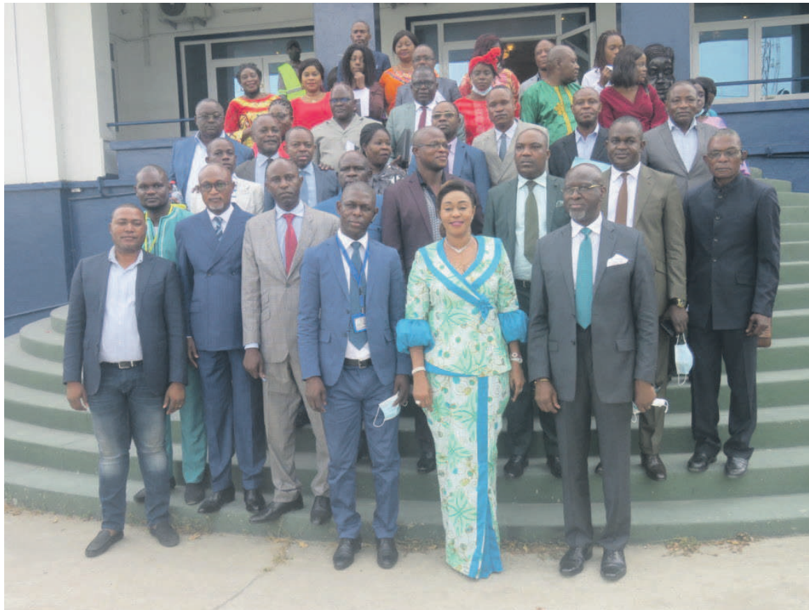
Les participants à la cérémonie.

«L'application de cette nouvelle réforme débute à Pointe-Noire par la formation des utilisateurs des machines à timbrer. Cette formation s'inscrit dans le cadre du processus de modernisation de la gestion des finances publiques dans lequel s'est lancée la République du Congo. L'objectif de ce processus est de réformer, informatiser et interconnecter toutes les régies financières afin de simplifier, moderniser et