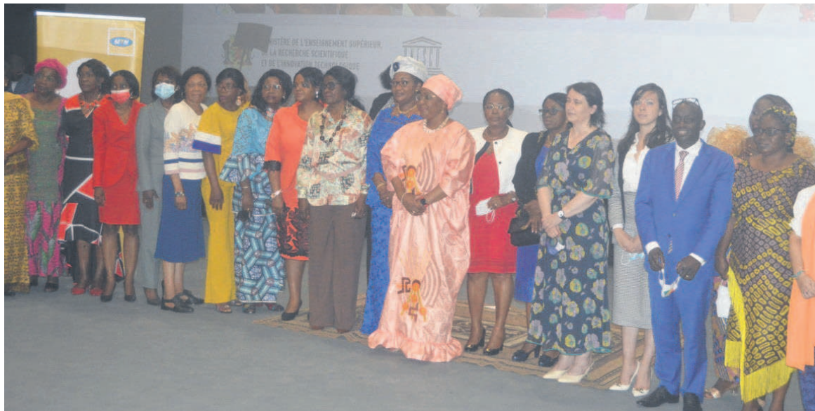
Les femmes de science avec les membres du gouvernement