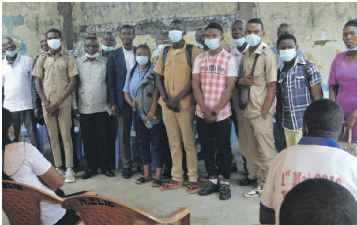
Les participants à la campagne de lancement des TD/Adiac

Le président de Diata-Château Innovation a ajouté que cette initiative est particulière du fait qu'elle sera strictement suivie puis évaluée. Les élèves bénéficieront aussi des séances de networking sur l'entrepreneuriat et l'orientation académique. Ceux ayant déjà débuté les cours ont promis de rester assidus durant toute la campagne des TD. Ils ont invité leurs amis à remplir les fiches d'inscription. « C'est la deuxième fois que je vais passer le baccalauréat. L'année dernière, j'avais du mal à comprendre les cours de