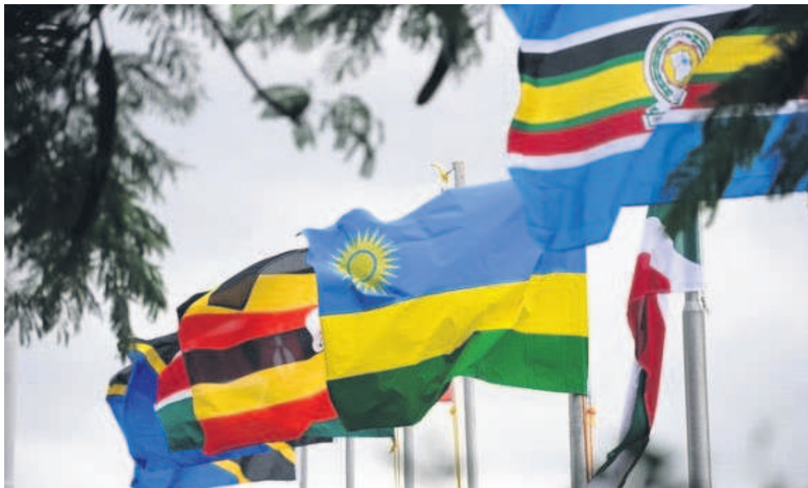
Les drapeaux des six Etats membres de la CAE

Dès le début de juin 2019, Kinshasa avait exprimé, par son truchement, dans une lettre à Paul Kagamé, alors président en exercice du Sommet des chefs d'Etat de la CAE, sa volonté de devenir le septième Etat membre de cette organisation sous-ré-