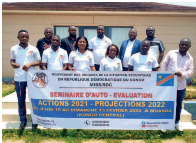
La photo de famille des participants au séminaire

Le Mouvement des indignés de la situation sécuritaire en République démocratique du Congo (MISS-RDC) a tenu, du 10 au 13 février dans la ville de Moanda, au Kongo central, un séminaire d'auto-évaluation. Au-delà de l'organisation structurelle de ce mouvement, ce séminaire a permis une évaluation sans complaisance de la situation sécuritaire dans le pays.