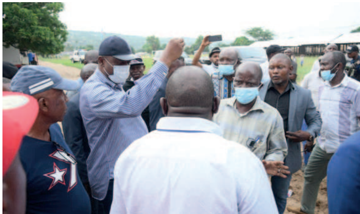
Le gouverneur Ngabila s'entretenant avec les services sur les sites choisis

Le second site visité, toujours dans la commune de Mont Ngafula, a été celui aménagé pour la construction d'une zone de négoce moderne. Sur place, Gentiny Ngabila Mbaka a recueilli les doléances de la population riveraine à travers quelques chefs coutumiers venus l'accueillir. La population, qui n'a pas caché sa joie de voir le premier citoyen de la ville,