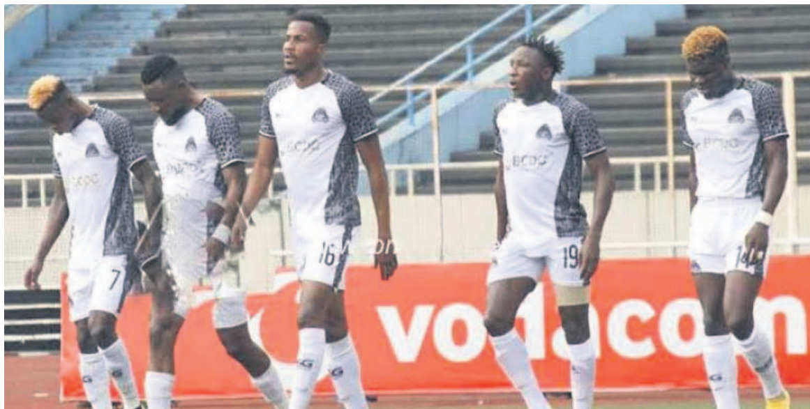
Mazembe a craqué à Alexandrie face à Al Masry