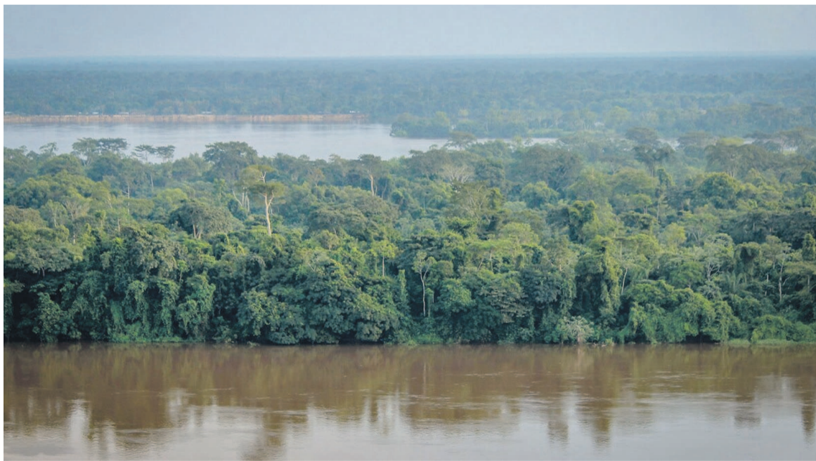
Une aire protégée du Bassin du Congo

La réunion du groupe de travail de la Comifac soulève des enjeux à défendre dans le cadre de la préservation forestière, un pari important en guise de levier stratégique de la préservation de la biodiversité régionale. La Comifac milite pour une utilisation durable des ressources naturelles, un partage juste et équitable des avantages découlant de l'exploitation des ressources génétiques, une santé humaine et environnementale, un bien-être