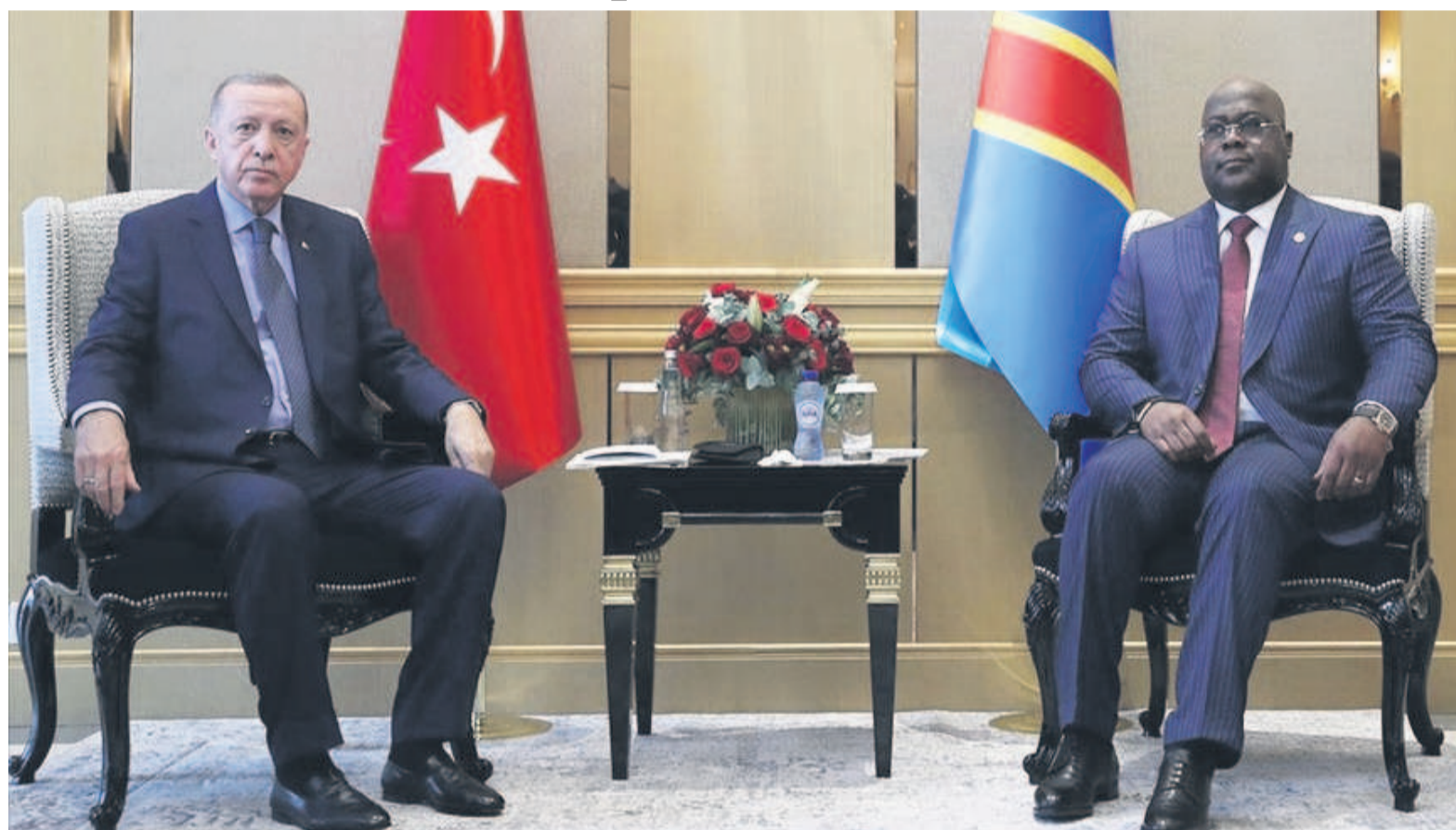
Félix Tshisekedi et Recep Tayyip Erdogan