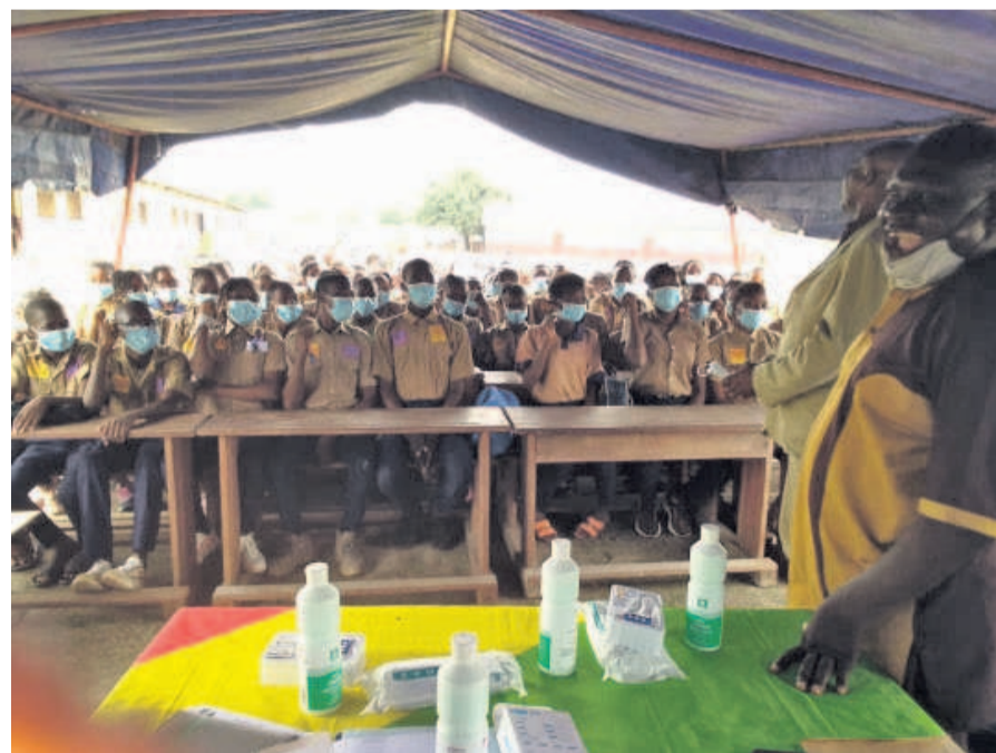
Les élèves sensibilisés à la vaccination (DR)

Les élèves handicapés ont été à cette occasion édifiés sur les gestes barrières, les dégâts causés par la maladie dans le monde et plus particulièrement au Congo. Gustavine Louzolo a exhorté les jeunes à ob-