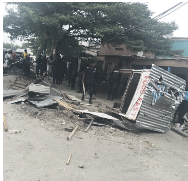
Des éléments de la police/Bandalungwa sur le terrain de l'opération