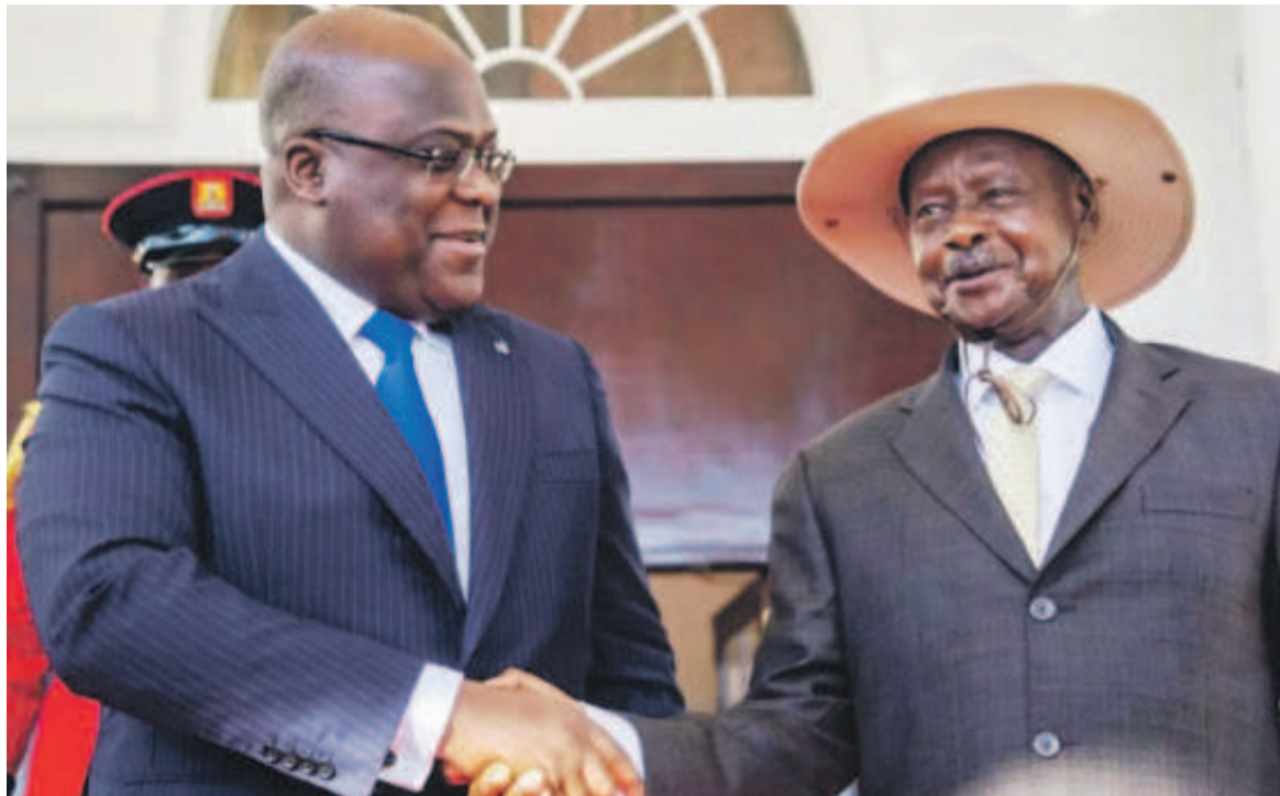
La vice-ministre de la Santé publique, Véronique Kilumba

Il y a lieu également de mettre un point d'honneur aux initiatives tendant à restaurer la paix à l'Est de la RDC, épicerie