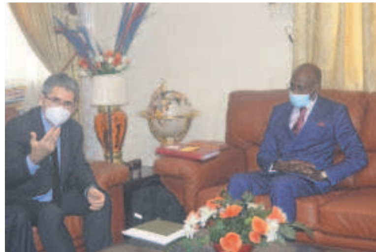
La délégation de la Banque mondiale avec le ministre de l'Enseignement supérieur