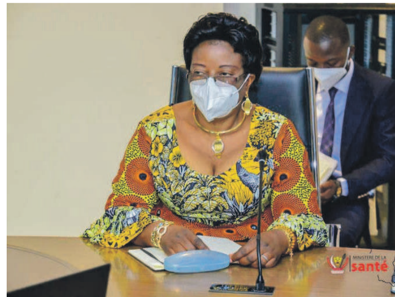
La vice-ministre de la Santé publique, Véronique Kilumba