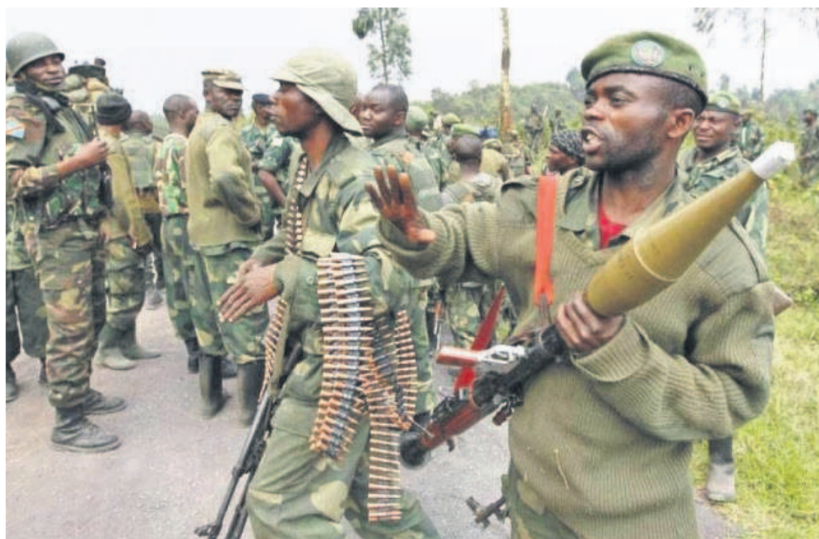
Des éléments des FARDC au front

Selon le lieutenant-colonel Andres Silvano Mtali, la présence constante de la Force dans les principaux points chauds a assuré la sécurité dans ces zones, garantissant la liberté de mouvement. Cependant, a-t-il ajouté, « la situation sécuritaire du secteur nord demeure préoccupante dans la mesure où divers groupes (Codeco, Zaire et Fpic) lancent actuellement des attaques contre des camps de personnes déplacées ». Face à cette situation, la Force a intensifié ses activités opérationnelles dans ce secteur pour atténuer et contrecarrer toute menace potentielle,