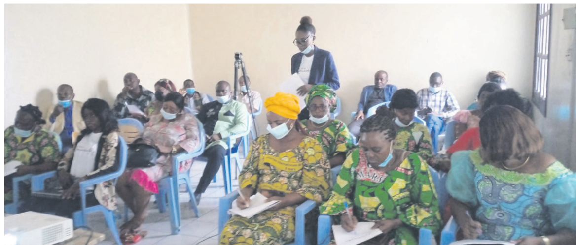
Des femmes de l'IGN

Les femmes de l'Institut géographique national (IGN) ont échangé, le 9 mars, à Brazzaville, sur « le leadership féminin » dans le cadre de la célébration de la Journée internationale de la femme.