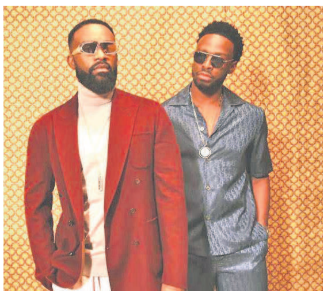
Fally Ipupa et Prince Dadju.

La star de la rumba congolaise se produira, le 23 juillet prochain, en Belgique, dans le cadre d'une grande journée internationale de la culture francophone, lors du festival qui se déroulera du 20 au 23 juillet. Organisées depuis 1994, « Les Francofolies de Spa » sont un festival de musique qui se tient dans la ville de Spa, en Belgique. Fally Ipupa se produira le 23 juillet en début de soirée sur la scène Proximus. Les éditions de 2020 et de 2021 des Francofolies de SPA avaient été annulées à cause de la pandémie de coronavirus.