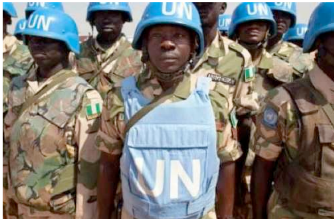
Des casques bleus de la Monusco

A en croire les sources, cette mission onusienne en République démocratique du Congo (RDC) aurait déjà été notifiée officiellement quant à la décision du gouvernement ukrainien de retirer son contingent militaire. Il s'agit précisément, apprend-on, du personnel et des hélicoptères, y compris d'autres équipements fournis à la Monusco. L'impact de ce retrait est en cours d'examen, précise-t-