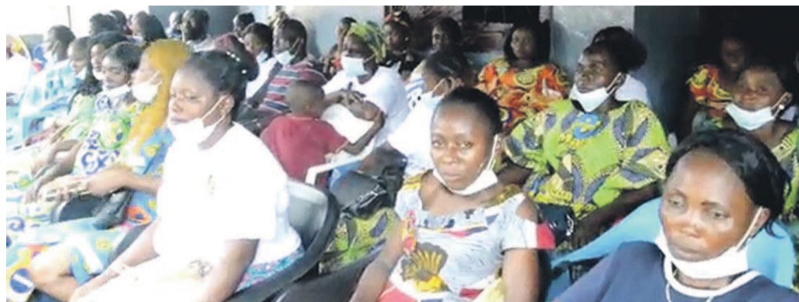
Les femmes du PPAD Dolisie

Il a également demandé aux femmes du PPAD de se faire en-