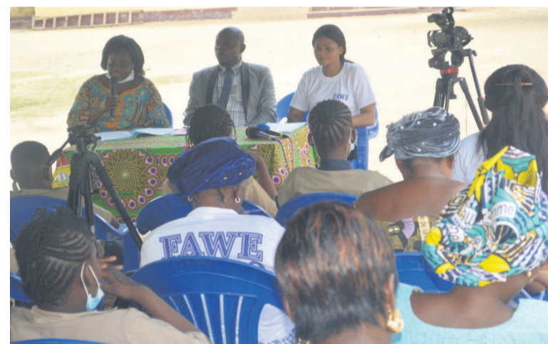
Les participants au débat

Dans le cadre de la célébration de la Journée internationale des droits des femmes, le Forum des éducatrices (Fawe) a organisé, le 8 mars, une causerie-débat sur les droits et devoirs des jeunes filles ainsi que des femmes.