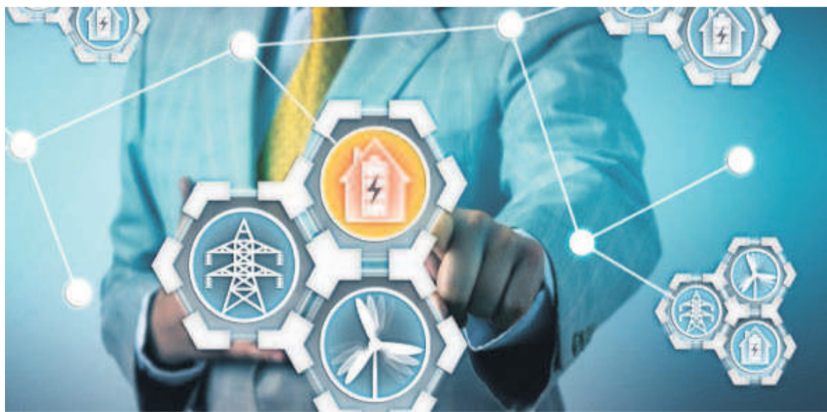
Le partage des connaissances technologiques à travers l'Afrique est à encourager

économique et social des Nations unies, la CEA est l'une des cinq commissions régionales ayant pour mandat d'appuyer le développement économique et social de ses