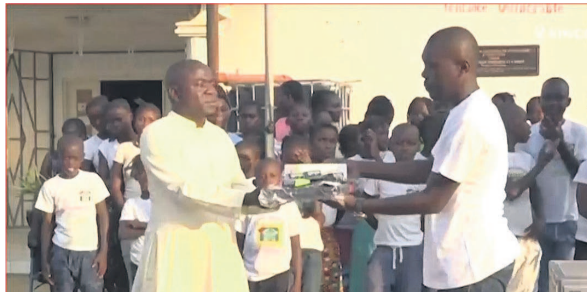
Le président de l'Amaco recevant le don d'un délégué de la Fondation Burotop