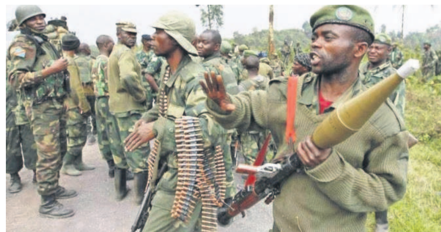
Des éléments des FARDC au front.