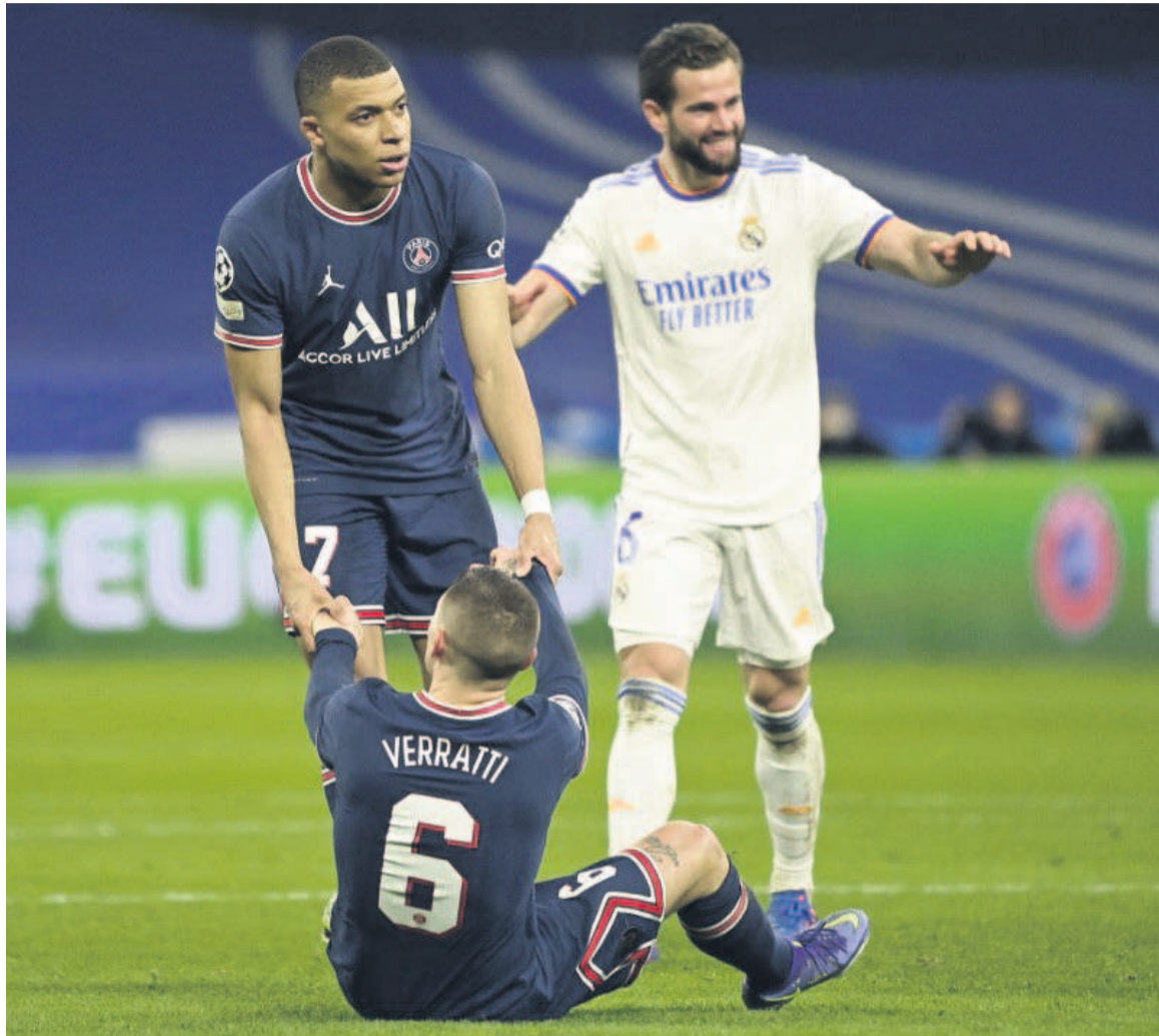
Mbappé et Verratti qui grimacent, le Real humilie le PSG

Le PSG a dominé trois mi-temps sur quatre, mais s'est totalement