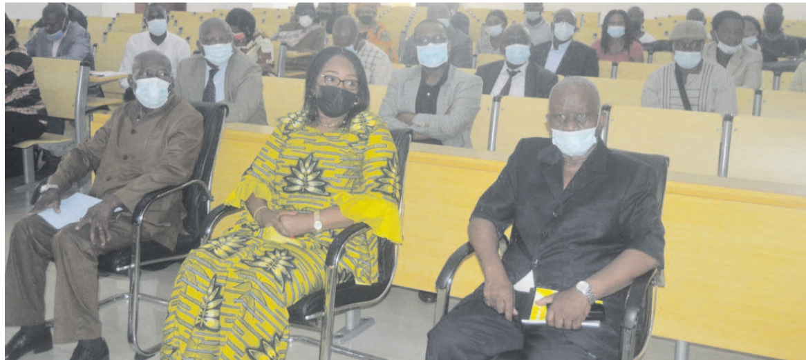
La ministre et des membres du comité d'organisation du Congrès panafricain des mathématiques.

Après la mise en place du comité local d'organisation du dixième Congrès panafricain de mathématiques que Brazzaville abritera en août prochain, la ministre de l'Enseignement supérieur, de la Recherche scientifique et de l'Innovation technologique, Delphine Edith Emmanuel, a échangé avec les membres de ce comité, le 14 avril, pour évaluer le travail déjà fait.