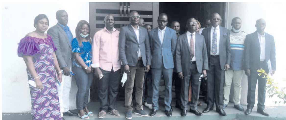
Les agents de l'IGN en formation.

Le 14 avril à Brazzaville, l'Institut géographique national (IGN) a lancé, à la faveur de ses agents, un séminaire de renforcement des capacités sur l'éthique face aux exigences du travail et de la performance ainsi que la déontologie administrative.