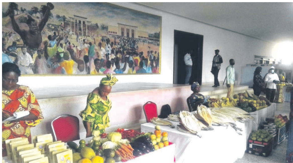
Une vue des produits exposés

Le ministère des Petites et moyennes entreprises organise, du 14 au 15 avril à Brazzaville, les journées portes ouvertes des acteurs du secteur informel sur le thème : « transformation du secteur informel pour une participation plus inclusive à la richesse nationale. »