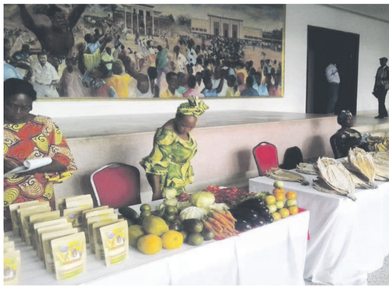
Une vue des produits exposés

Les journées portes ouvertes des acteurs du secteur informel se tiennent du 14 au 15 avril à Brazzaville sous la thématique « Transformation du secteur informel pour une participation plus inclusive à la richesse nationale ».