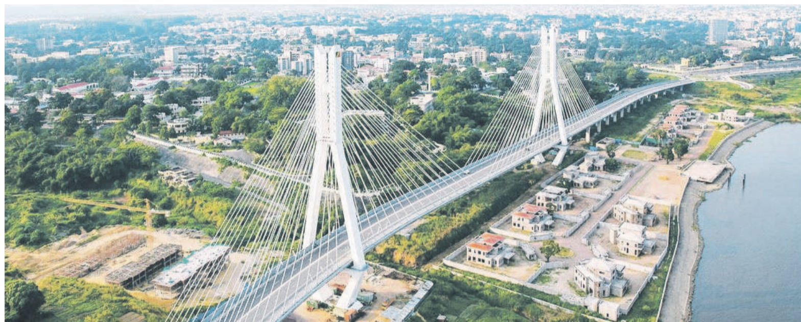
La corniche de Brazzaville