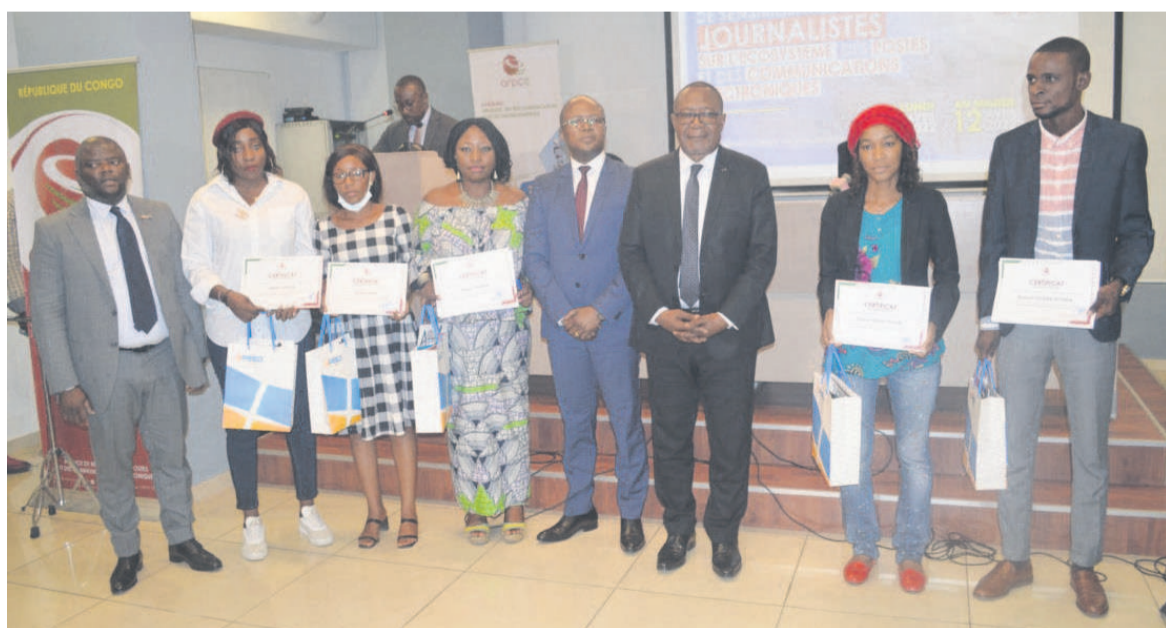
Quelques participants à l'atelier

L'Agence de régulation des postes et des communications électroniques (ARPCE) a organisé, du 11 au 12 avril, une session de sensibilisation des journalistes à l'écosystème des postes et des communications électroniques. Une manière de leur permettre de s'imprégner de l'évolution de ce secteur.