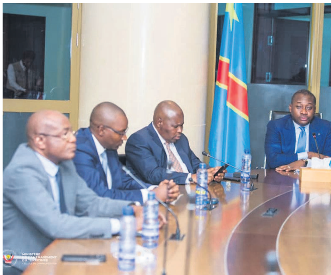
Le Conseil d'administration de l'Anser

Les membres du Conseil d'administration ont suivi avec intérêt les présentations faites par les deux partenaires et demandé à Anser de garder un œil sur ce projet d'électrification. Les quatre ministres ont suivi les présentations d'Equatorial power et Solektra par