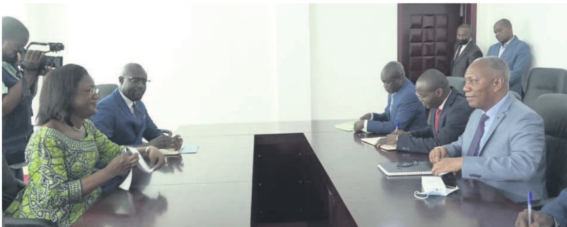
Les deux parties pendant la séance de travail

Le ministre d'Etat chargé de la Fonction publique, du Travail et de la Sécurité sociale, Firmin Ayessa, a échangé le 28 avril à Brazzaville avec la directrice du bureau-pays de l'Organisation internationale du travail, Ntéba Soumano, sur les dossiers de coopération entre les deux parties.