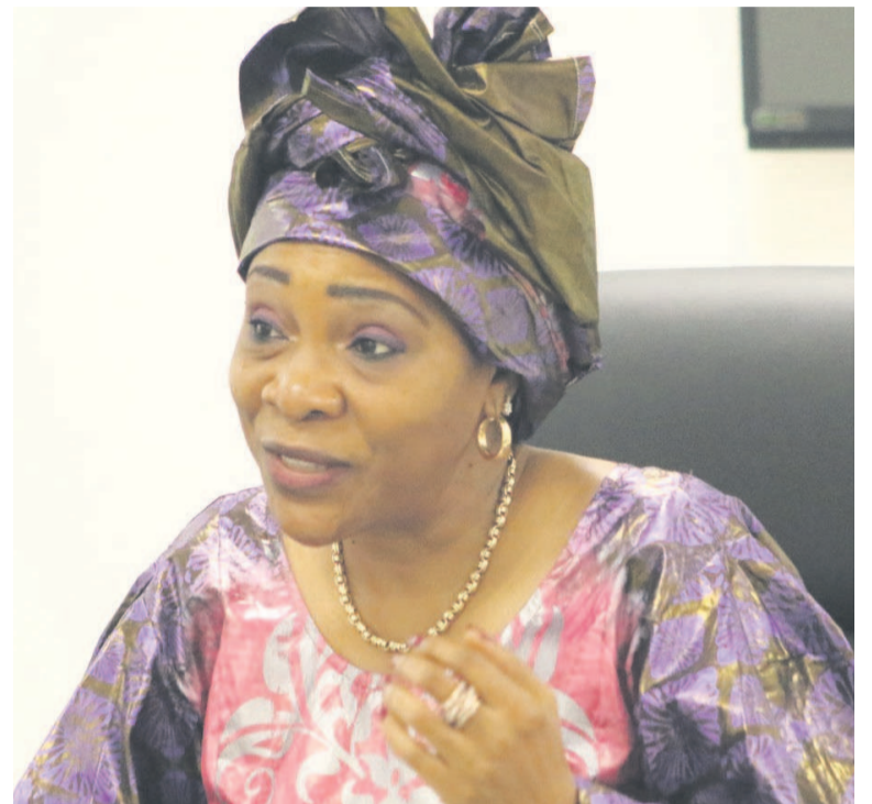
La ministre de l'Economie, du Plan, de la Statistique et de l'Intégration régionale

Plan, de la Statistique et de l'Intégration régionale, Ingrid Olga Ghislaine Ebouka Babackas, revient sur les principaux axes de cette coopération indispensable au succès de l'action gouvernementale pour le compte du département dont elle a la charge. Page 7