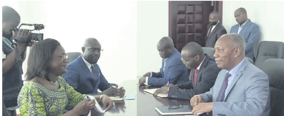
Les deux parties pendant la séance de travail.

La République du Congo a besoin de l'accord du Bureau international du travail (BIT) pour soutenir la planification de l'élaboration du programme pays pour le travail décent; la révision du code du travail; l'élaboration de la politique nationale de prévention des risques professionnels ainsi que l'appui à l'inspection du travail. Des sujets qui ont dominé les échanges entre le ministre Firmin Ayessa et son hôte. « Nous avons échangé sur la coopération entre son département ministériel et le BIT et nous avons eu une excellente conclusion sur les points que nous allons aborder cette année. Des recommandations ont été faites, elles nous permettront de redynamiser cette coopération et surtout d'aborder les questions liées au code du travail, à l'appui à l'administration du travail et les éléments qui peuvent nous permettre d'avoir une stratégie pour la santé-sécurité sur le lieu du travail. Ce sont des questions qui étaient d'importance pour le ministre. Je