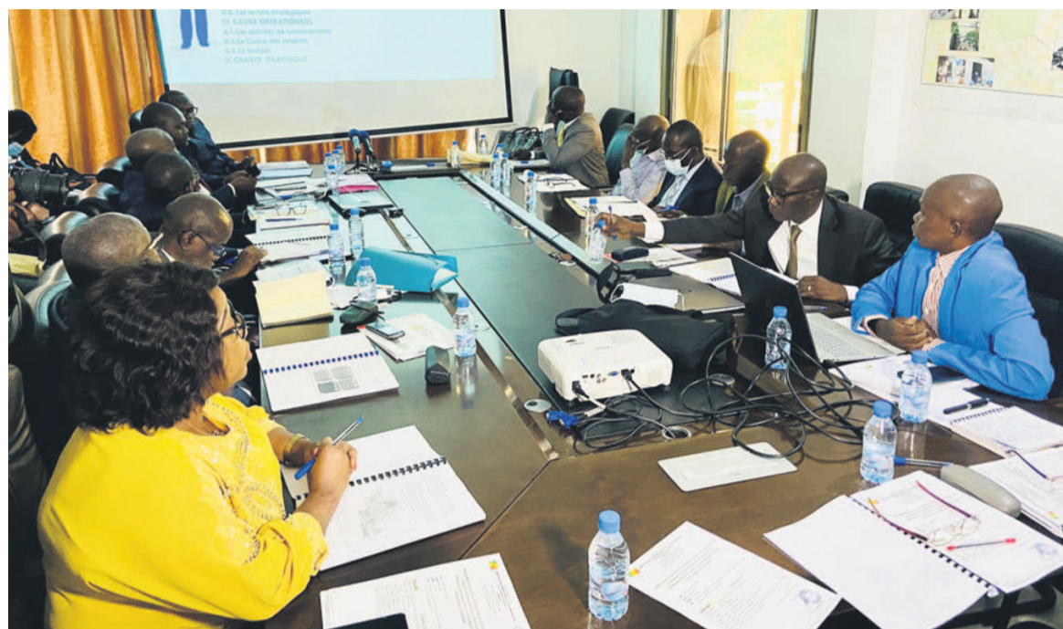
Les participants à l'atelier

« L'objectif de cette stratégie serait de faire connaître à la population l'existence des instruments d'urbanisme et leurs contenus afin de l'inciter au changement de comportement en ce qui concerne l'acqui-