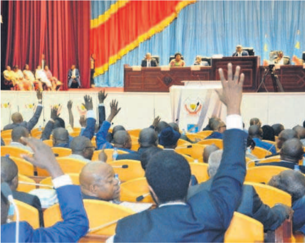
Les députés nationaux lors d'une plénière à la Chambre basse

Décidément, on n'est pas encore sorti de l'auberge concernant l'examen et l'adoption de la proposition de loi modifiant la loi électorale à l'Assemblée nationale. Depuis que l'opposition parlementaire a claqué la porte en boycottant le débat sur la réforme de cette loi, les choses semblent stagner.