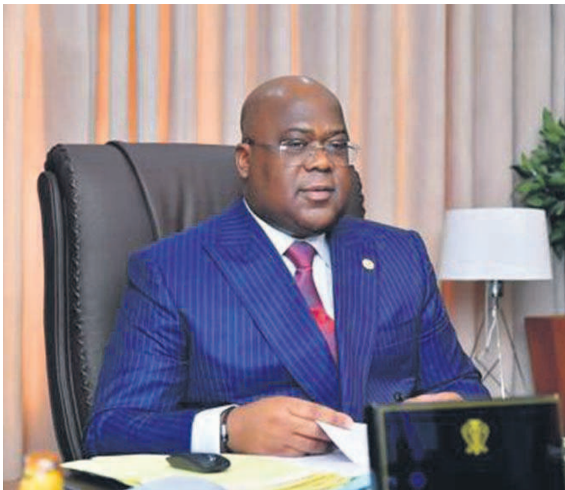
Le président Félix Tshisekedi

Et la Samim s'autoévalue Quelques heures plus tôt, le chef de l'Etat, Félix