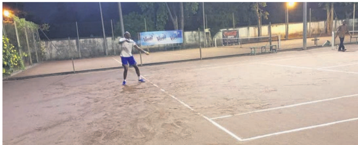
Un athlète lors des premiers matches Adiac

Le collectif des Congolais de la diaspora et amoureux du tennis a ouvert, le 10 mai à Brazzaville, la deuxième édition du tournoi international de la discipline. Jusqu'au 22 mai, les amateurs et professionnels, notamment les tennismen et tennismen issus de plusieurs pays s'affronteront en individuel et en équipe.