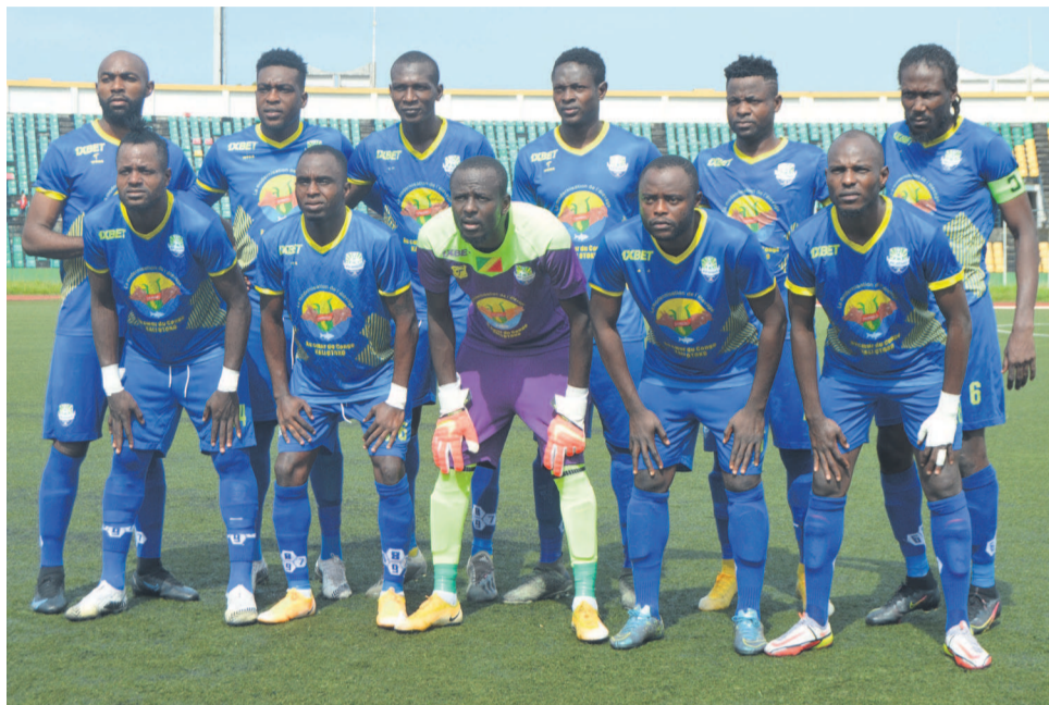
L'As Otohô championne du Congo pour la 5e fois consécutive

L'As Otohô représentera la saison prochaine le Congo à la Ligue africaine des champions avec l'ambition d'aller le plus loin possible dans cette compétition. Depuis qu'elle y participe, elle n'a jamais atteint la phase de poules. Au cours de cette saison, le représentant congolais a été éliminé à la porte de la phase de poules. Il a su rebondir à la Coupe africaine de la Confédération (C2) en terminant à la troisième place de la phase de poules après le