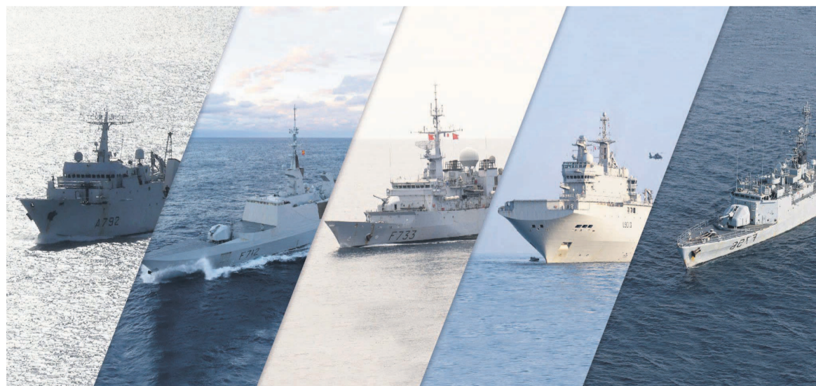
Les cinq bâtiments de la marine