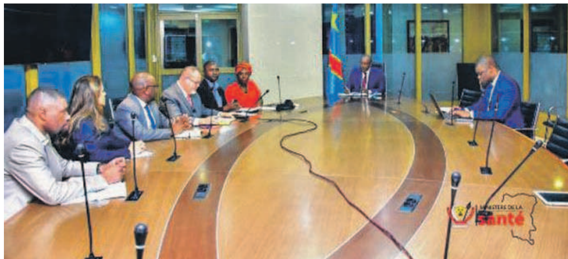
Le ministre de la Santé présidant la réunion avec l'Usaid et Path

Le ministre de la Santé publique, Hygiène et Prévention, le Dr Jean-Jacques Mbungani, a dernièrement échangé en son cabinet de travail avec une délégation de l'Agence américaine pour le développement international (Usaid) et celle du Programme de technologie appropriée en santé (PATH) sur le projet «Digital square», visant la numérisation du système de santé en République démocratique du Congo.