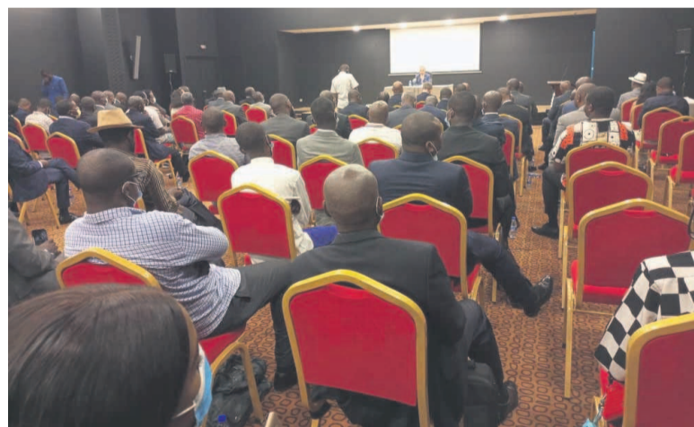
Les participants à la conférence