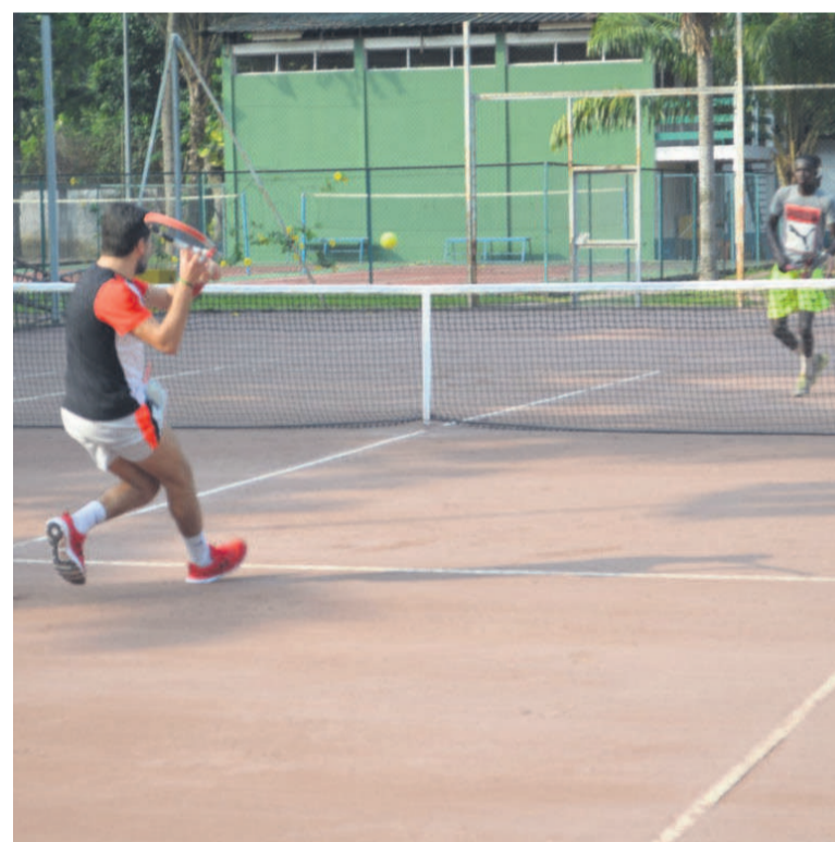
Une rencontre de tennis lors de la première journée du tournoi Adiac

Le collectif des Congolais de la diaspora et amoureux du tennis organisent, du 10 au 22 mai à Brazzaville, la deuxième édition de l'Open international qui promeut la pratique de la discipline, l'augmentation du nombre des licenciés, la formation et l'incitation des jeunes Congolais à aimer ce