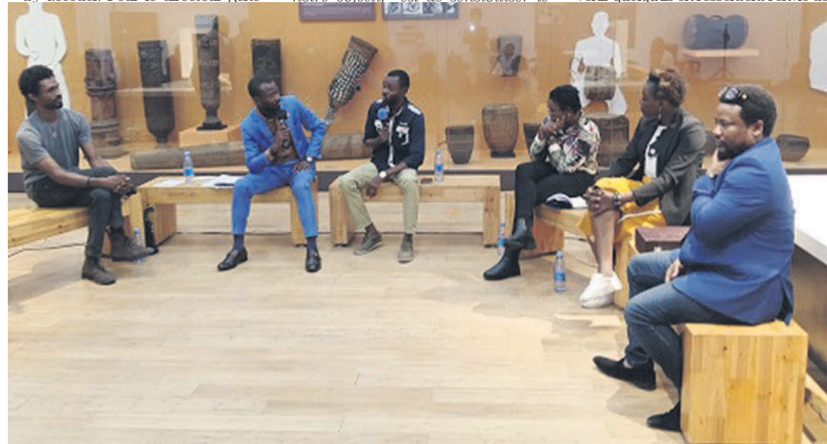
Une rencontre d'artistes dans l'une des salles du musée national