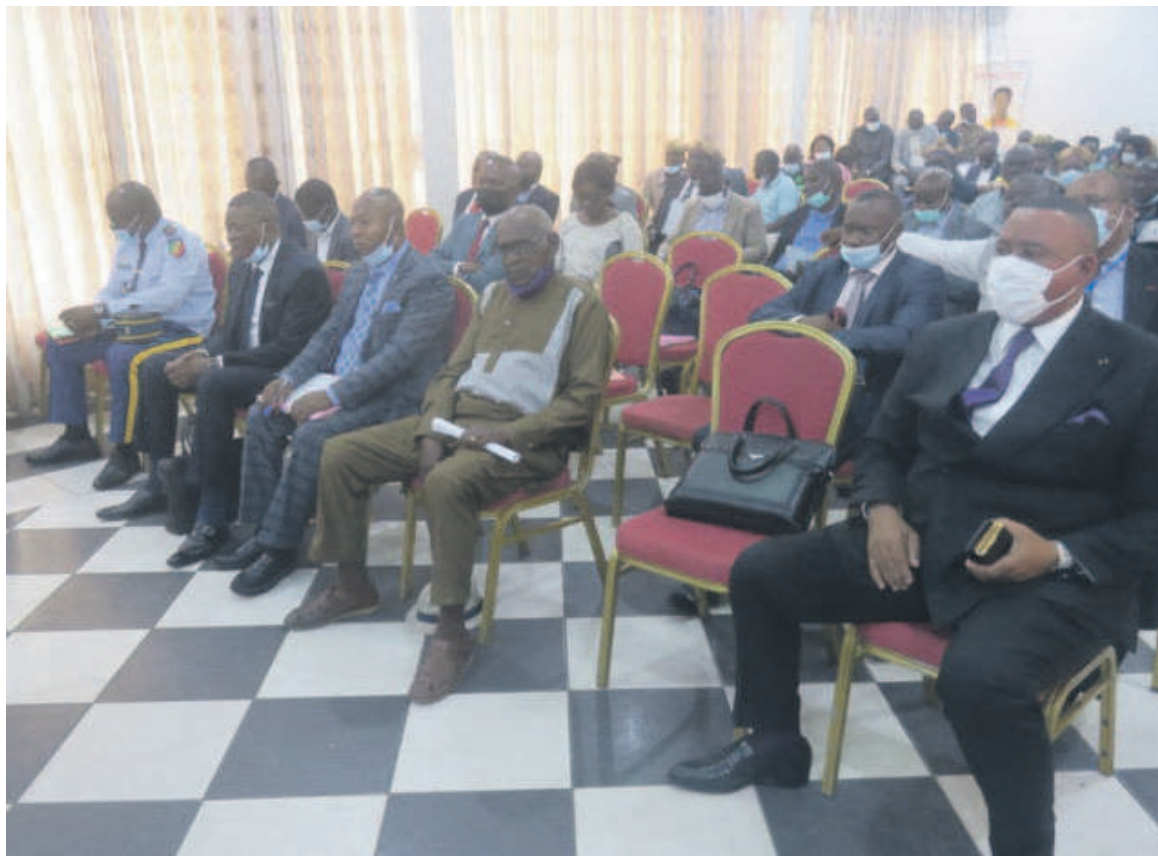
Des participants à la session

La loi n°21-2018 du 13 juin 2018 fixant les règles d'occupation et d'acquisition des terres et terrains en ses articles 12, 13 et 44 stipule que les terres coutumières sont interdites de lotissement, de cession à titre onéreux ou gra-