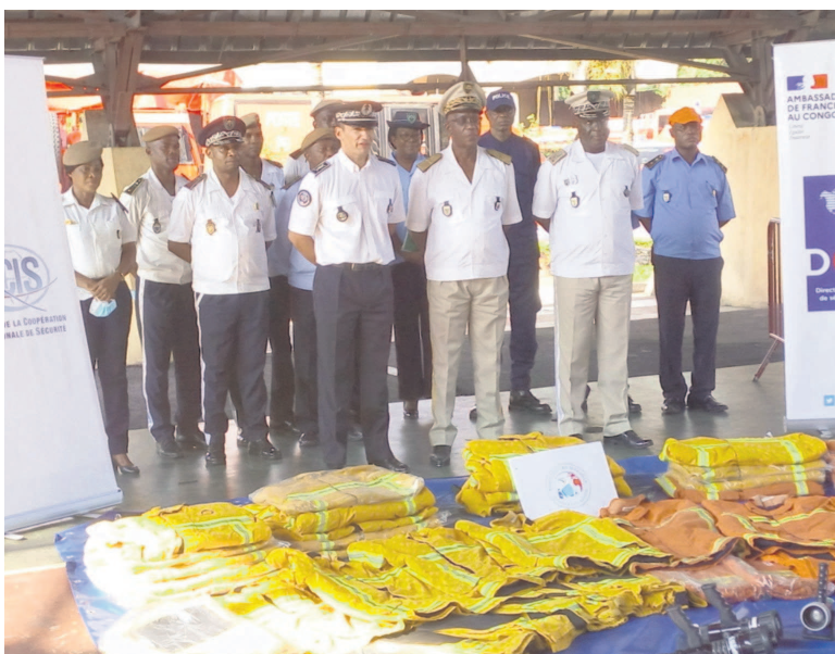
Les autorités françaises et congolaises

L'ambassade de France, en partenariat avec l'Association française de marins pompiers de Marseille, a offert le 13 mai aux sapeurs-pompiers congolais du matériel contre les incendies, constitué de tenues de feu et de lances incendie.