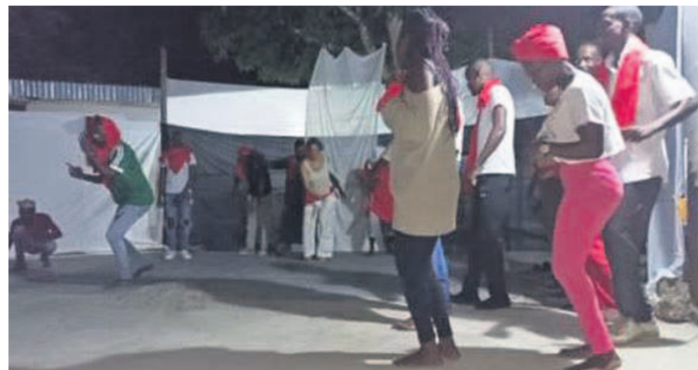
Une vue du spectacle joué au Centre de ressources du conte