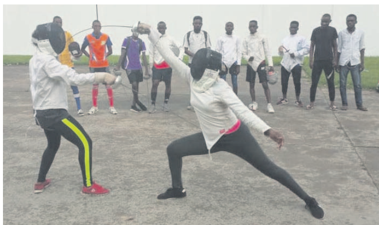
Les athlètes en pleine démonstration

Il a profité de l'occasion pour inviter tous les Congolais qui pratiquent l'escrime à venir participer aux entraînements, pour permettre, d'après lui, aux entraîneurs de