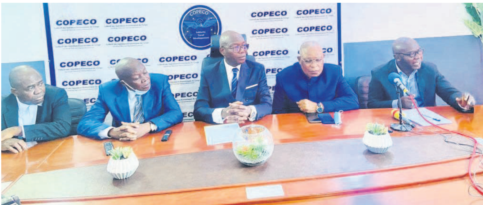
Les membres du Copéco à la conférence de presse

Le Collectif des opérateurs économiques du Congo (Copéco), réuni le 13 mai à Brazzaville, a sollicité une rencontre avec l'exécutif afin d'apporter une réponse aux négociations sur le paiement de la dette intérieure qui asphyxie le secteur privé national.