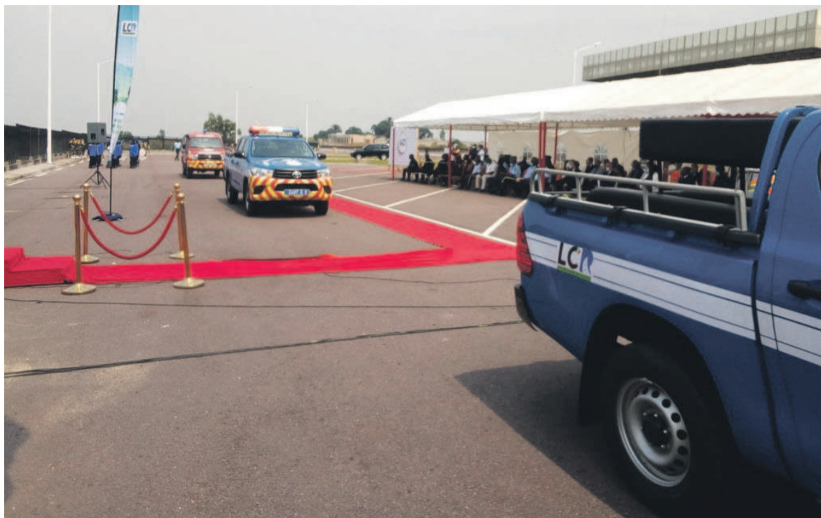
Le déploiement officiel du GSR/Adiac

Les principales missions du GSR consisteront, en effet, à assurer la police de la circulation, à lutter contre la criminalité et combattre la délinquance itinérante, à porter secours et assistance aux usagers, à interdire les contrôles intempestifs et la collecte de péages autres que ceux établis par LCR, à éradiquer les voies parallèles aux postes de péage, à soutenir la gestion des péages et des opérations de pesage, à contribuer à l'exercice des pouvoirs de police administrative et de police judiciaire, y compris à l'information et l'éducation des usagers de la route. LCR a décidé de mettre à la disposition de cette unité motorisée quatre pick-up double cabine de patrouille et d'intervention avec système de géolocalisation, une ambulance géo-localisée, six motos 650 cm 3 géo-localisées, des sites de casernement et repos (Madingou, Mayama et autres, ainsi que dans chaque gare de péage), des tenues officielles du groupement et des pompiers, du matériel de balisage en cas d'accident, des extincteurs en poudre, du matériel