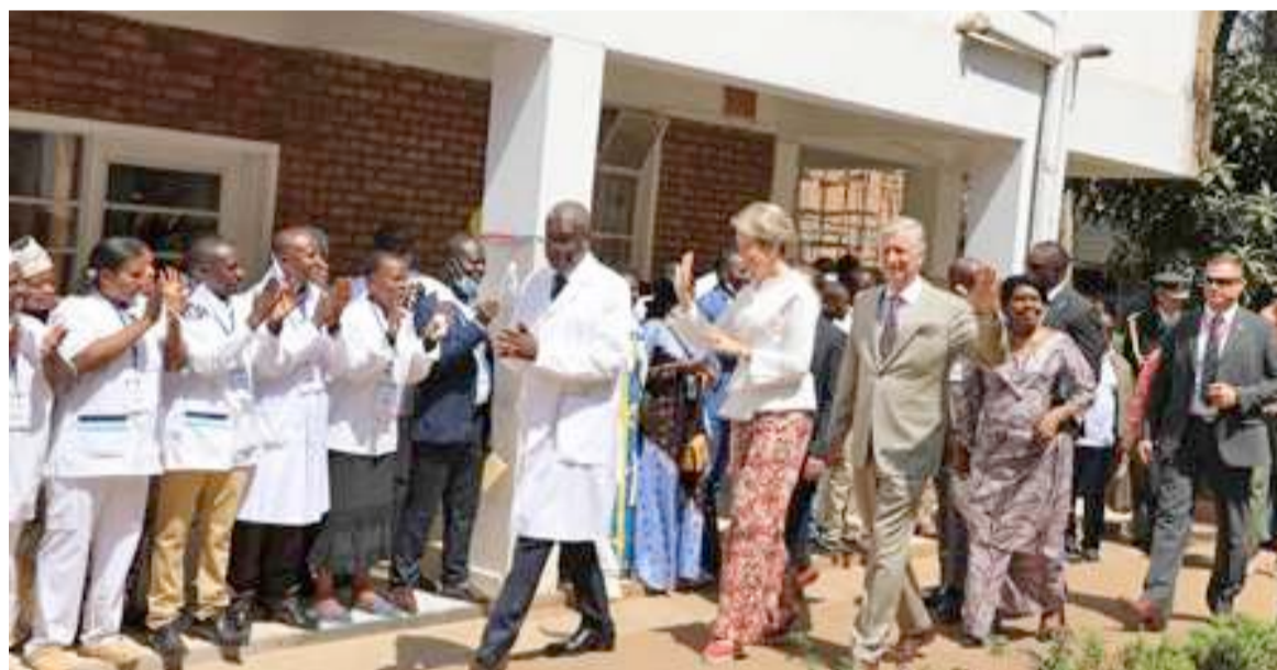
Le couple royal belge en visite guidée par le Dr Denis Mukwege à l'hôpital de Panzi ainsi qu'à la Fondation du même nom, à Bukavu

Denis Mukwege a fait remarquer que « de nombreux pays ont une représentation diplomatique et des intérêts économiques en RDC, mais peu comprennent en profondeur