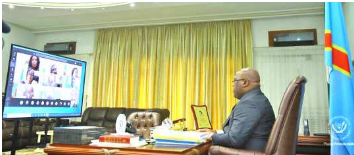
Le président Félix-Antoine Tshisekedi présidant un conseil des ministres par visioconférence.

Dans le cas d'espèce, il s'agit pour l'exécutif national d'avoir la possibilité, pendant l'intersession parlementaire, « de prendre des mesures portant sur des matières jugées urgentes ». D'après la ministre d'Etat, ministre de la Justice et Garde des sceaux, ces matières devront porter respectivement sur la prorogation de l'état de siège sur une partie de la République démocratique du Congo ainsi que sur la programmation militaire 2022-2025.