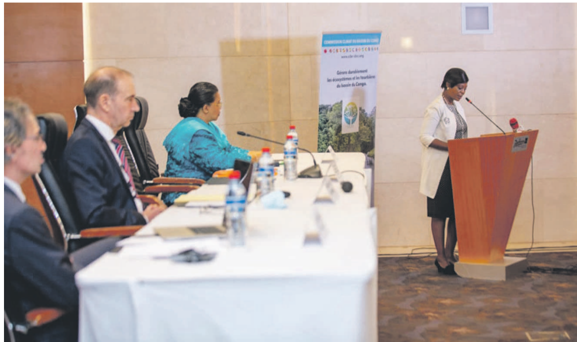
La ministre de l'Environnement, du Développement durable et du Bassin du Congo prononçant son allocution

Pour elle, le bureau de la FAO au Congo, en appui aux autres actions de cette organisation au niveau global, interviendra pour focaliser l'obtention des résultats dans plusieurs domaines. Il s'agira précisément d'intervenir dans les actions transversales liées à la mise en place et à l'opération-