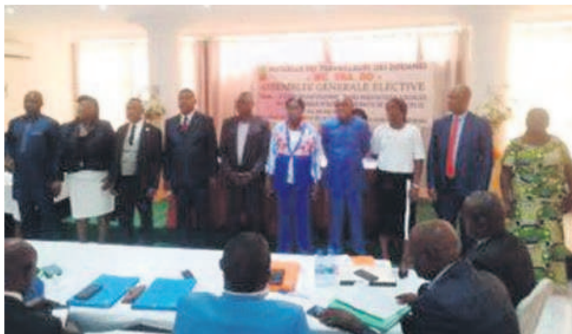
Les membres de la nouvelle équipe dirigeante

Lors du grand moment de rassemblement et de réflexion sur l'évolution