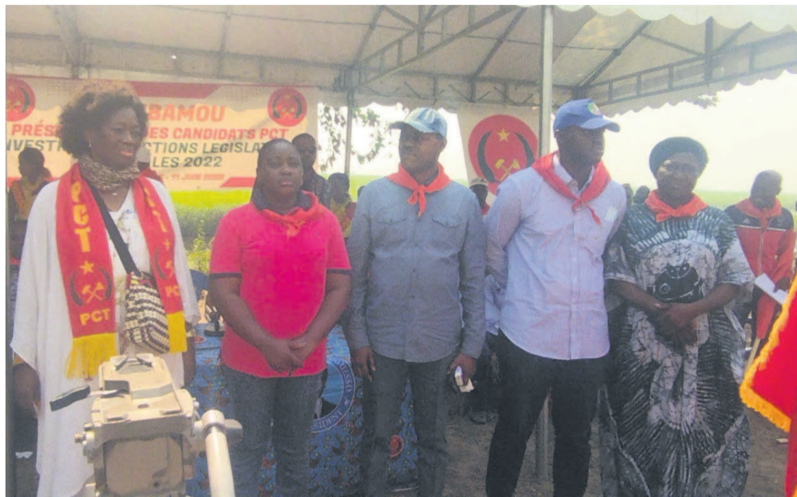
Les candidats investis à l'Ile Mbamou aux législatives et locales

Le Conseil du comité du Parti congolais du travail (PCT) du district de l'Ile Mbamou a présenté, le 11 juin au village Kintengué, ses candidats investis aux élections législatives et locales des 4 et 10 juillet prochains. Ils se sont tous engagés à porter haut l'étendard du parti afin de conserver les sièges.