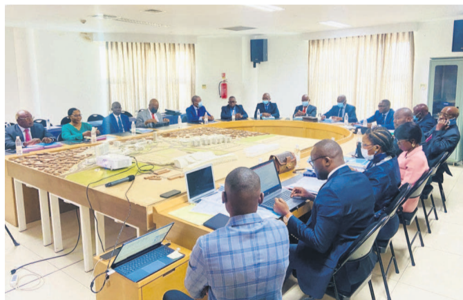
Les membres du Comité de direction de l'ACPCE/Adiac

L'Agence congolaise pour la création des entreprises (ACPCE) a pris l'engagement, à l'issue d'un comité de direction, de pouvoir créer une entreprise dans un délai de quarante-huit heures, conformément aux orientations du gouvernement.