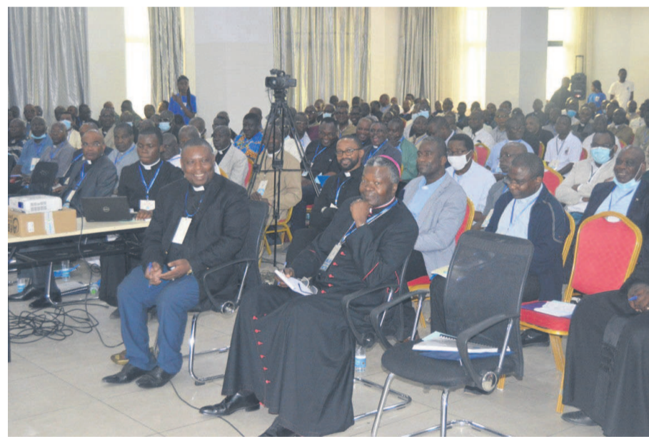
L'ouverture de l'assemblée spéciale des ouvriers apostoliques/Adiac

L'assemblée spéciale des ouvriers apostoliques de l'archidiocèse de Brazzaville s'est ouverte le 27 juin, sous l'égide de Mgr Bienvenu Manamika Bafouakouahou.