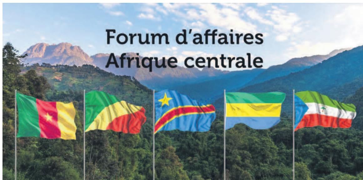
Visuel Forum d'affaires d'Afrique Centrale juin 2022 à Paris

Ces projets sont très souvent soutenus par les bailleurs de fonds internationaux (Banque mondiale, Banque