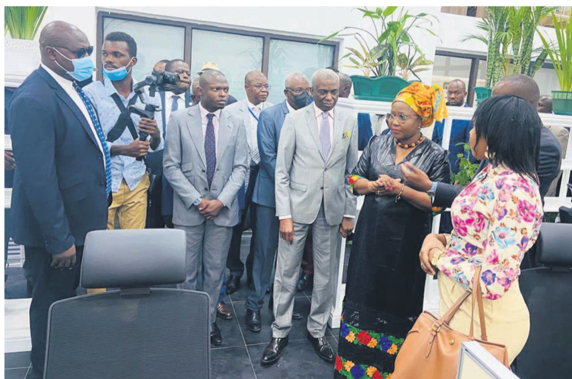
La ministre Jacqueline Lydia Mikolo visitant le siège renové de l'ACPCE, l'une des structures qui s'emploie à l'amélioration du secteur

Pour ce qui est des PME, leur écosystème a été redynamisé par la mise en place des structures sous tutelle parmi lesquelles l'Agence congolaise pour la création des