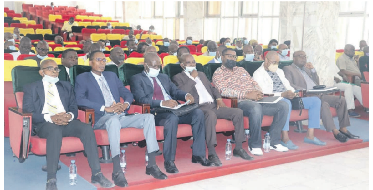
Les membres des commissions/Adiac

La cérémonie de réception des nouveaux membres de la coordination, du comité technique ainsi que du comité de suivi et de contrôle de la Commission nationale électorale indépendante (CNEI), nommés en Conseil des ministres le 24 juin dernier, s'est déroulée le 26 juin à Brazzaville.