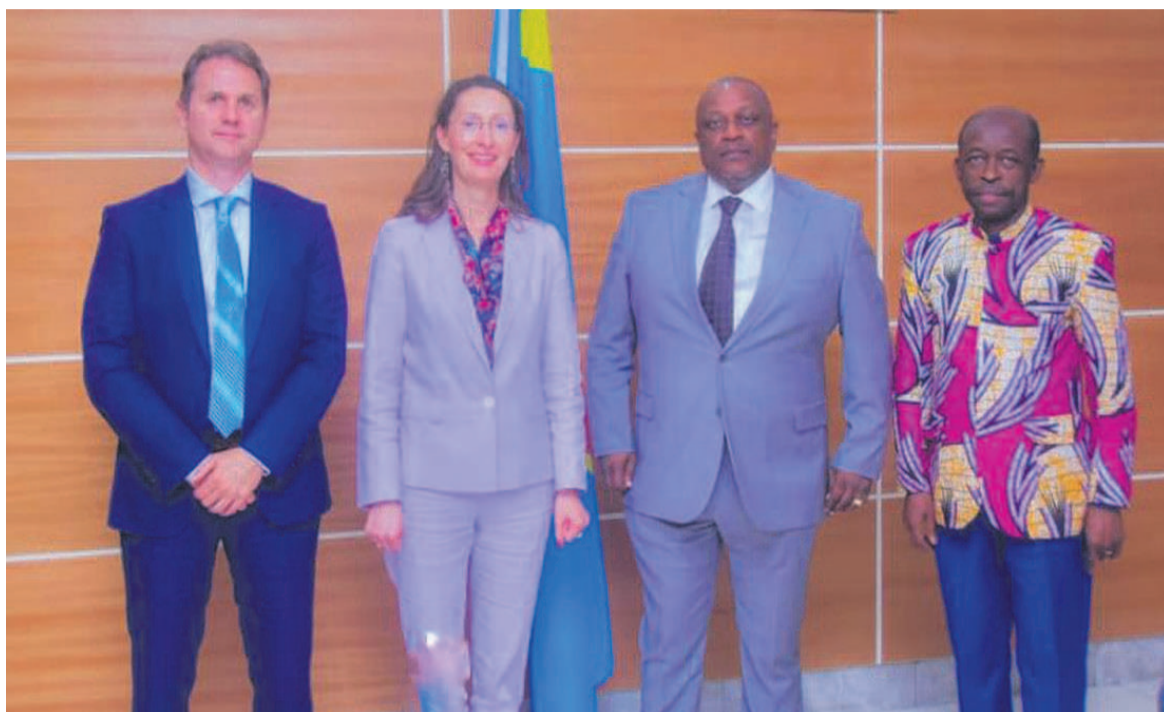
Le ministre de la Santé posant avec la délégation du Fonds mondial

Il a exhorté les autorités du pays à investir dans le secteur de la