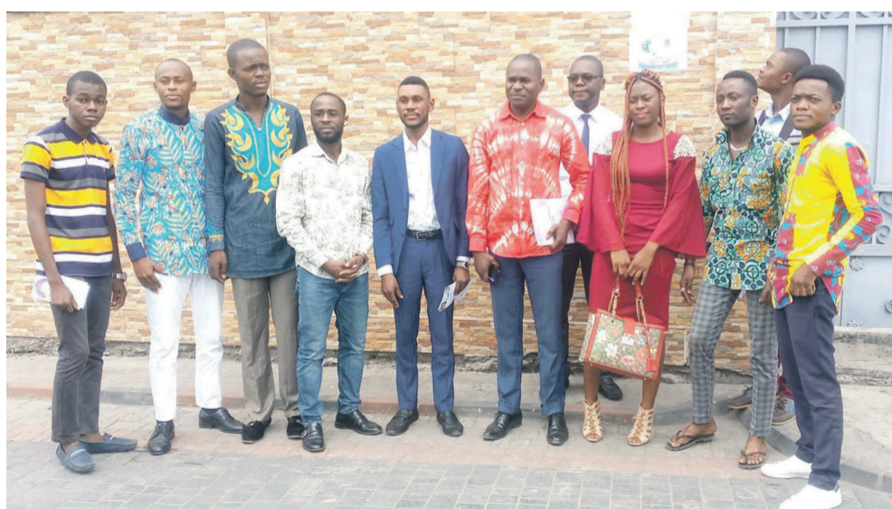
Des participants à la conférence de presse

Les start-up Chi-Tech-Innova, regroupant des jeunes inventeurs dans la fabrication des drones et développement des solutions numériques et intelligence artificielle, ont animé le 25 juin, à Brazzaville, une conférence-débat sur le thème « L'importance de l'intelligence artificielle au Congo ». L'objectif étant d'inciter les jeunes à évoluer dans le domaine du numérique.