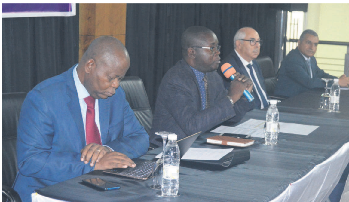
Les orateurs lors de l'atelier d'élargissement du RSU

Le Registre social unique est un système d'information qui gère les données et statistiques des ménages pauvres au profit des programmes de protection sociale. Il a pour fonctions, entre autres, d'enregistrer, de centraliser et d'orienter la demande sociale des personnes pauvres et vulnérables ; de produire pour chaque ménage enquêté un code d'identification unique à l'usage des programmes de protection sociale ; d'extraire à la demande des structures de prise en charge les listes des bénéficiaires potentiels répondant à un ensemble de critères prédéfinis ; de fournir les indicateurs sur l'efficacité des programmes de protection sociale sur la population ciblée.