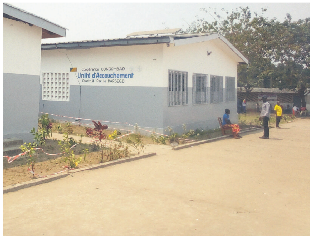
Le bloc unité d'accouchement du CSI Maman Mboulé <Adiac