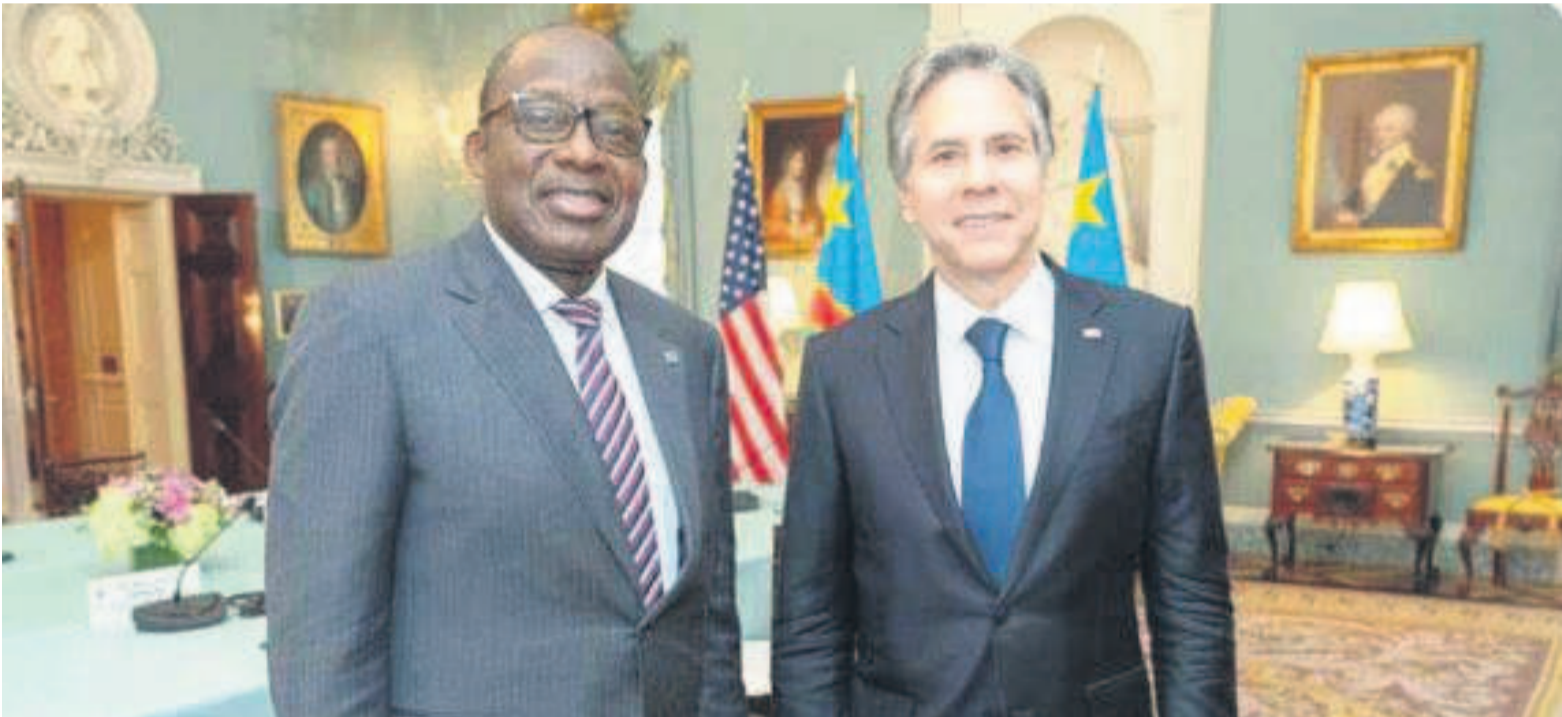
Le VPM Christophe Lutundula et le secrétaire d'Etat américain, Antony Blinken

Attendu ce 9 août en milieu d'après-midi, le secrétaire d'Etat américain sera reçu en début de soirée, à la cité de l'Union africaine, par le président Félix-Antoine Tshisekedi Tshilombo. Les deux personnalités auront un tête-à-tête de près d'une heure avant une rencontre bilatérale des délégations congolaise et américaine.