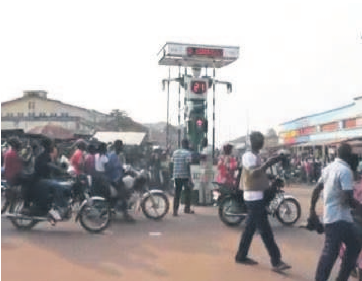
Un robot roulage réglementant la circulation routière à Mbandaka