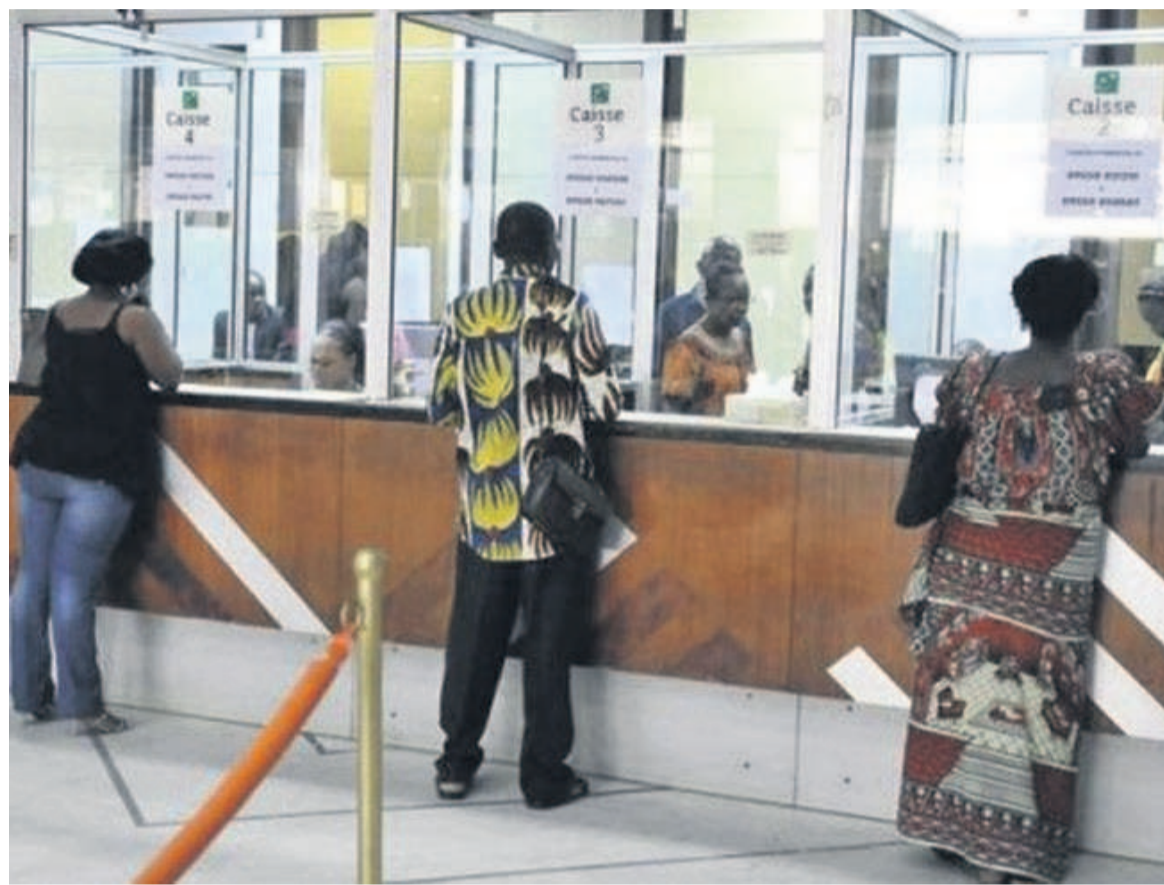
Des clients aux guichets d'une banque

Le respect des services bancaires énumérés n'est soumis à aucune condition, selon la plateforme des associations de défense des droits des