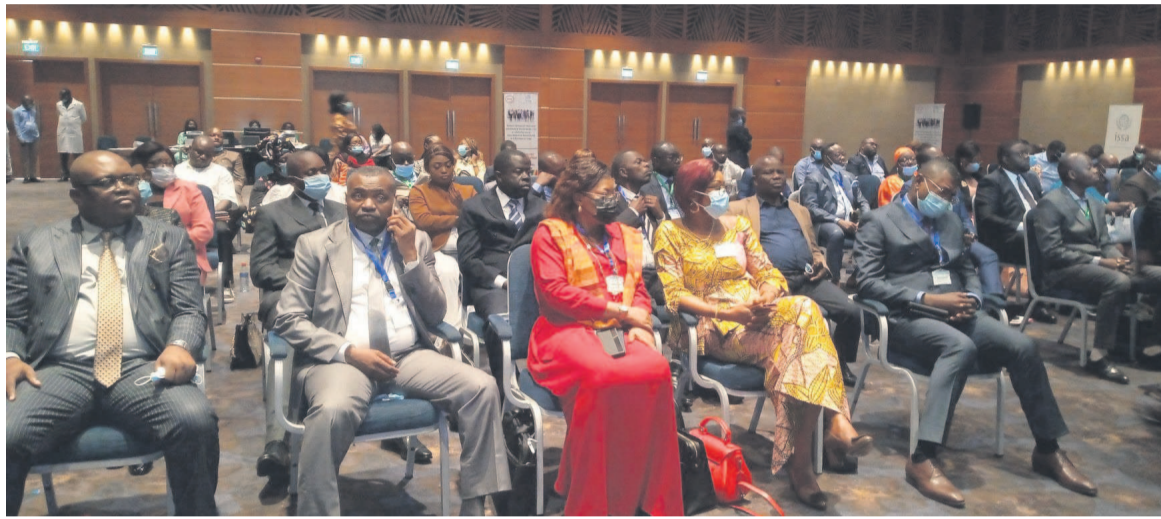
Les experts de la prévoyance sociale (Adiac)

Il a indiqué que les résultats obtenus à cette occasion ont été notamment le diagnostic de la situation générale des travailleurs migrants, l'inventaire des possibilités de la conclusion de sécurité sociale entre Etats d'Afrique centrale ainsi que les propositions des étapes et stratégies de facilitation et de garantie de la signature de convention de sécurité sociale entre les Etats de la