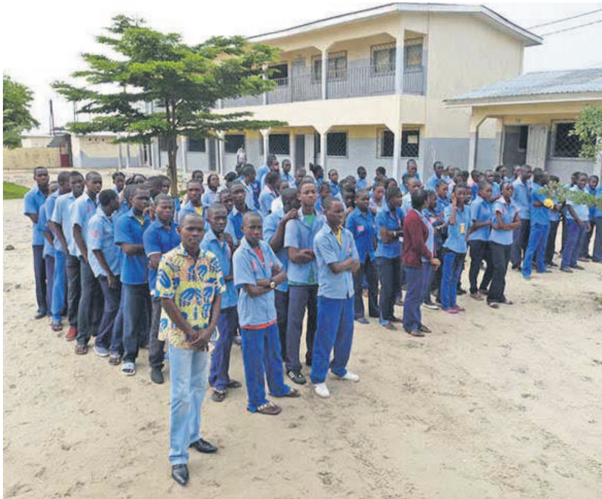
Les élèves d'une école privée à Brazzaville

Cependant, la commission a suggéré de mettre en place une commission ministérielle et interministérielle pour examiner avec minutie tous les problèmes qui se