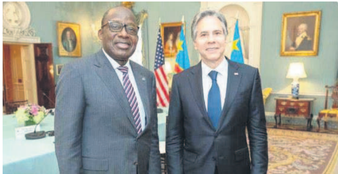
Christophe Lutundula et Antony Blinken

Les deux personnalités auront un tête-à-tête de près d'une heure avant une rencontre bilatérale des délégations congolaise et américaine. Au cours de ces rencontres, le président Félix Tshisekedi ne manquera certainement pas d'évo-