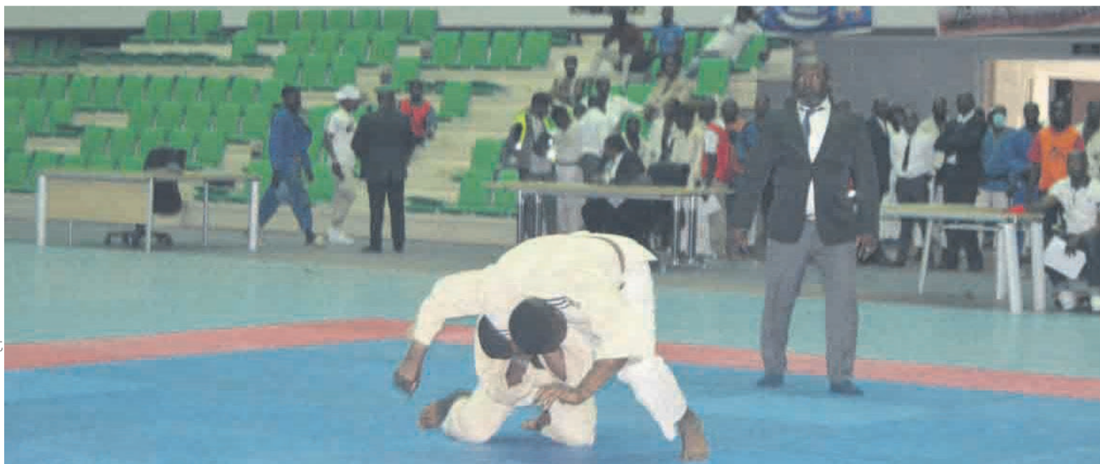
Un combat de judoAdiac