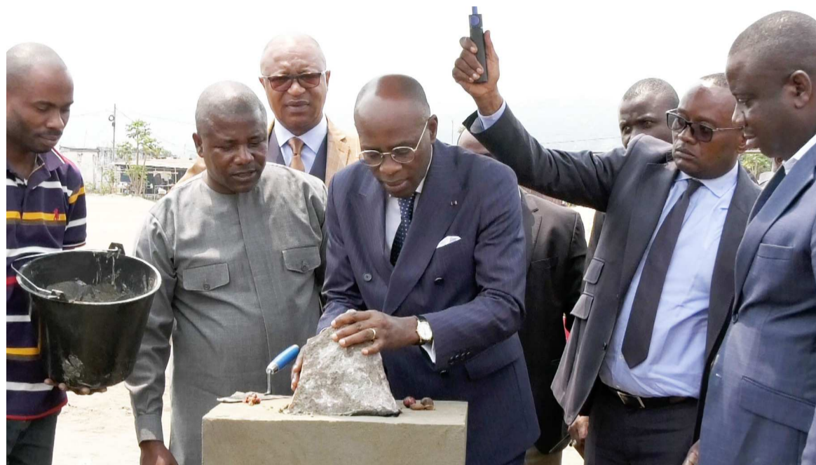
Pose de la première pierre du lycée 28 novembre de Moukondo/Adiac

Les cinq bâtiments de cette infrastructure scolaire vont s'étendre sur une superficie de 5211, 4m 2 . Sa capacité d'accueil est d'environ 2000 élèves. Ce sera le deuxième lycée du quatrième arrondissement Mougali, qui va donc désengorger d'autres établissements scolaires environnants pour résoudre l'épineux problème de pléthore dans les salles de classe qui minent le système éducatif congolais, même si les efforts sont fournis