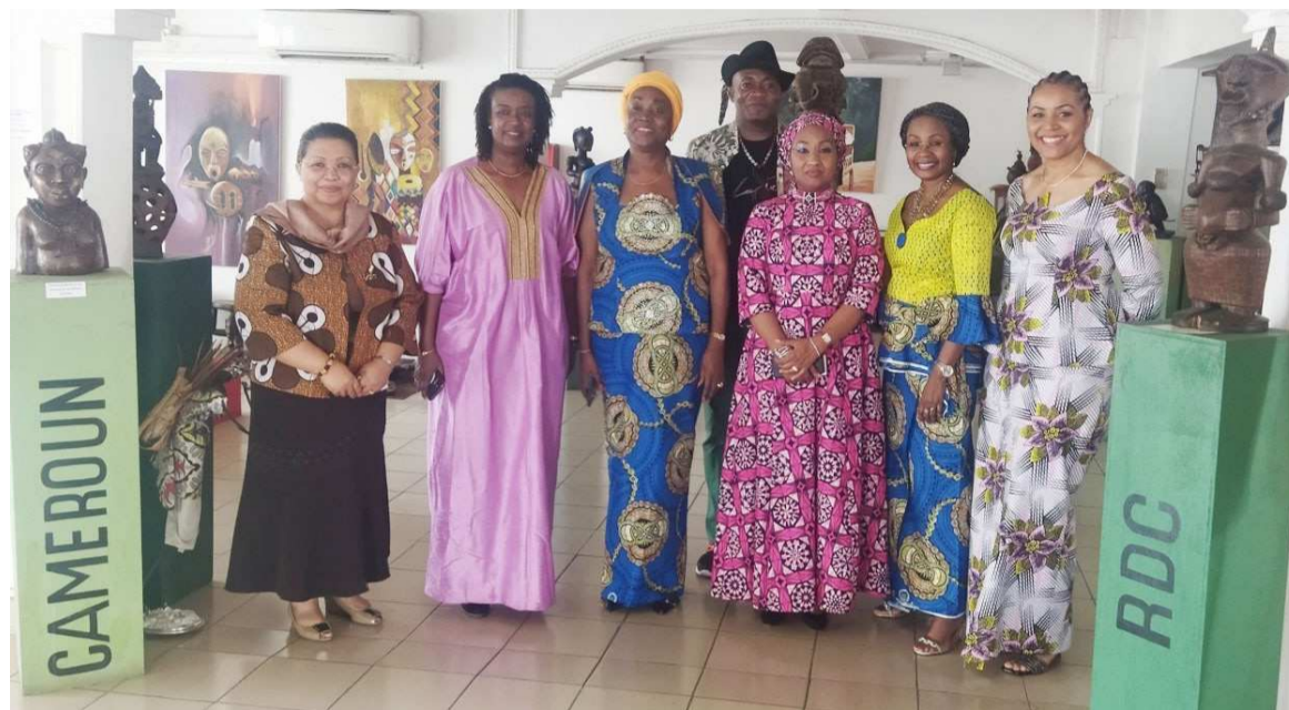
Les trois représentantes des agences de l'ONU au Congo posant en famille avec les agents du musée du Bassin du Congo

A l'issue de la visite, chacune de ces personnalités, bien édifiées par le guide et conservateur, Djoson, a exprimé la joie d'avoir contemplé le musée galerie du