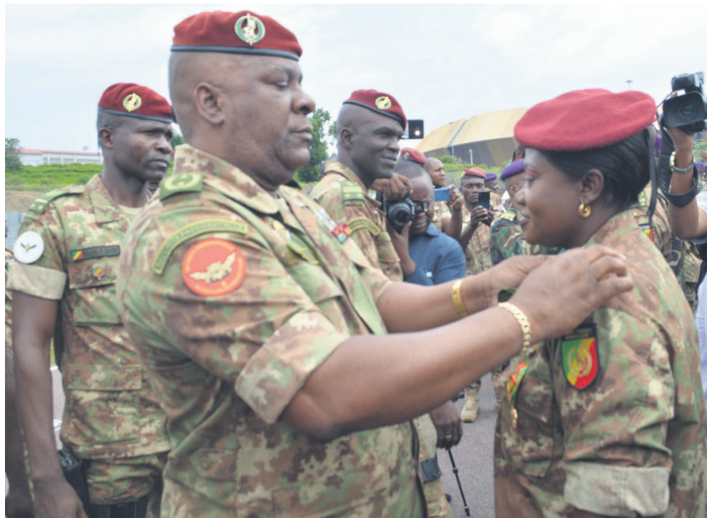
Le général Serge Oboa faisant porter l'insigne de grade à une nouvelle promue Adiac

La cérémonie de port d'insignes de grade pour le compte du premier trimestre 2023 du tableau d'avancement des structures opérationnelles de la présidence de la République s'est déroulée le 14 janvier, à Kintélé.