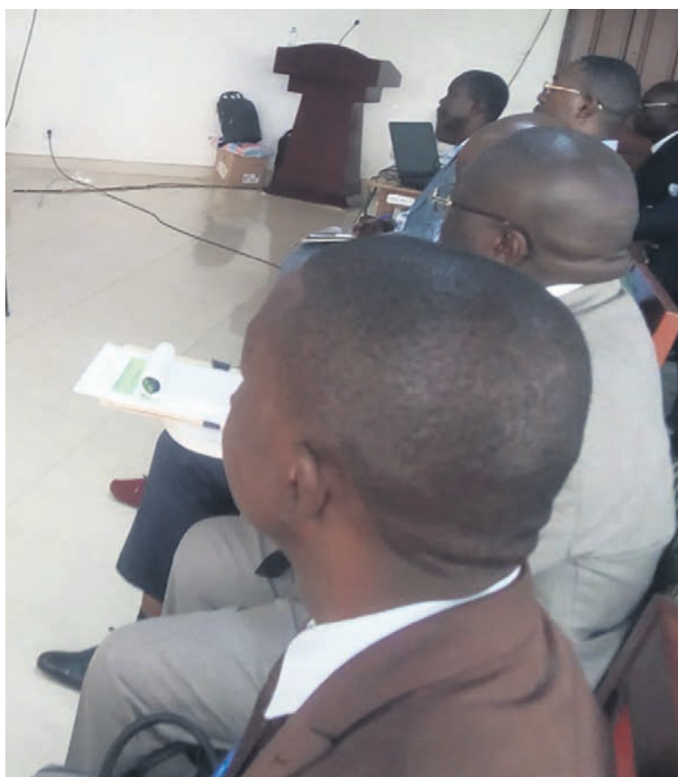
Les membres du comité de pilotage en travaux

« Le nouveau projet prend en compte les aspects liés à l'agroforesterie et au bois énergie. L'État n'interdit pas aux paysans de faire du bois énergie, seulement il leur est demandé, dans le cadre de ce projet, d'installer des plantations et de couper les bois qu'ils ont eux-mêmes plantés. Des espèces à croissance rapide leur seront proposées, comme l'acacia et l'eucalypt-