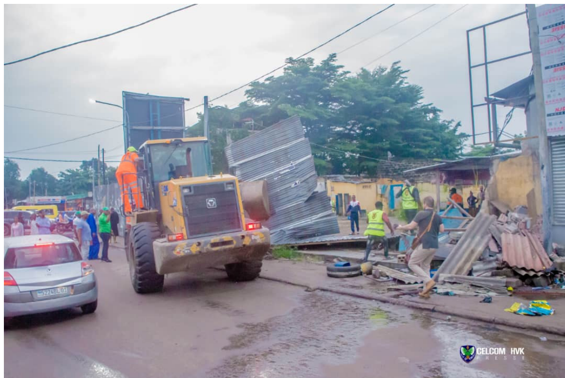
Des bulldozers de l'Hôtel de ville à Kintambo magasin

Le gouverneur a rappelé que ce n'était pas la première fois que cette opération est effectuée dans cette partie de la ville-capitale. Pour lui, les diffi-