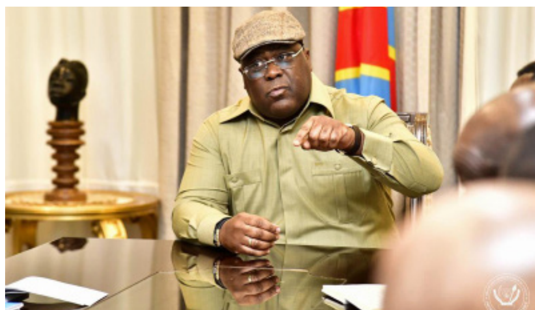
Félix Tshisekedi échange avec les bourgmestres nommés sur sa vision sur la salubrité et la sécurité de la ville de Kinshasa/DR

Le président de la République, Félix-Antoine Tshisekedi Tshilombo, a reçu, le 12 Janvier à la Cité de l'Union africaine, les bourgmestres et bourgmestres adjoints nouvellement nommés des vingt-quatre communes de la ville capitale nouvellement nommés.