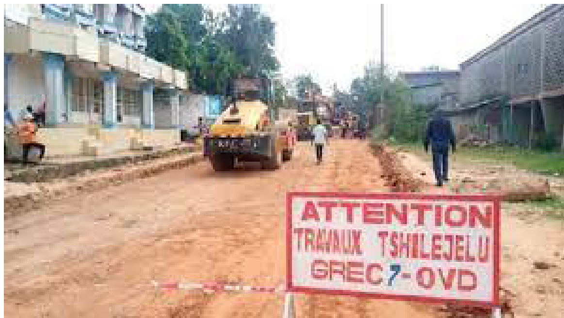
Un panneau des travaux du projet Tshilejelu

Un sondage effectué par cette organisation révèle que sur un échantillon aléatoire de trente-cinq personnes interrogées au sujet de la force dissuasive contre la corruption de l'Inspection générale des finances (IGF) et du parquet, trente-une estiment que les gestion-