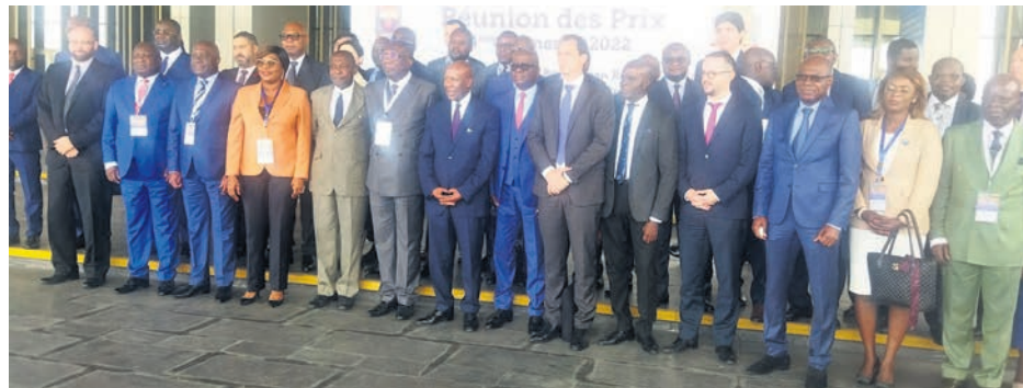
Les participants à la réunion de fixation des prix d'hydrocarbures, le 13 janvier à Kintélé

Au cours de l'année écoulée, les bruts des hydrocarbures congolais ont subi une concurrence rude oc-