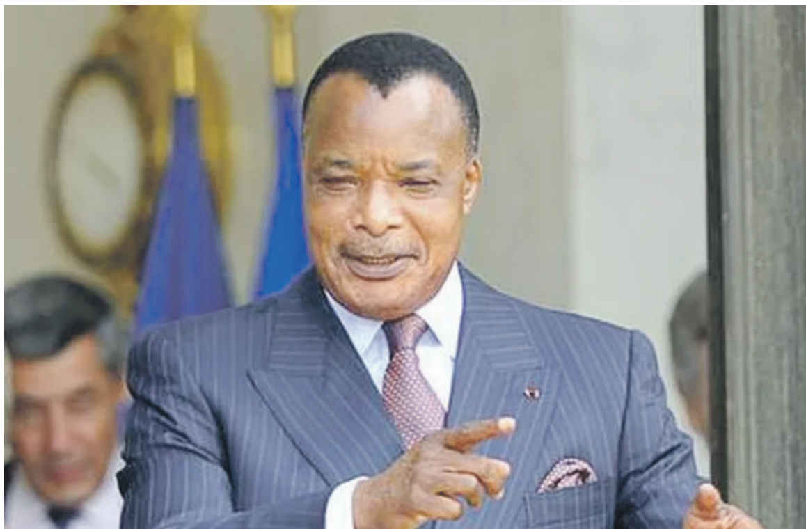
Le président de la République, Denis Sassou N'Guesso

En outre, invité à préciser les conséquences de ce conflit pour le continent africain, Denis Sassou N'Guesso a déclaré : « On ne mesure pas encore tous ses effets désastreux, tout le mal que la désintégration de la Libye a causé. Il est certain que cette guerre a contribué au développement du djihadisme au Sahel, mais aussi au Nord du Cameroun, à la frontière de la République démocratique du Congo et de l'Ouganda, et ailleurs encore. Ce conflit a aussi fait de la Libye un point de passage pour des milliers de jeunes migrants africains, qui viennent de partout, au péril de leur vie en traversant le désert puis la Méditerranée en direction de l'Europe. La fin de la guerre en Libye stabiliserait le Maghreb et, au-delà, limiterait les trafics en tous genres. La paix dans ce pays freinerait le drame humain des migrants en Méditerranée. La Libye