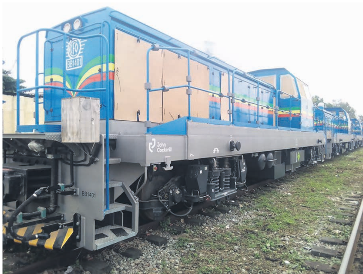
Les quatre nouvelles locomotives du CFCO