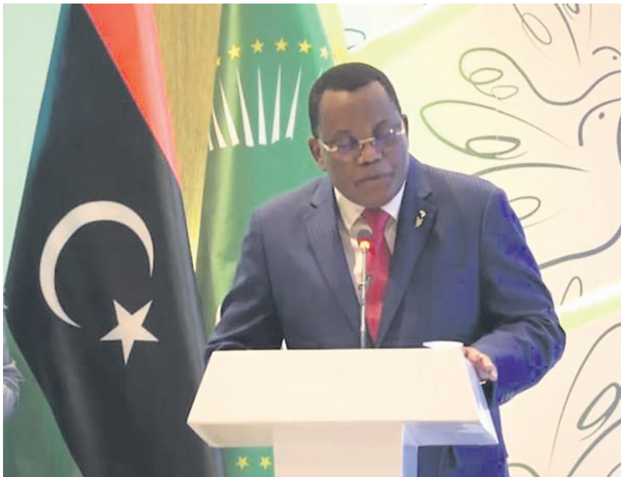
Le ministre Jean-Claude Gakosso

conclave, le représentant du secrétaire général de l'ONU, Abdoulaye Bathily, a renouvelé le soutien de l'organisation internationale à la médiation africaine conduite par le chef de l'Etat congolais, Denis Sassou N'Guesso, dans le cadre du comité de haut niveau sur la Libye. C'est un