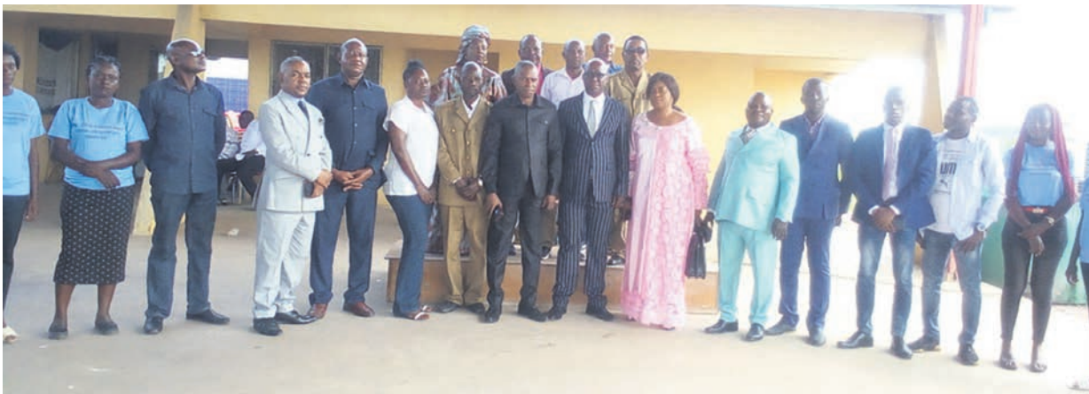
Les organisateurs posant avec les experts et les invités

« Au regard de la dextérité et des visions axées sur le ré-