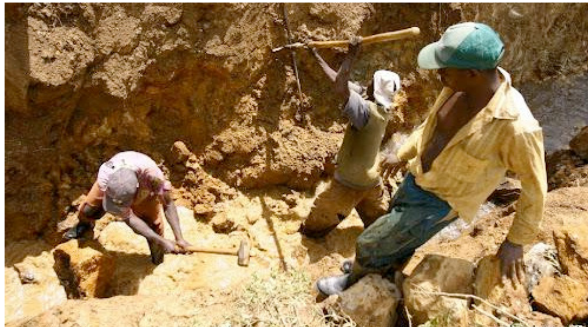
Des creuseurs dans une mine artisanale dans le sud Kivu

La cérémonie s'est déroulée en présence du président de la République, Félix-Antoine Tshisekedi Tshilombo. Il s'agit là d'un tournant historique dans les relations entre les deux pays avec, à la clé, la vente d'un premier lot d'or issu du commerce équitable. L'accord précité a l'avantage de garantir des bonnes conditions de travail et de vie aux creuseurs artisanaux vivant dans l'Est du Congo. Ceux-ci pourront dès lors avoir directement accès au partenaire, sans intermédiaire, devenant ainsi partie prenante au processus. Plus concrètement, Primera Gold garantira un salaire décent aux