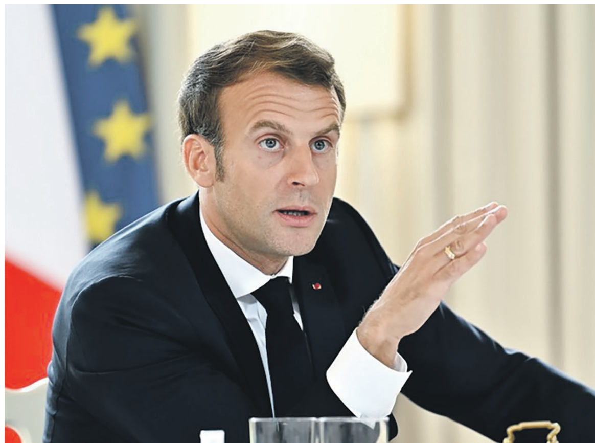
Le président Emmanuel Macron

Le président français estime ne pas avoir «à demander pardon» à l'Algérie pour la colonisation. Il espère, cependant, accueillir son homologue Abdelmajid Tebboune en France en 2023 pour poursuivre le fil de la réconciliation entre les deux pays. «Je n'ai pas à demander pardon, ce n'est pas le sujet, le mot romprait tous les liens», a déclaré Emmanuel Macron dans un entretien avec l'écrivain algérien, Kamel Daoud, dans «Le Point». Pour le chef de l'Etat français, «le pire serait de conclure : on s'excuse et chacun reprend son chemin». Il estime que «le travail de mémoire et d'histoire n'est pas un solde de tout compte. C'est, bien au contraire, soutenir que dedans il y a de l'inqualifiable, de l'incompris, de l'indécidable peut-être, de l'imparadonnable». La question des excuses est au cœur de la diplomatie entre Paris et Alger, et des tensions récurrentes entre les deux pays.