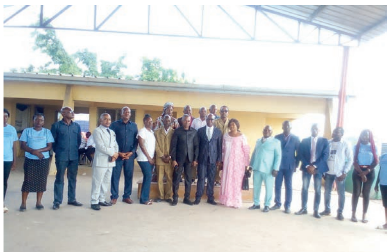
Les organisateurs posant avec les experts et les invités

Les projets socioculturels, économiques et de développement communautaire du district d'Ignié, dans le département du Pool, ont été évoqués aux journées portes ouvertes organisées du 13 au 15 janvier à Mandiélé.