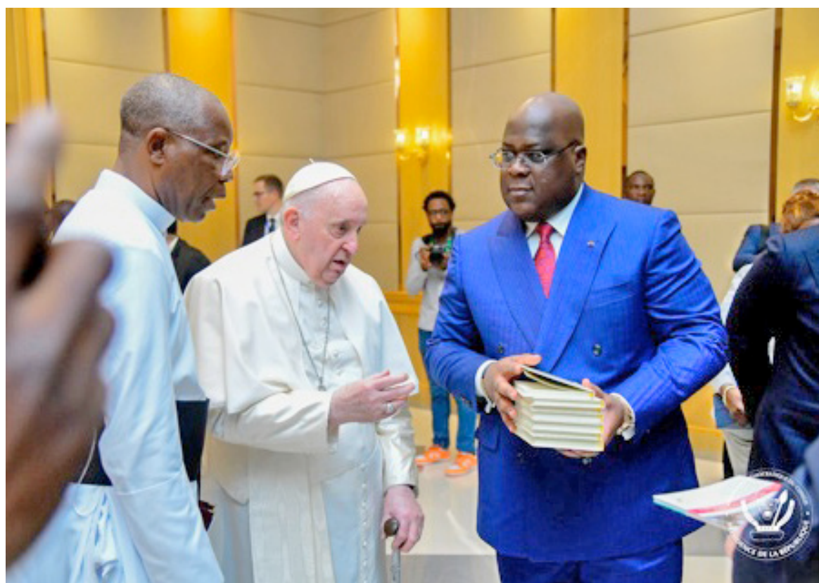
Le pape François et le président Félix Tshisekedi

Dans son mot de bienvenue, le président Félix Tshisekedi a dénoncé, une fois de plus, l'agression du pays par le Rwanda qui agit sous couvert de son mouvement armé, le M23. « Ce malheur qui dure depuis près de trente ans fait aujourd'hui d'une partie de notre territoire en proie à ces violences une zone en rupture de paix où, outre les groupes armés, les puissances étrangères avides des minerais contenus dans notre sous-sol commettent, avec l'appui direct et lâche de notre voisin le Rwanda, de cruelles atrocités faisant ainsi de la sécurité le premier et grand défi du gouvernement », a dit le président Tshisekedi. Haro sur le colonialisme économique ! Pour sa part, le pape François, après avoir vanté tout le