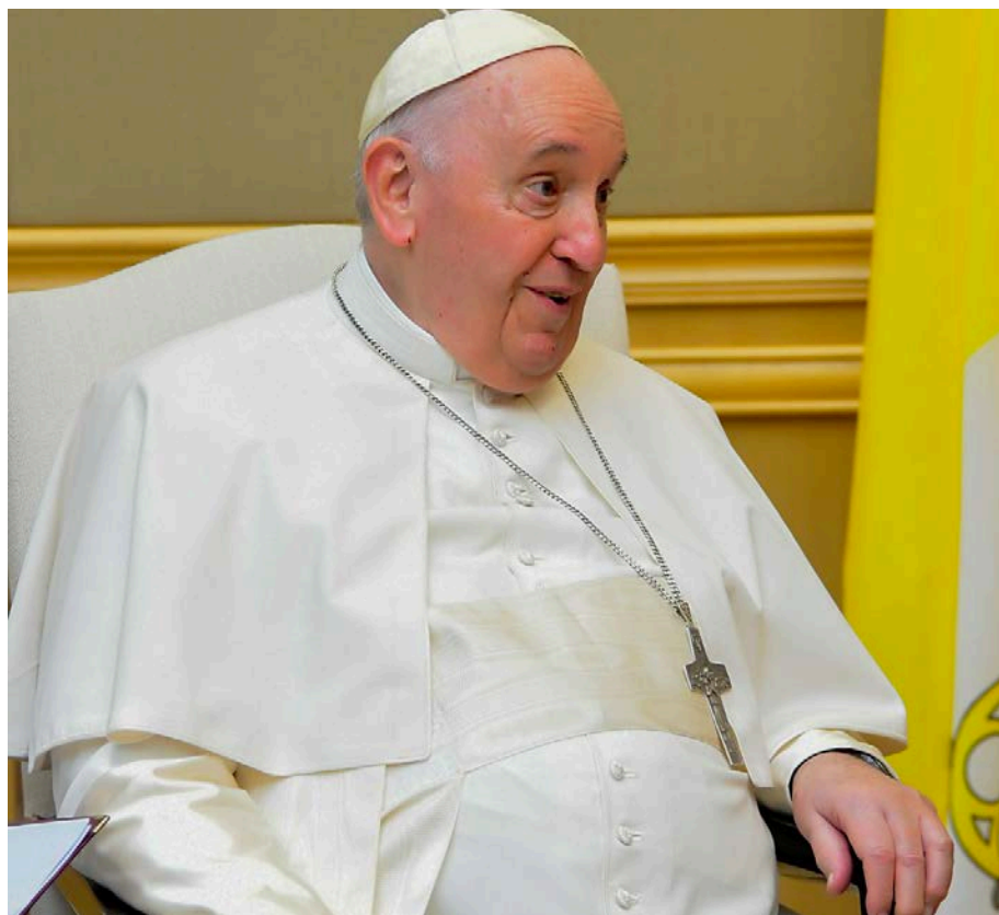
Le Pape François