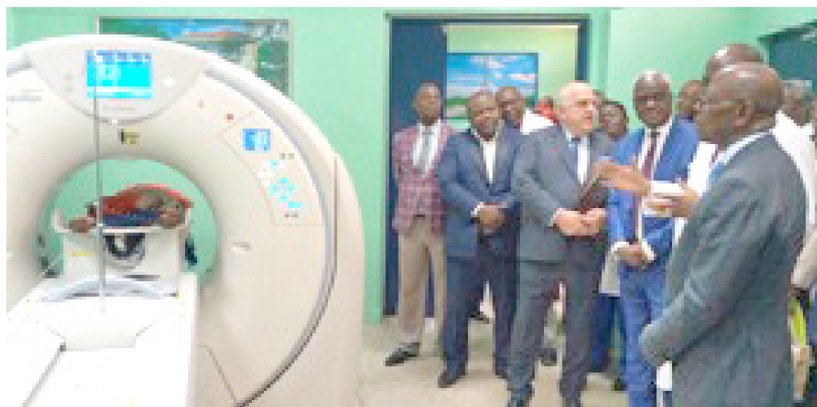
La délégation dans la salle du scanner

Il s'agit notamment d'un appareil scanner encore appelé TDM tomodensitométrie de dernière génération de 80 baret, injecteur à double tête. L'appareil de radiologie est composé d'un régulateur de tension de 12 KVA, d'un groupe électrogène de 135 KVA, d'un onduleur de 100