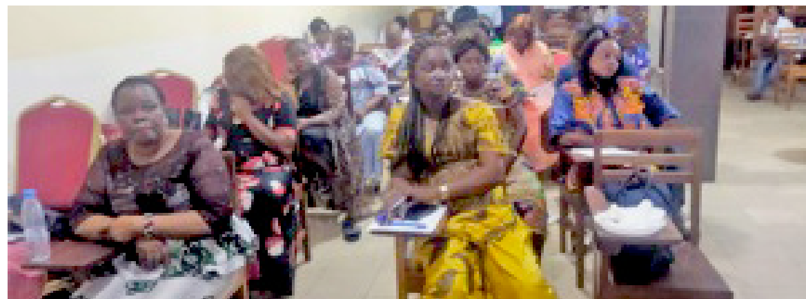
Une vue des sages-femmes lors de la formation

L'Association congolaise pour les droits et santé (ACDS) a organisé, le 31 janvier et le 1er février à Brazzaville, une formation spéciale à l'endroit des sages-femmes. L'objectif a été de donner aux accoucheuses des connaissances nécessaires leur permettant de bien assurer le suivi et l'accompagnement psychologique et émotionnel des femmes enceintes.