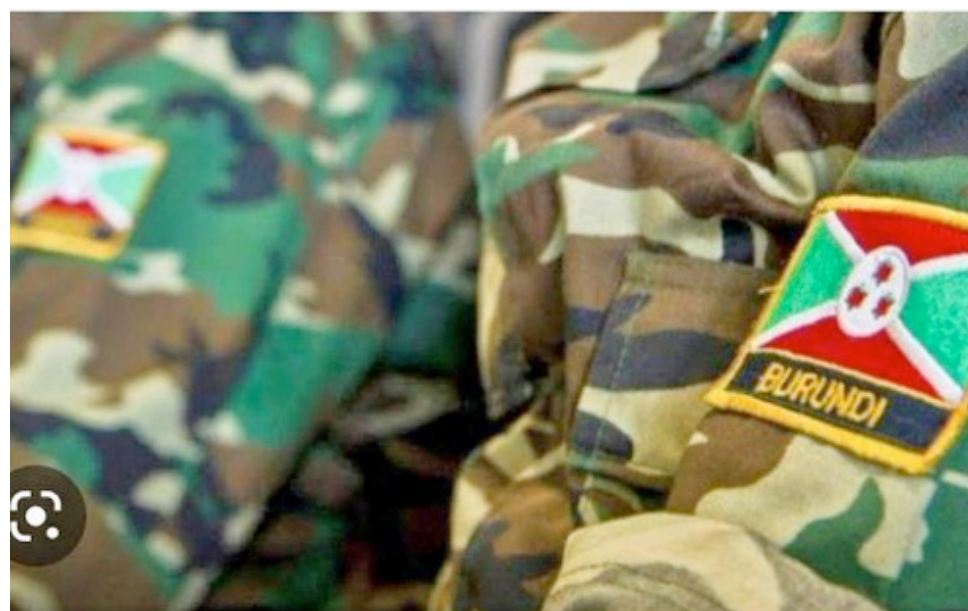
Des soldats des forces de l'EAC en RDC