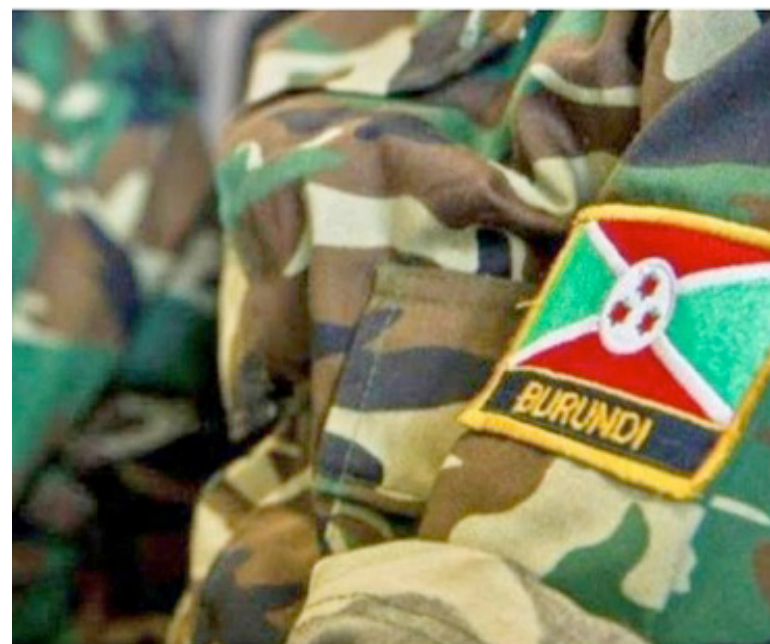
Des soldats des forces de l'EAC en RDC

Le Mouvement des indignés de la situation sécuritaire en République démocratique du Congo (MISS-RDC) exhorte le chef de l'Etat, Félix-Antoine Tshisekedi, à étendre la purge au sein des forces armées et autres services de sécurité jusqu'aux institutions. Cette structure de la société civile réagissait ainsi à la décision d'écartier des officiers rwandais des forces régionales de l'Afrique centrale en place dans le pays.