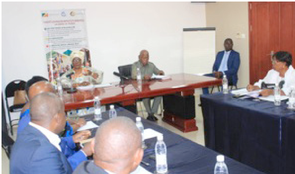
La protection sociale des vulnérables à renforcer

« Les systèmes des filets sociaux mis en œuvre à travers le projet Lisungi sont des garde-fous qui permettent à notre société de protéger les plus vulnérables d'entre nous et de garantir à chacun l'accès aux moyens de substance nécessaire », a rappelé Marie-Cécile Irène Mboukou-Kimbatsa. Selon la ministre qui est, par ailleurs, présidente du Comité d'orientation stratégique du projet Lisungi, l'échantillon de quelques ménages qui témoignent de l'amélioration de leurs conditions de vie à travers les allocations de ce projet constituent un motif de satisfaction pour tous les acteurs qui travaillent à l'atteinte de ces objectifs. Rappelons que le projet Lisungi vise, entre autres, à