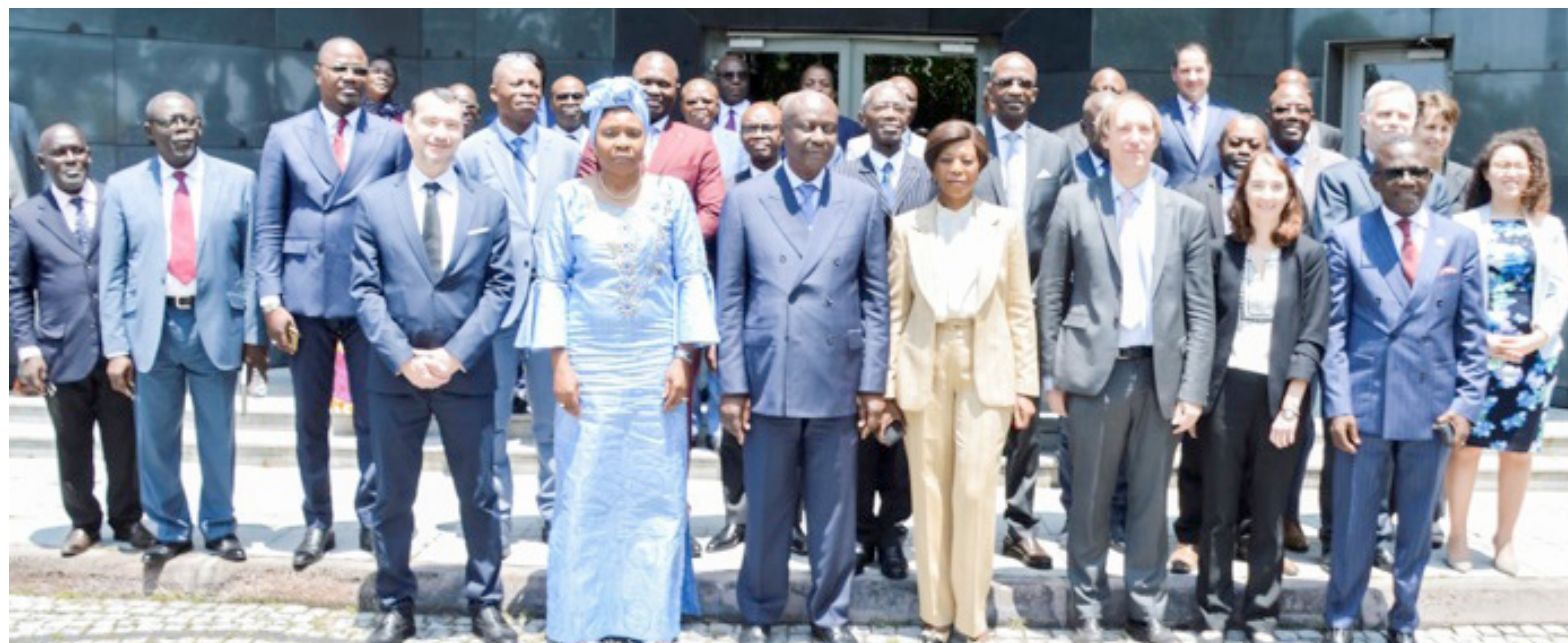
La photo de famille des officiels

En effet, les chantiers lancés par les autorités, dans le cadre de ces réformes structurelles, répondent à plusieurs faiblesses recensées dans l'évaluation. Ces réformes sont de deux ordres : celles qui sont spécifiques à l'investissement