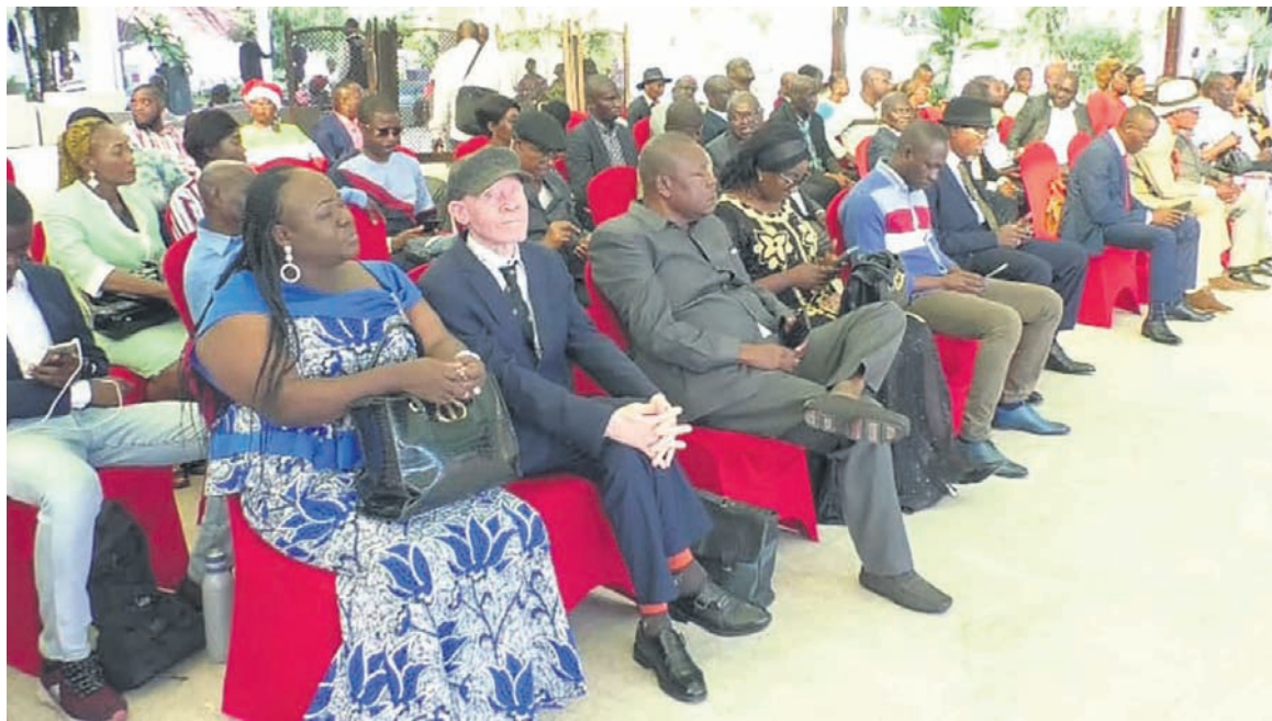
Les militants du Club 2002