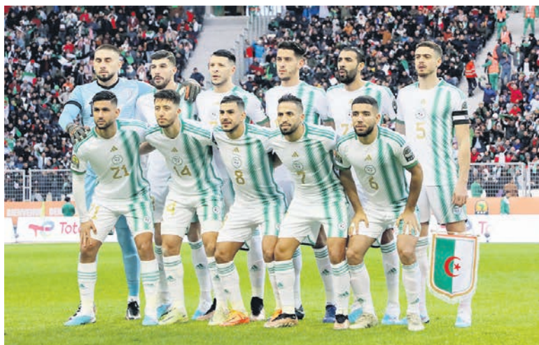
Les Fennecs d'Algérie

Face au Mena du Niger en demi-finale qu'elle disputait pour la deuxième fois en deux participations, l'Algérie a livré la prestation la plus aboutie,