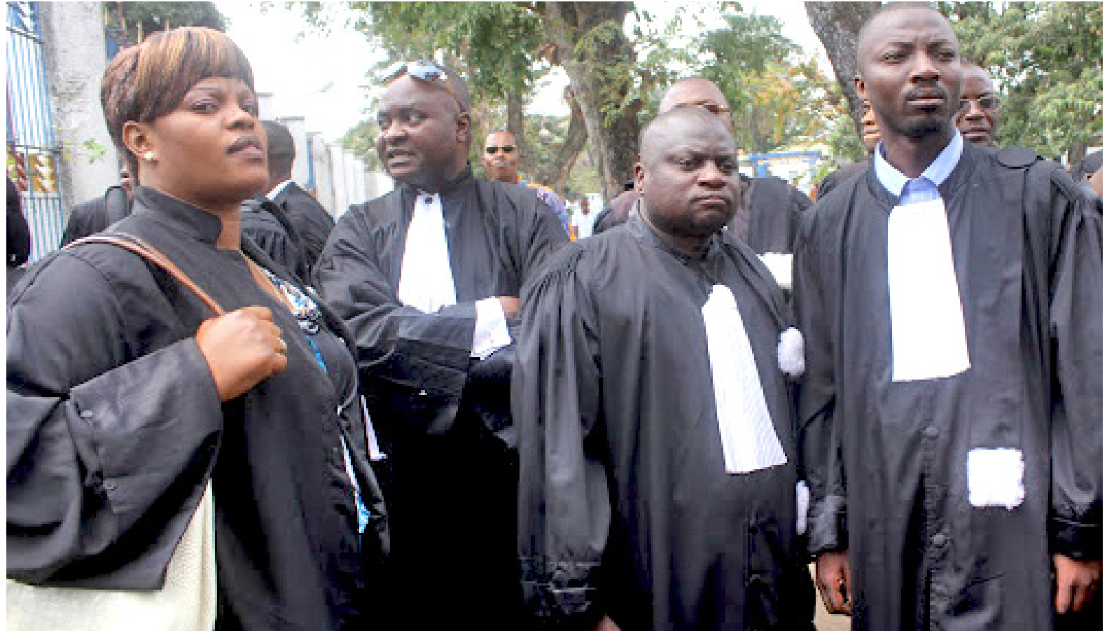
Des hommes en toge lors d'une manifestation à Kinshasa

S'appuyant sur les déclarations du syndicat des magistrats, la FBCP déplore que ces candidats magistrats soient abandonnés à Kinshasa à leur triste sort, alors qu'ils étaient appelés à se déplacer à leurs propres frais de provinces où ils se trouvaient pour Kinshasa en vue d'un contrôle physique. Elle note que le Conseil supérieur de la magistrature leur avait également demandé de rester dans la capitale pour une formation.