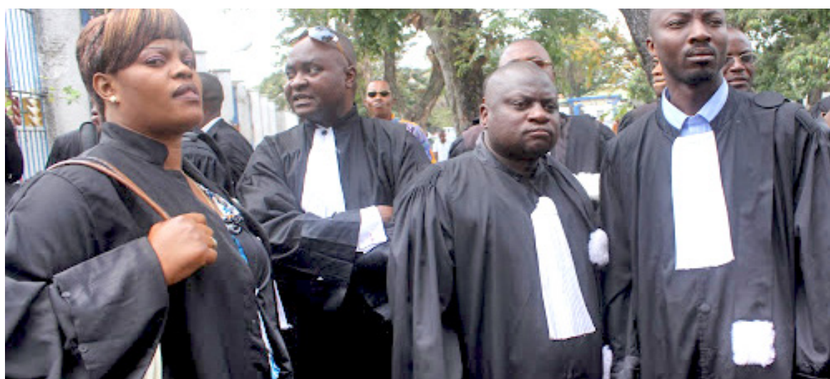
Des hommes en toge lors d'une manifestation à Kinshasa

La Fondation Bill-Clinton pour la paix (FBCP) demande à l'État congolais de prendre en charge les magistrats qui ont satisfait au concours de l'entrée à la magistrature venus des autres provinces du pays en dehors de Kinshasa. Regrettant que