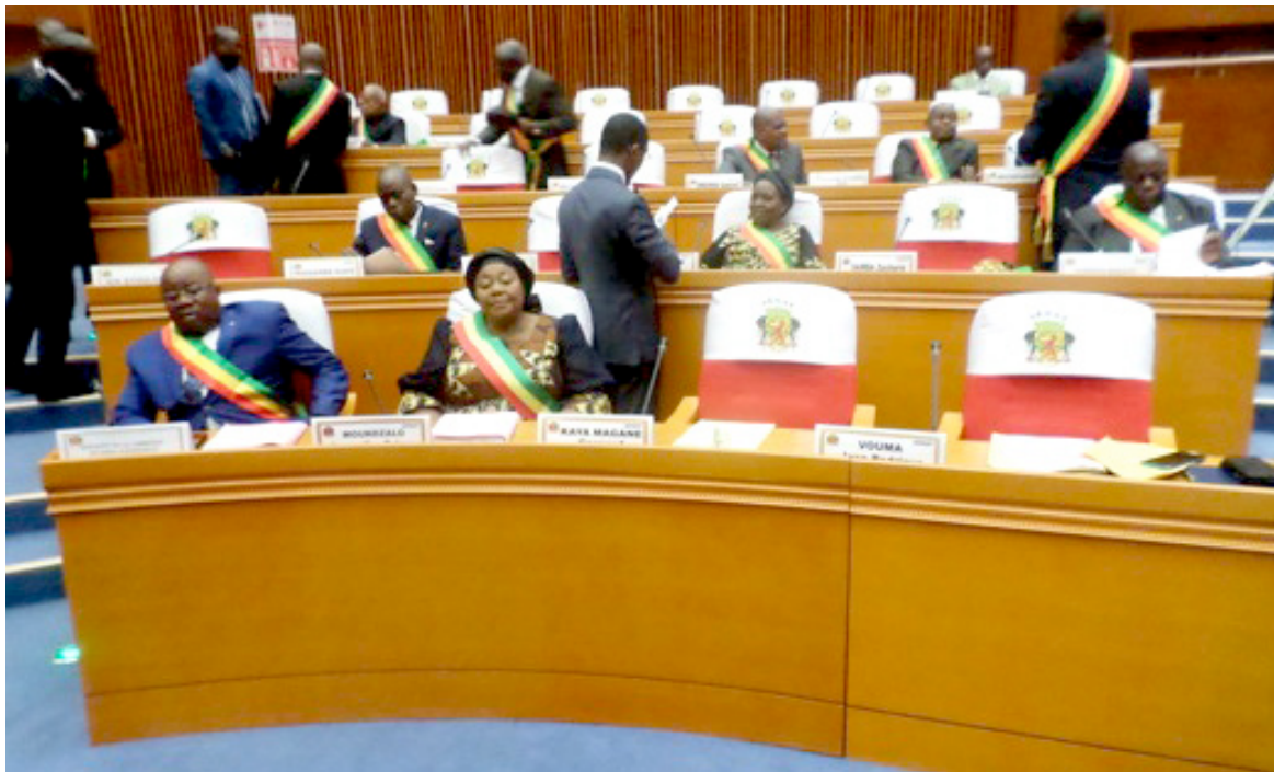
Une vue des sénateurs lors de l'ouverture de la 17 e session

Quant aux nouvelles affaires reçues du gouvernement, on peut citer, entre autres, le projet de loi portant création de l'Institut des hautes études maritimes et fluviales, le projet de loi portant création du Centre national de formation en statistique, démographie et planification, celui portant protection et assistance aux personnes déplacées internes en République du