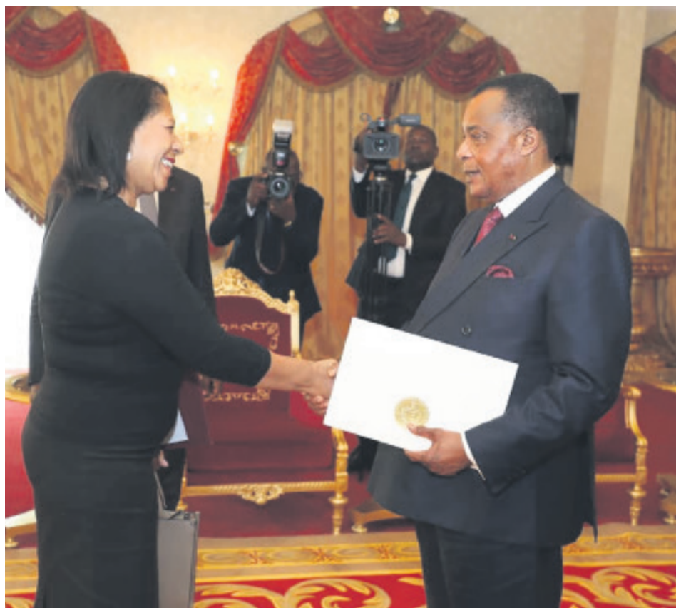
Le chef de l'Etat congolais et l'ambassadeur de Cuba