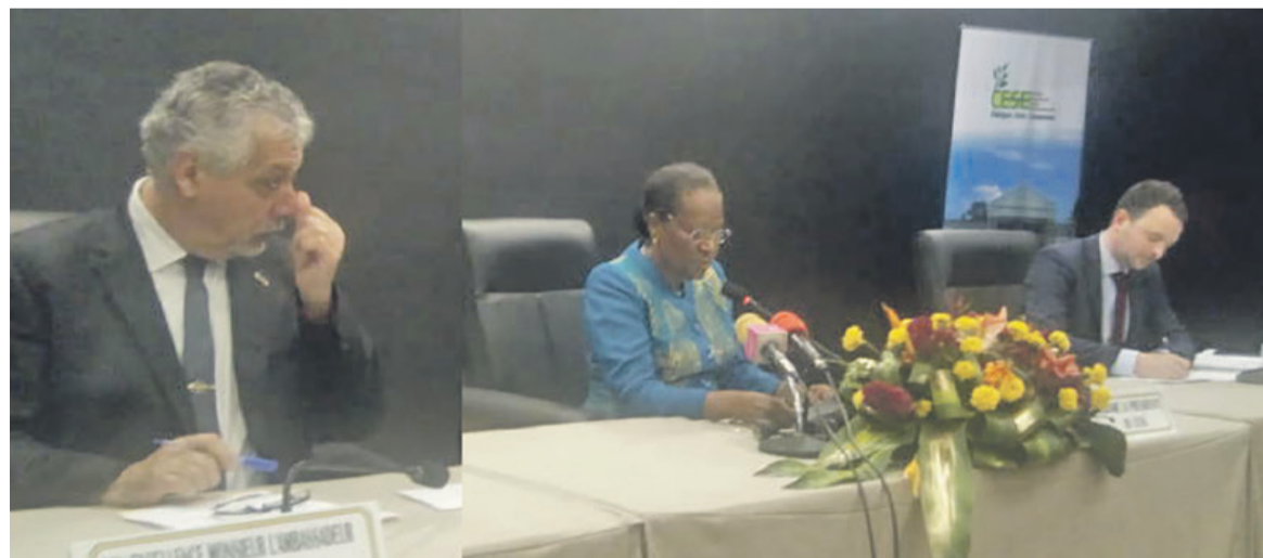
Le podium officiel lors du lancement de la formation

En France, par exemple, le Conseil a été sollicité par le président de la République pour des avis dans un débat national, notamment sur