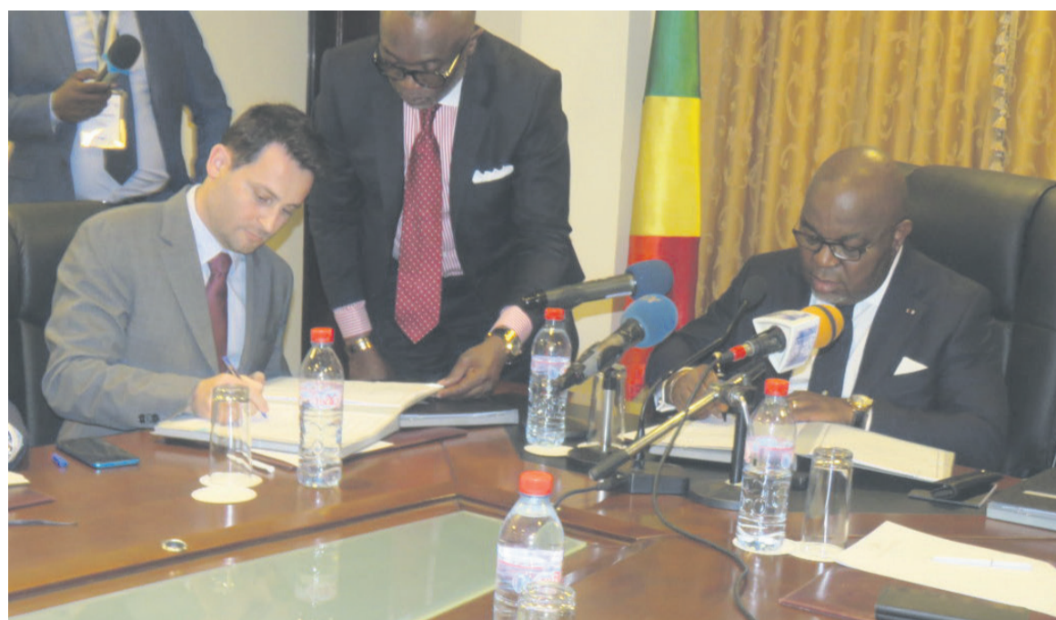
Signature de contrat entre le ministre des Hydrocarbures et le directeur général de la société Aksa Energy Congo

Pour sa part, le ministre des Hydrocarbures a rappelé que la société Aksa Energy Congo est la société opératrice de la centrale électrique à gaz de Djéno. Celle-ci est la première centrale à gaz commercial du Congo construite en 2001 par