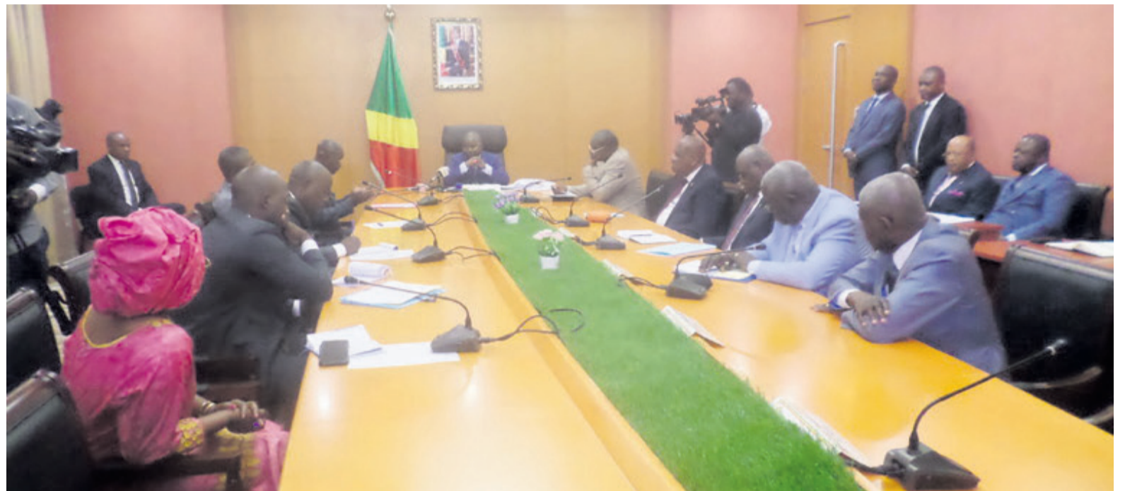
Les membres du collectif et le bureau du Sénat en pleine séance de travail

Face à cette injustice, le collectif des conseillers départementaux et municipaux a sollicité la révision de cette loi avant de proposer au gouvernement que leur soit alloué un traitement mensuel de deux millions cinq cent mille francs FCFA inscrit au budget de