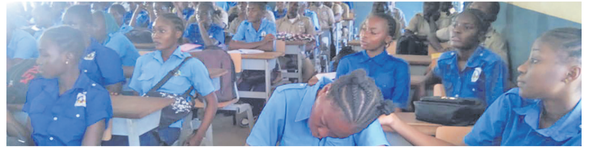
Des élèves du lycée Nganga-Edouard suivant l'orateur du Mojecra/Adiac

Le Mouvement des jeunes congolais pour la réflexion et l'analyse (Mojecra), une organisation non gouvernementale, a échangé, 18 avril à Brazzaville, avec les élèves et le personnel du lycée Nganga-Edouard sur la culture de paix et le vivre-ensemble, dans le cadre de la lutte contre les violences en milieu scolaire.