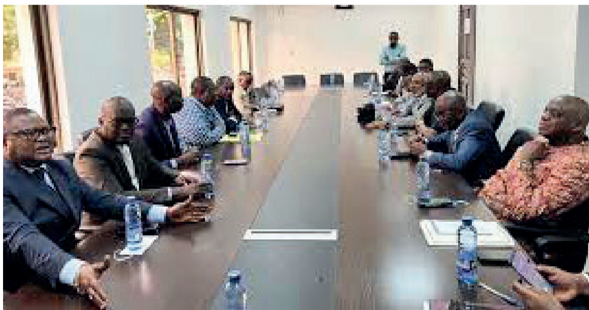
Les dirigeants des clubs de football engagés en Lignes 1 et 2 en RDC

La reprise, ou plutôt la poursuite de la 28e édition championnat national de football -Ligue 1-, ainsi que celui de la Lignes 2 figurent parmi les défis du nouveau ministre des Sports, Claude François Kabulo Mwana Kabulo. La saison est à l'arrêt depuis décembre 2022 à cause des difficultés d'ordre financier et logistique. Et depuis peu, des réunions et des rencontres se multiplient pour une solution concertée de reprise. A l'issue d'un conciliabule entre le ministre des Sports et l'Association des dirigeants des clubs de football du Congo (Adfco), ceux derniers ont fait une déclaration à la presse. « Les clubs engagés aux championnats de la Ligue nationale de football (L1 et L2) se disent prêts à reprendre à partir du 5 mai 2023. Après cette date, ils vont carrément libérer les joueurs et attendre la saison prochaine », ont-ils dit. C'est clairement un ultimatum que les membres de l'Adfco, après