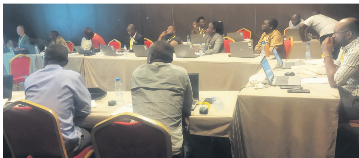
Des participants en pleine formation

Brazzaville abrite, depuis le 12 avril, la deuxième édition du programme PanafGeo. Dix-huit cadres des mines venus de neuf pays d'Afrique francophone se forment à la gestion de l'information géoscientifique, une étape essentielle qui va permettre à ces pays de constituer une base de données minières fiables.