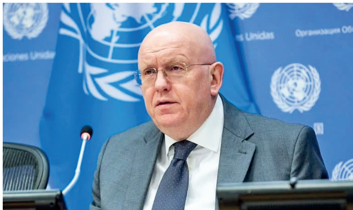
Vassily Nebenzia, l'ambassadeur russe aux Nations unies

«Il est impossible de parvenir à une normalisation durable dans l'est de la RDC par des moyens exclusivement militaires». Ces propos du représentant permanent de la fédération russe à l'ONU, Vassily Nebenzia, reflètent la position de son pays vis-à-vis de l'imbroglio qui caractérise actuellement l'est de la RDC en proie à une instabilité devenue chronique. Préoccupée par les affrontements récurrents entre les