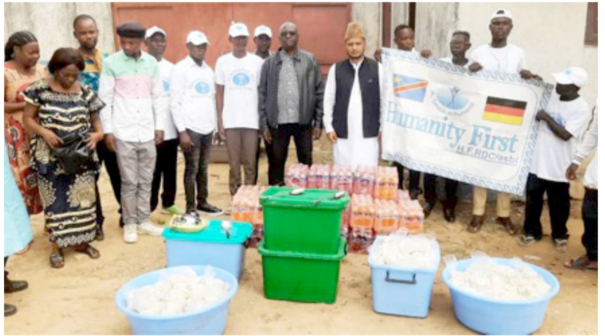
Une vue des provisions pour la circonstance

La journée a été célébrée afin de rendre grâce à Allah pour les bénédictions accordées à tous les fidèles au cours du ramadan. « Pendant cette fête, les musulmans ont, comme à l'accoutumée, assisté au service de