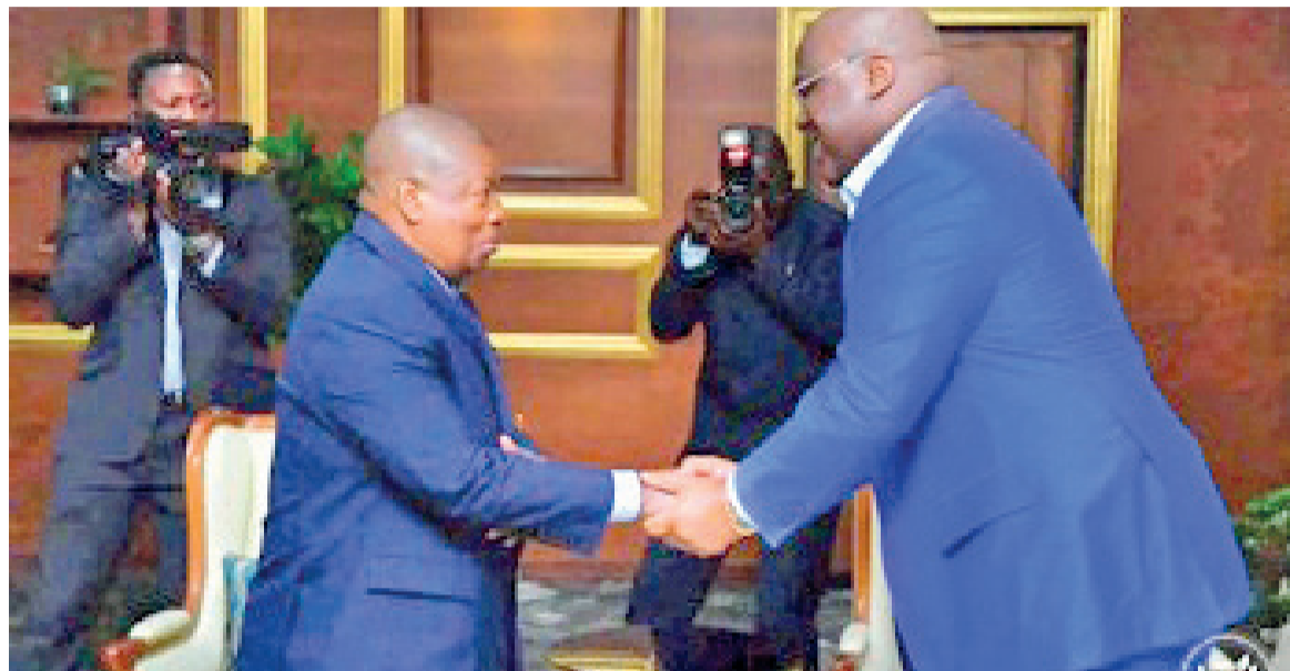
Le chef spirituel de l'Eglise kimbanguiste saluant le chef de l'Etat