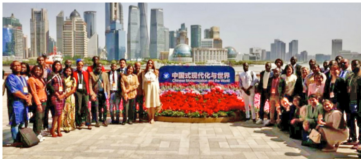
Photo de famille des journalistes étrangers participant au forum DR

souligné que la Chine a trouvé sa voie de modernisation grâce à une pratique autonome. Créant par là une nouvelle forme de civilisation humaine. « Les faits prouvent solidement que la modernisation n'a pas de modèle absolu, et qu'elle n'est pas non plus une question à choix unique. Avec une voie adaptée aux réalités nationales et favorable au développement du peuple, tout pays est en mesure de réaliser le rêve de modernisation », a estimé Qin Gang.