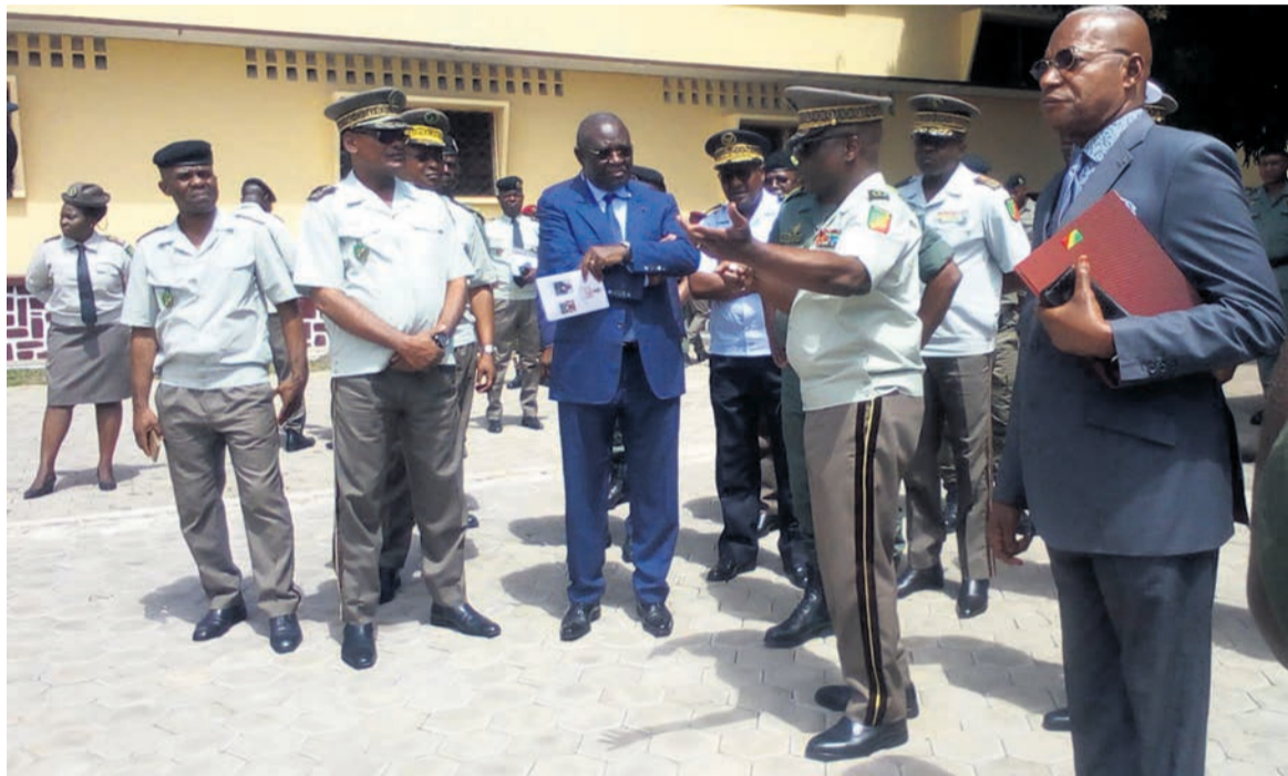
Le ministre de la Défense nationale à l'EMPGL

Au terme de sa ronde, le ministre de la Défense nationale a recommandé aux cadres militaires et enseignants de l'EMPGL d'offrir aux élèves un soutien moral et psychologique ainsi qu'une meilleure formation sportive et militaire de base se fondant sur les critères de sélection des élèves à l'entrée, la rigueur, la discipline, le travail et l'émulation saine. « L'école a perdu son auréole de gloire en science, en technique et en littérature. (...) Les enfants de troupe sont de plus en plus dans la paraisse car les rapports des stages de formation à l'étranger nous parviennent de temps en temps. Nous ne faiblirons pas à rétablir l'effectivité de la vocation d'excellence de l'école », a promis Charles Richard Mondjo. Il a émis le souhait que soient