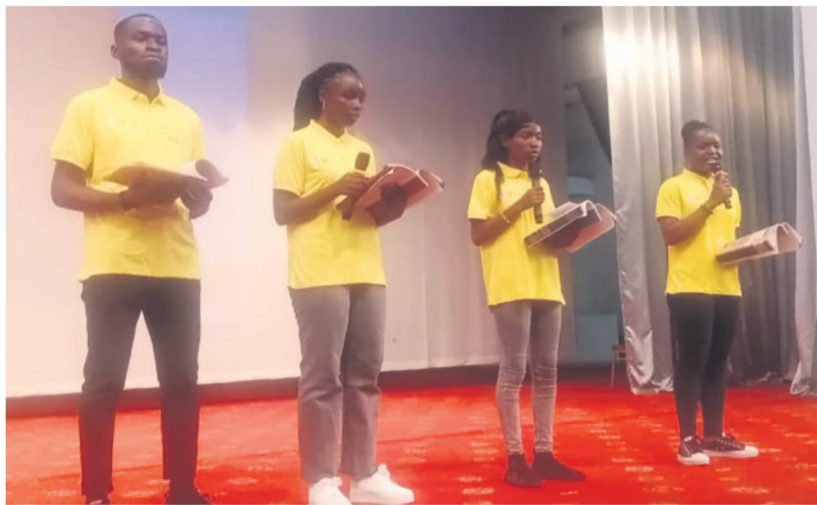
Les apprenants de l'Institut Confucius de l'Université Marien-Ngouabi sur scène