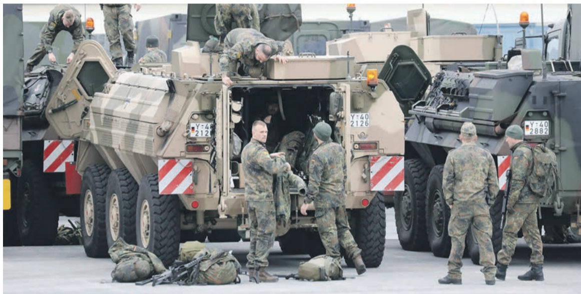
« Dans la situation actuelle, je me demande si nous pouvons poursuivre notre engagement [au Mali] »

La junte a aussi imposé des restrictions aux opérations de la Minusma au sein de laquelle l'Allemagne compte plusieurs centaines de soldats parmi les quelque 12 000 déployés dans ce pays en proie à la propagation djihadiste et aux violences de toutes sortes. C'est la plus importante contribution occidentale, selon un rapport de la mission publié cette semaine. Ce qui n'a pas empêché les Nations unies à exprimer leur inquiétude quant à la sécurité des opérations des Casques bleus après le départ des Français, mais aussi d'autres contingents. Plusieurs pays ont déjà décidé d'arrêter ou de suspendre