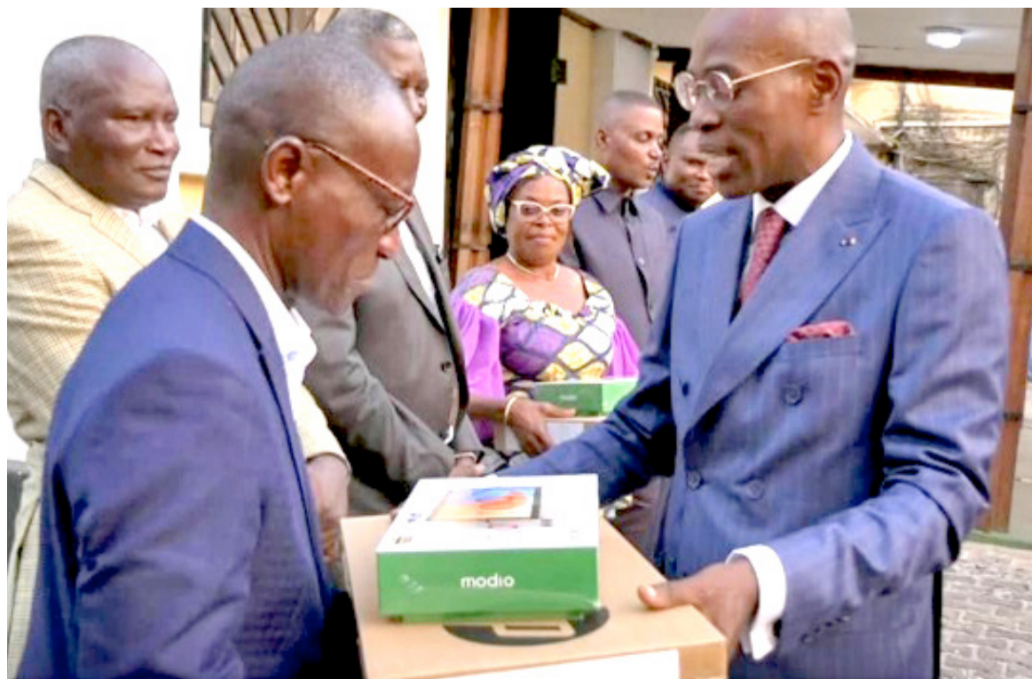
La remise du matériel numérique aux bénéficiaires