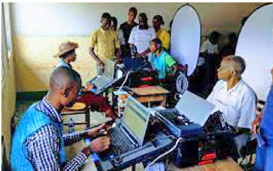
Une opération d'enrôlement des électeurs.

La troisième et dernière aire (avec le Canada et les États-Unis d'Amérique) en cours d'achèvement englobe notamment la partie est de la République démocratique du Congo, en proie aux violences à la suite de l'activisme des groupes armés locaux et étrangers dont le M23,