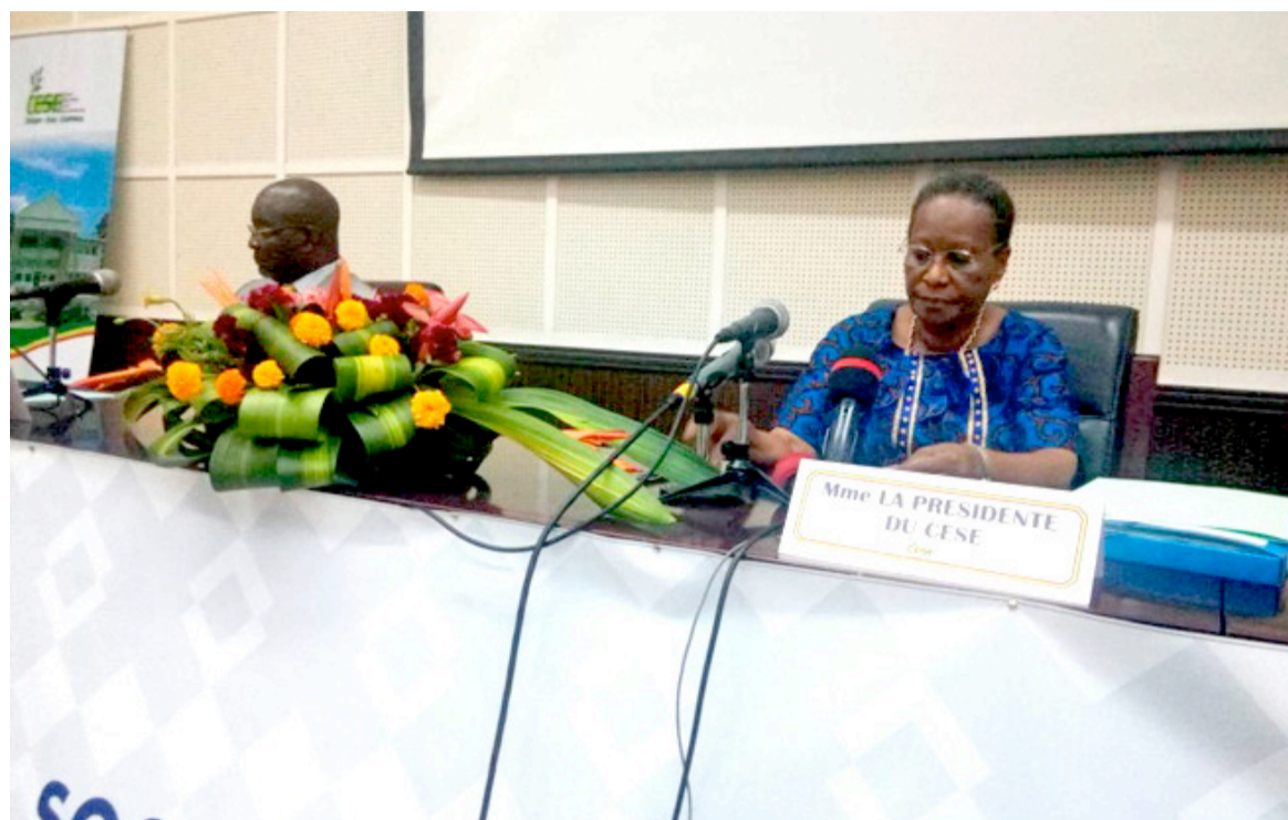
Le podium des officiels à l'ouverture des travaux

Les spécialistes et analystes vont exposer, au cours de cette cinquième session, sur leurs préoccupations et formuler des avis qui seront adressés au président de la République, au Sénat et à l'Assemblée nationale. C'est ainsi que plusieurs thèmes ont été retenus pour rendre ces échanges interactifs, notamment « La Zlécaf: une opportunité pour le développement économique, social et environnemental du Congo », « Les banques et la Zlécaf: rôle du secteur dans le processus de mutation en cours », « Comment rendre les entreprises privées compétitives: le rôle de l'Etat », « La Zlécaf: enjeux et perspectives de la République du Congo » et « La contribution potentielle de la Zlécaf à la croissance et au développement de