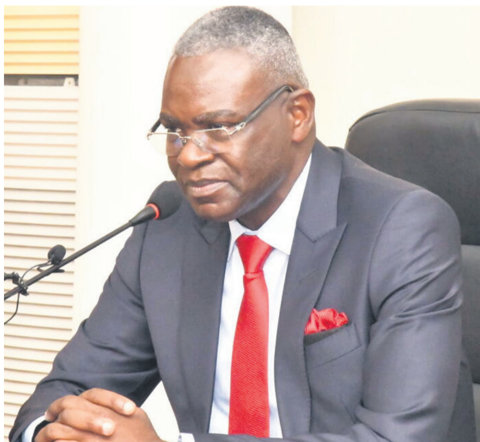
Le Premier ministre, Anatole Collinet Makosso

« Je rappelle que les administrations publiques civiles et de la force publique sont dotées des budgets de fonctionnement et, en aucun cas, elles ne doivent faire supporter aux personnes physiques ou morales des frais inhérents aux missions qu'elles accomplissent. Dès lors, sont formellement proscrites les formulations concussionnistes du genre «les frais de mission, de séjour et d'inspection sont à la charge de la