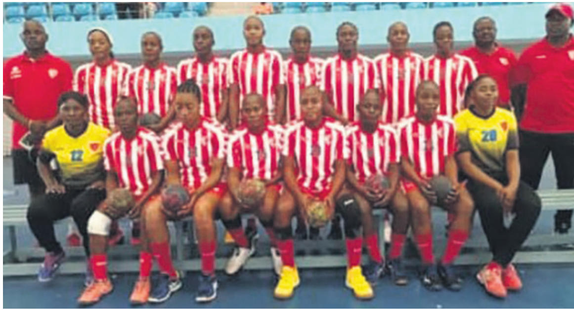
L'équipe de la DGSP/Adiac

« L'ambition est grande parce que les dirigeants sont déterminés. Nous allons également donner le meilleur de nous pour les satisfaire. Notre engagement et notre détermination vont s'illustrer sur le terrain. Nous demandons le soutien de tout genre des Congolais parce que nous partons pour chercher la coupe et non les récompenses secondaires »