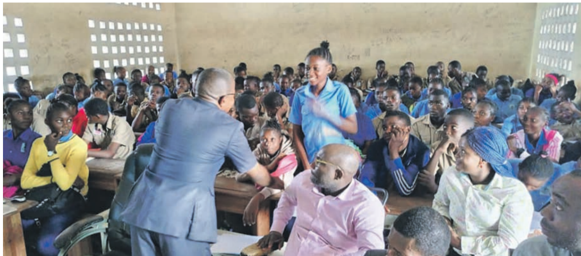
Le Mojecra lors de sa campagne de conscientisation des élèves

Selon lui, les valeurs et principes rattachés à la citoyenneté, au patriotisme et à la culture de paix à apprendre aux jeunes sont, entre autres, la tolérance, la solidarité, le civisme, la loyauté, la justice, la civilité, l'inclusion, la participation, la responsabilité, la concertation ainsi que la résolution pacifique des conflits. Il a poursuivi que les facteurs