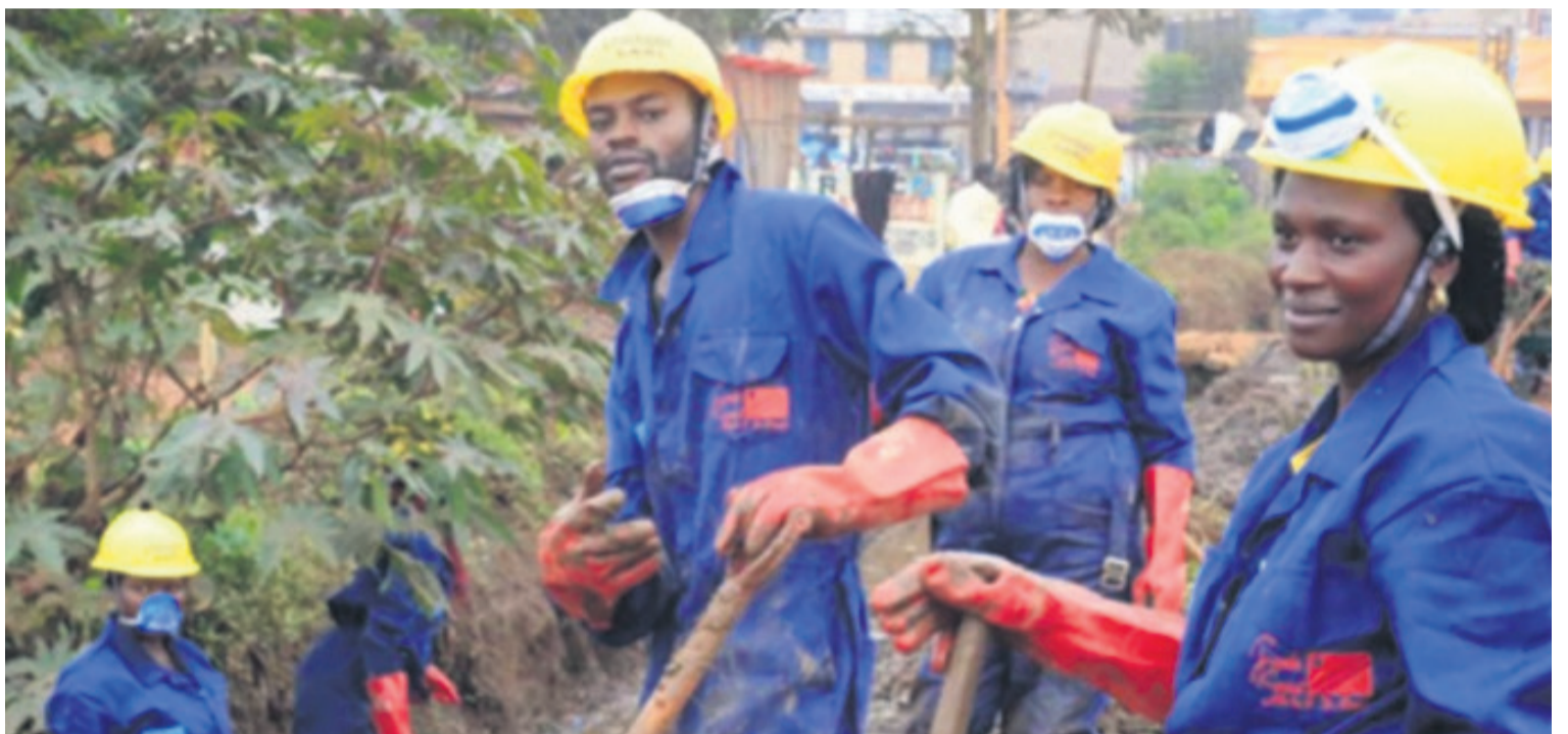
Travaux à haute intensité de main d'oeuvre (Thimo) initiés par la FSRDC à Butembo