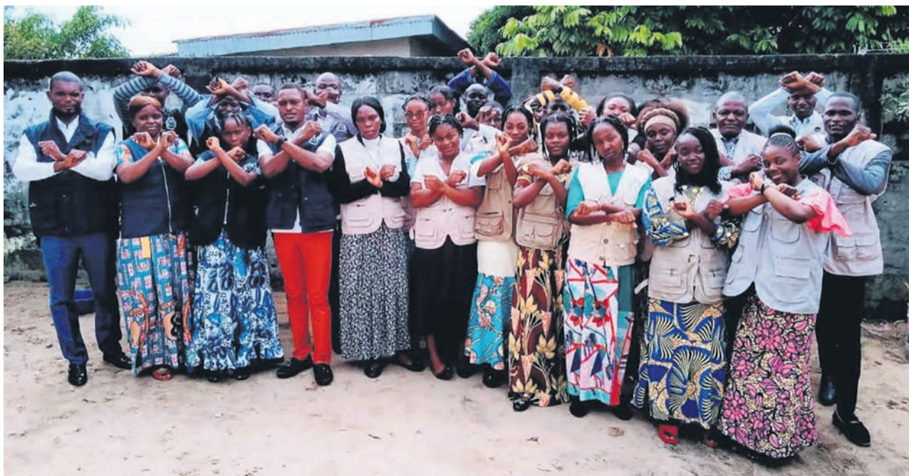
Des membres de l'Ocla/Adiac

L'Assemblée générale des Nations unies, dans sa résolution A/RES/47/237, a proclamé en 1993 le 15 mai de chaque année Journée internationale des familles, pour mieux faire connaître les questions liées à la famille et accroître la connaissance des enjeux sociaux, économiques et démographiques qui les affectent. Pour l'Ocla, cette journée internationale met en avant la famille comme institution et ne devrait pas être célébrée comme une journée ordinaire, mais plutôt avec des actions fortes et décisives pour aider les groupes vulnérables à retrouver le sens même de la famille. Il affirme que « la situation des familles apatrides reste