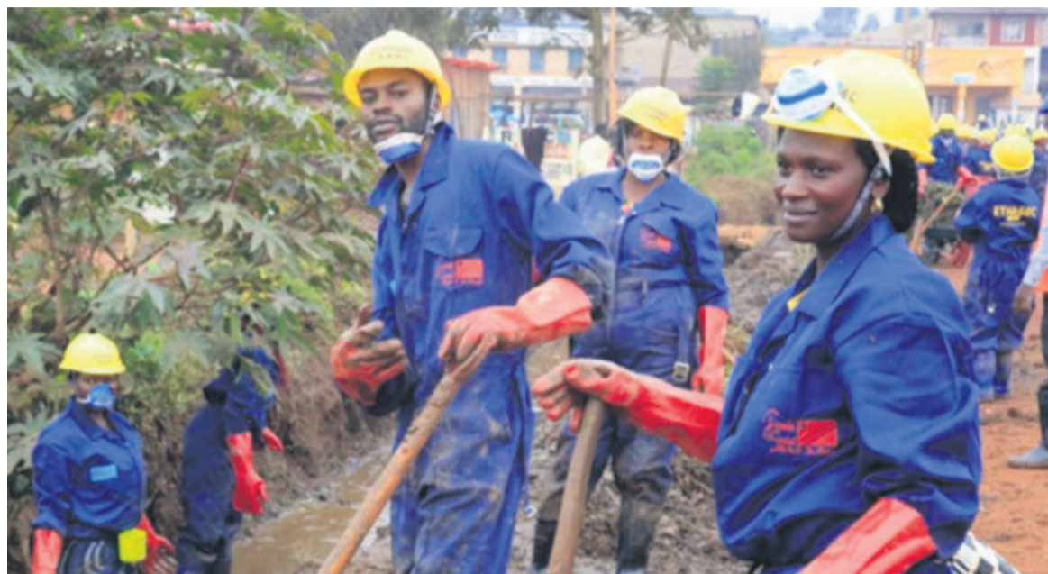
Travaux à haute intensité de main d'oeuvre (Thimo) initiés par la FSRDC à Butembo

Il n'y a plus de brouille entre le groupe de la Banque mondiale (BM) et la présidence congolaise quant à la dissolution du Fonds social de la République démocratique du Congo (FSRDC). Une décision très mal perçue par l'institution bancaire internationale qui avait vite réagi en suspendant ses projets humanitaires et de développement d'une valeur totale d'un milliard de dollars.