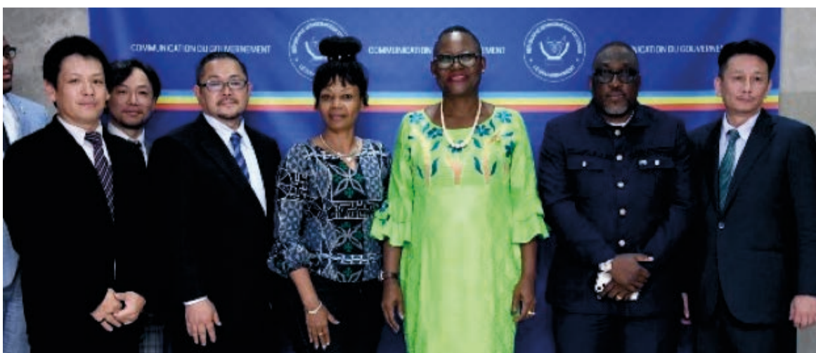
La ministre Antoinette N'Somba posant avec la délégation des investisseurs japonais

Au cours d'une audience qu'elle a accordée récemment aux investisseurs japonais Yoruzu Mining et Corporation Watanabe Jyuken, la ministre des Mines, Antoinette N'Samba Kalambayi, leur a donné des orientations pour une exploration minière saine en République