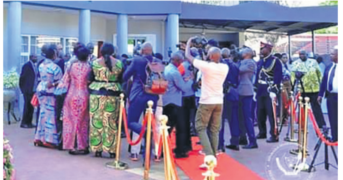
Le bâtiment abritant l'ambassade de la RDC au Botswana

Signe de renforcement de la coopération entre la République démocratique du Congo (RDC) et la République du Botswana, la nouvelle ambassade congolaise a été inaugurée le 12 mai par le chef de l'Etat, Félix-Antoine Tshisekedi Tshilombo, apprend-on de la cellule de communication présidentielle.