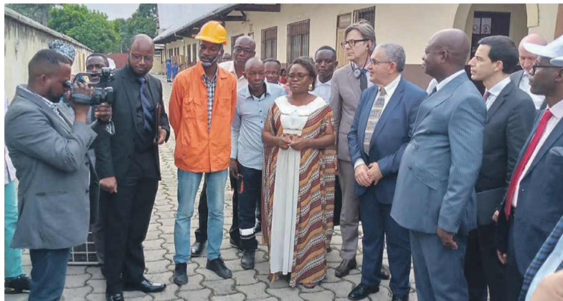
Les administrateurs échangeant avec les formateurs Adiac