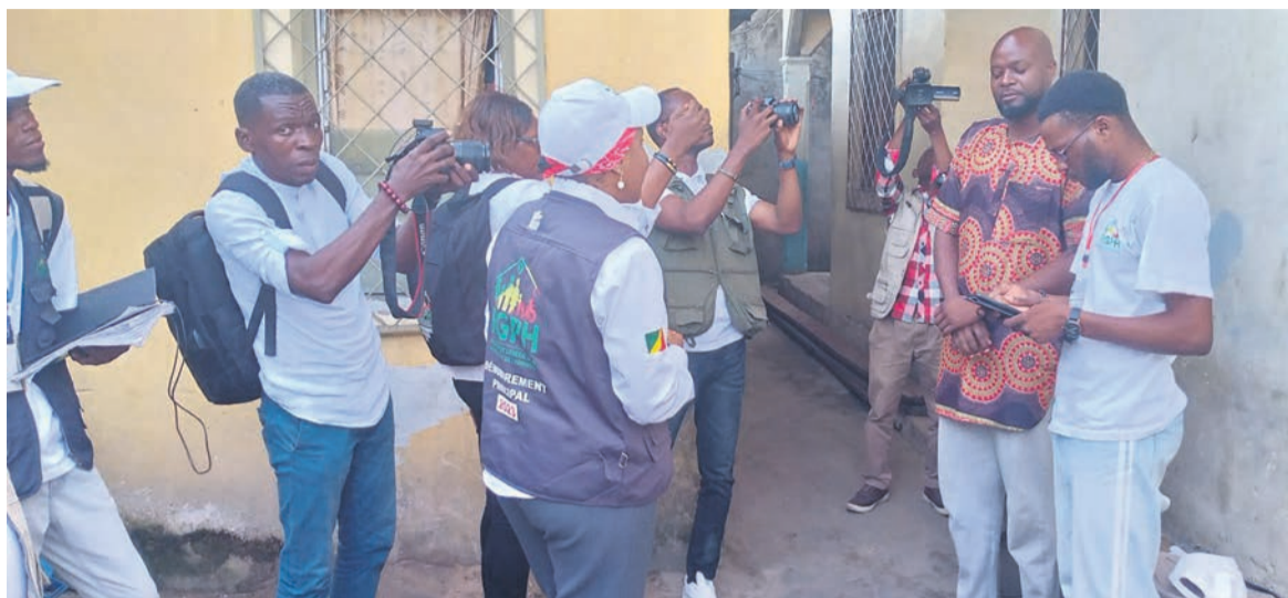
Le suivi de l'enquête dans un ménage à Brazzaville

Elle mise sur l'expérience de ses descentes à l'intérieur du pays pour tenter de remobiliser Brazzaville. Au plan technique, il a