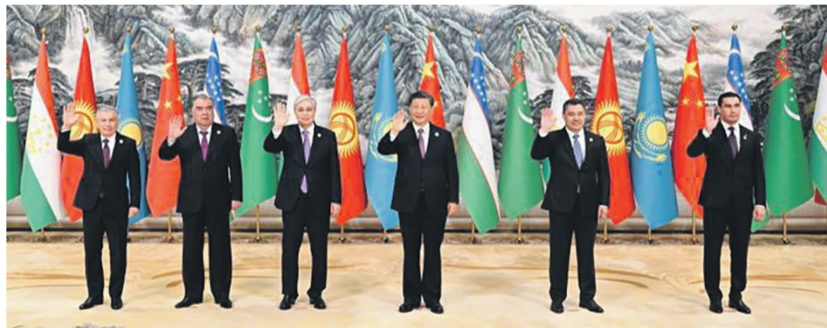
Les six présidents ayant pris part au Sommet Chine-Asie centrale

Par ailleurs, les six chefs d'Etat et leurs gouvernements ont fait le bilan des expériences réussies et sont parvenus à de nouveaux consensus. On