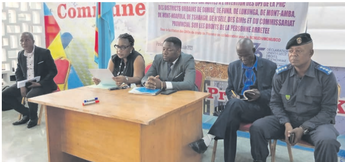
Une vue des organisateurs et des intervenants

Au nombre de ces violations, il y a notamment le dépassement du délai légal de garde à vue, des arrestations arbitraires, des traitements cruels, inhumains et dégradants des détenus, des actes de torture, des morts en détention faute de suivi assuré par les OPJ auteurs d'arrestations, la non-séparation catégorielle des détenus, la multiplicité des pièces de détention, des mauvaises conditions environnementales des centres de détention de