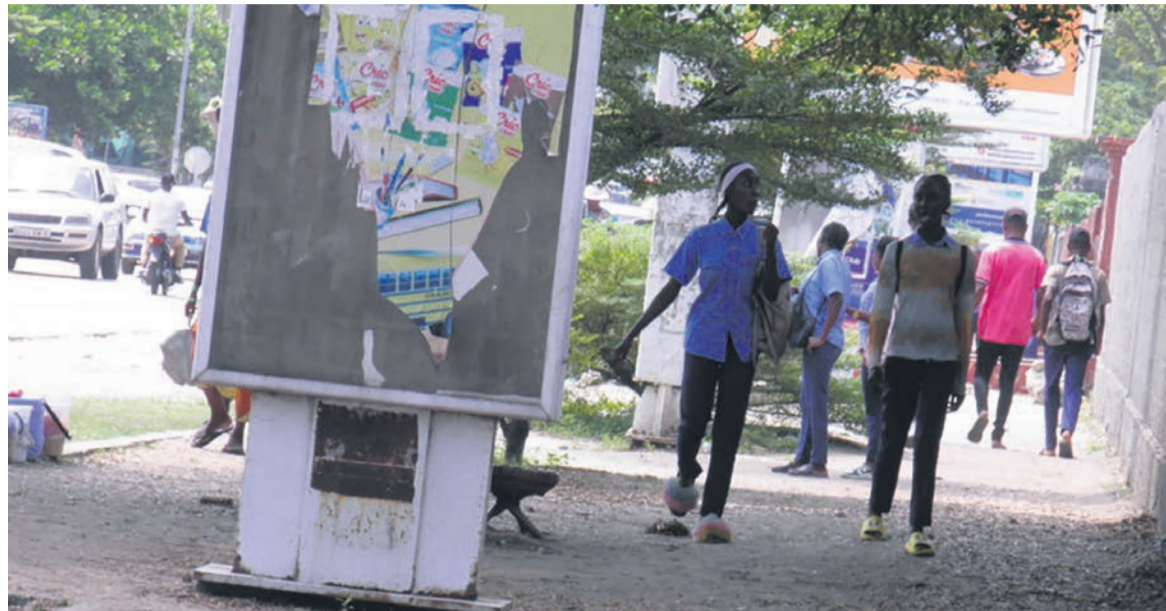
Des lycéennes rentrant à la maison après des heures sans cours

A quelques jours des compositions de fin d'année scolaire 2022-2023 et des examens d'Etat, certains enseignants des établissements secondaire du public ont abandonné le bateau au large. Le cri d'alarme des élèves s'est fait entendre à travers un micro trottoir réalisé aux alentours des lycées de Pointe-Noire.