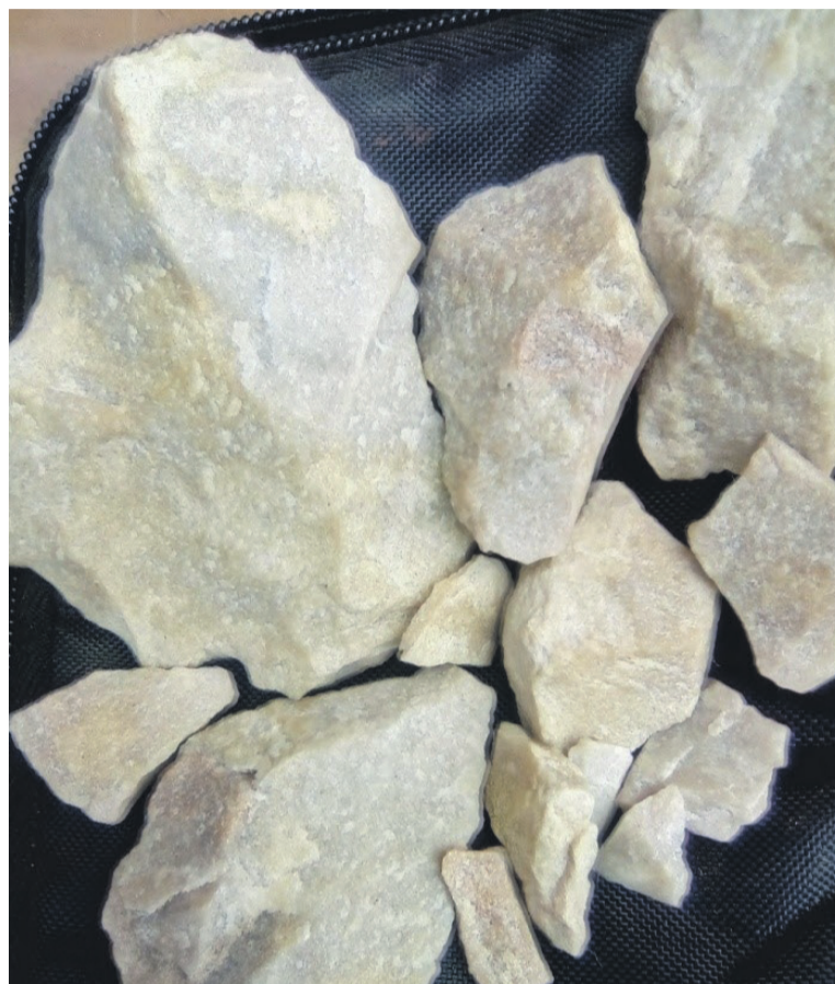
Le premier lithium renouvelable non polluant au monde

S'agissant du tableau synthèse du règlement climatique dans la zone économique spéciale de Brazzaville, le pétrole et les gaz renouvelables donnent : 163 508 ; les mines renouvelables 81 754 ; les plantes à Magnons 81 754 ; les hydrocarbures, gaz po 492 ; et les mines Polluantes 492, ce qui donne un total de 328 000. Pareil pour le Pool. Le sous-total