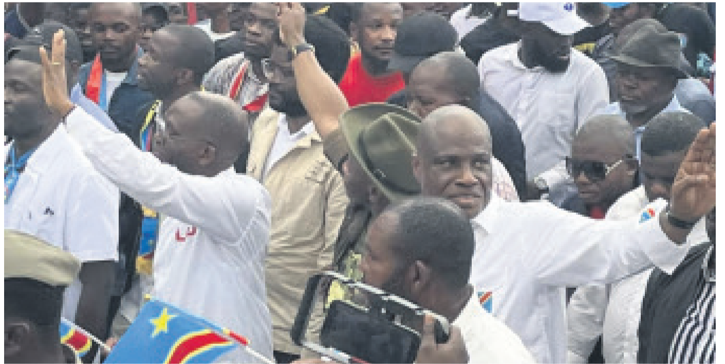
Les leaders de l'opposition, initiateurs de la marche, parmi les manifestants