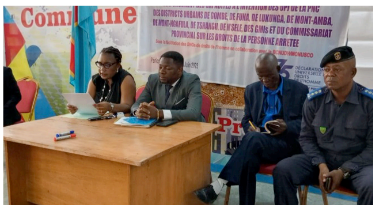
Les organisateurs et quelques intervenants à la tribune