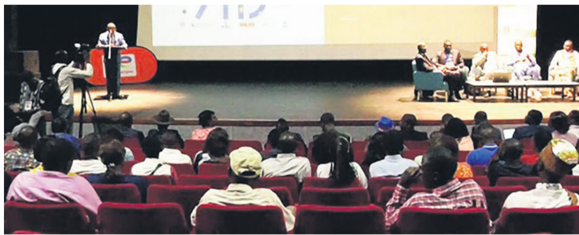
Le public lors de la Journée France Alumni à l'IFC

La matinée de cette Journée France Alumni a été ouverte au public mais l'après-midi a été réservé aux Alumni, sur inscription. Il y a eu des discussions sous forme d'atelier sur l'employabilité, le retour, les activi-