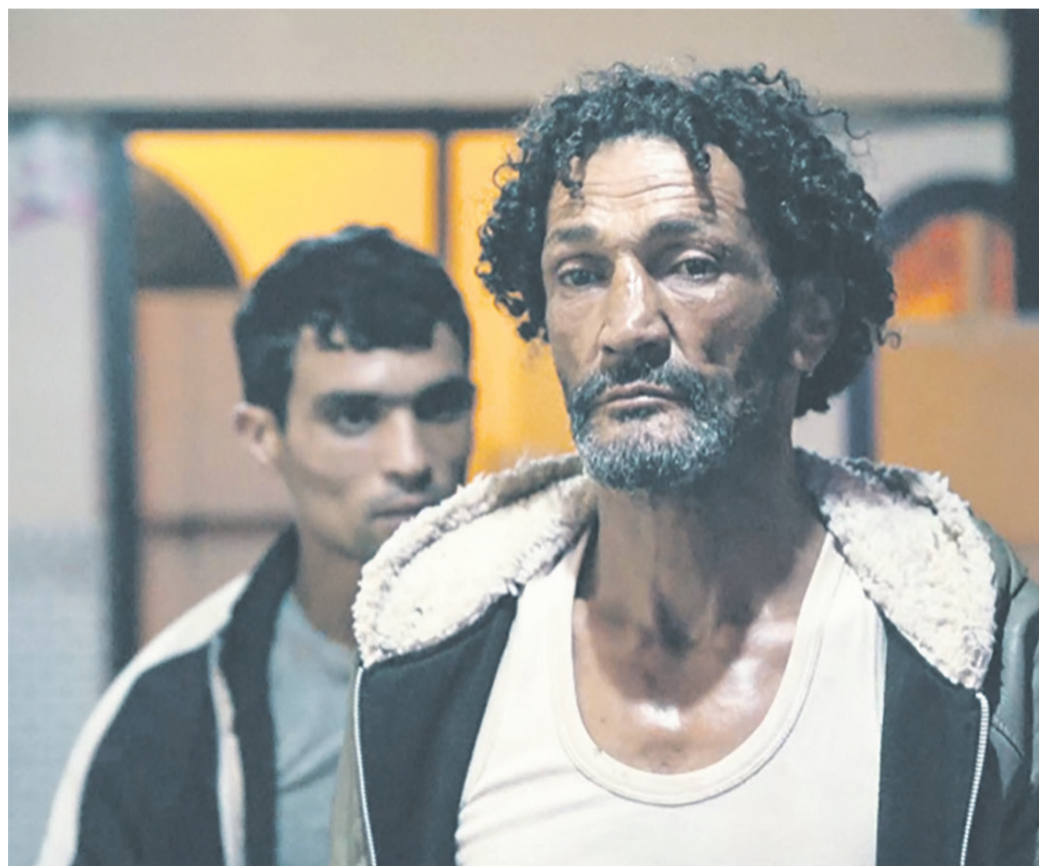
Le film "Les Meutes", réalisé par Kamal Lazraq

"Les Meutes", réalisé par Kamal Lazraq, est un film marocain sé-