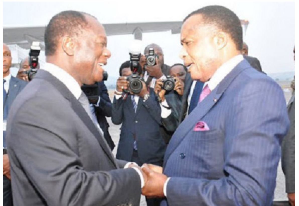
Les Présidents congolais, sassou Nguesso, et ivoirien, Alassane Ouattara

Le président de la République, Denis Sassou N'Guesso, effectue, du 12 au 14 juin, une visite d'Etat en Côte d'Ivoire où il sera fait citoyen d'honneur de la ville d'Abidjan.