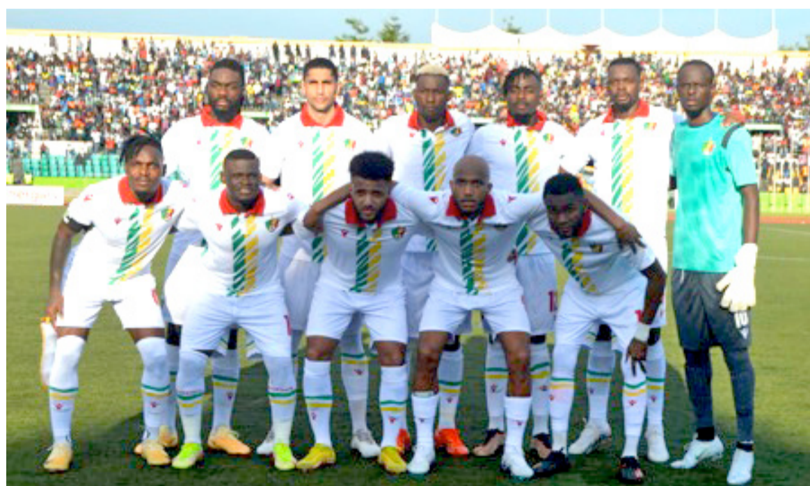
Les Diabes rouges sans plusieurs de leurs cadres contre le Mali/Adiac