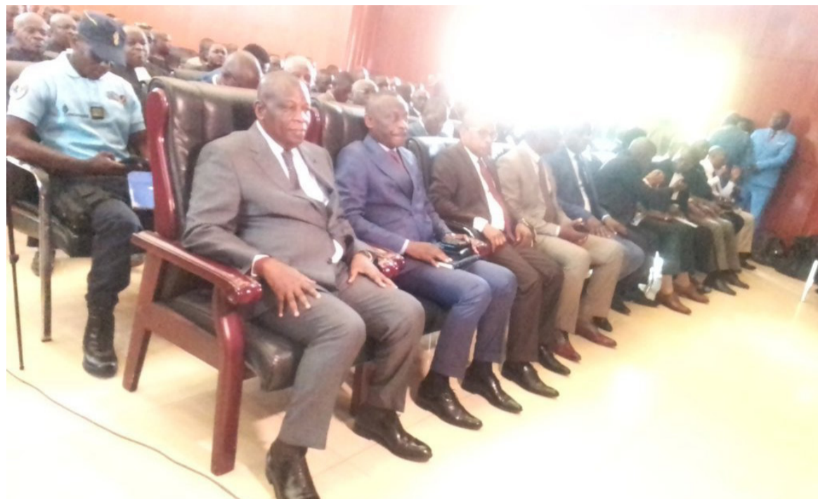
Une vue des participants à la journée de la concorde nationale

Parlant de la devise, « Unité – Travail – Progrès », et de l'hymne national, il a indiqué que cela renvoie à la cohésion des fils et filles du pays car sans l'unité, le pays ne peut fonctionner ni progresser. Pour preuve, a-t-il dit, en écoutant la chanson de Jacques Loubelo, « Congo », et l'hymne national, « La congolaise »,