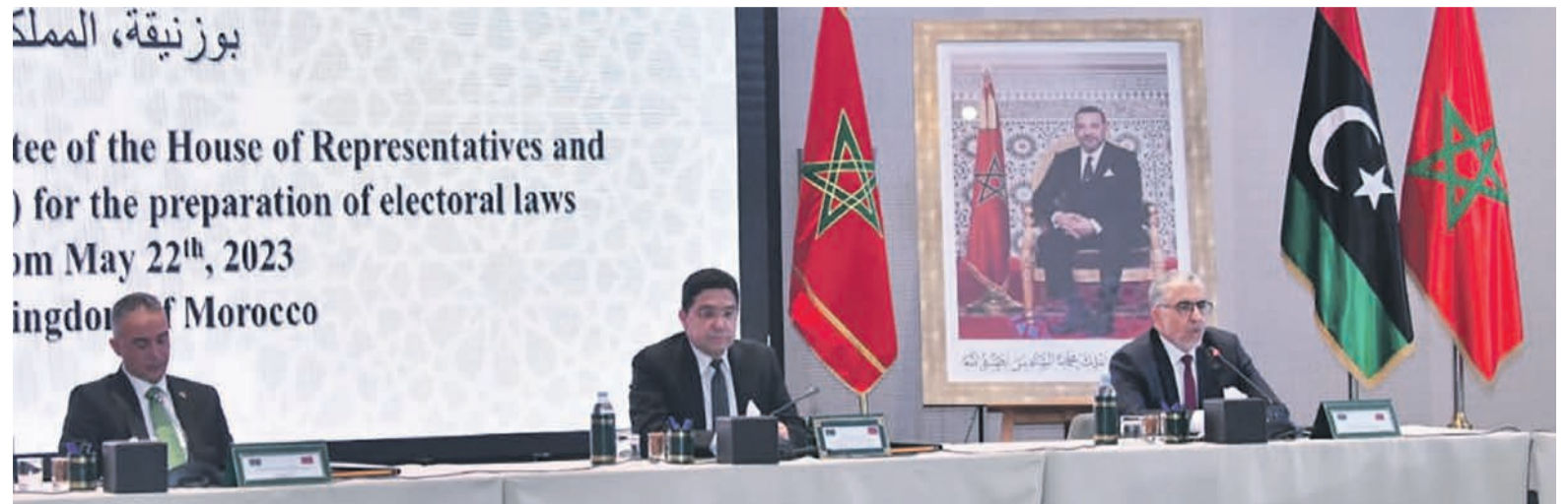
Le présidium des travaux

Convaincue des résultats obtenus, la Manul a réaffirmé son engagement de continuer à travailler avec toutes les institutions libyennes compétentes, y compris le Conseil présidentiel, pour faciliter un processus entre tous les acteurs. Le but étant « d'aborder les éléments contestés du cadre électoral, obtenir l'accord politique nécessaire sur la voie des élections et permettre des règles du jeu équitables pour tous les candidats ». C'est ainsi qu'elle « appelle tous les acteurs