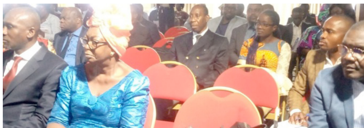
Une vue des participants à la session

Les experts sur les questions environnementales ont adopté, le 9 juin, à Brazzaville, un projet portant attributions, contribution et composition du secrétariat permanent de la Commission nationale de développement durable, à l'issue la session extraordinaire.