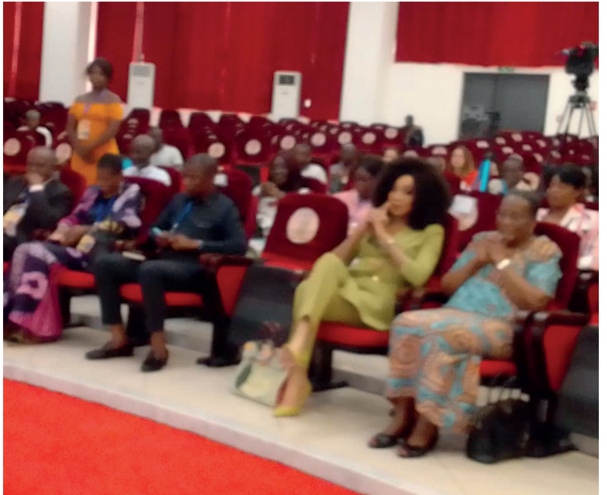
Lancement de la 7e édition de Tropic business forum