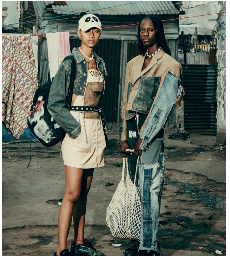
Quelques articles de la marque Thrifty/DR