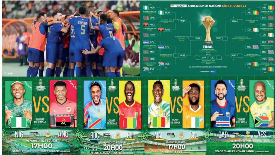
Tableau complet des quarts de finale CAN 2023

Après une phase de groupes de la Coupe d'Afrique des nations (CAN) considérée par de nombreux observateurs comme la meilleure de l'histoire de la compétition, on n'a pas été déçu par les 8es de finale. Les rebondissements et les surprises ont été riches et le paysage de la CAN est profondément renouvelé.