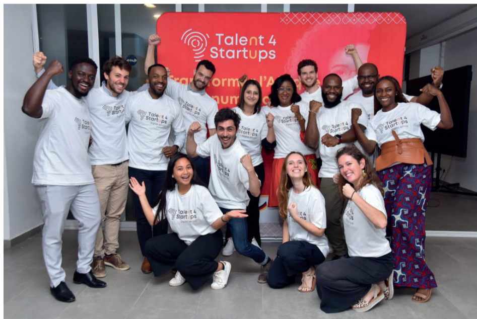
Lors d'une précédente édition de l'événement

Digital Africa invite les personnes qui désirent se former dans les métiers numériques et techniques de soumettre leurs candidatures afin de bénéficier d'un programme de formation baptisé « Talents 4 start-up » avant le 25 février prochain.